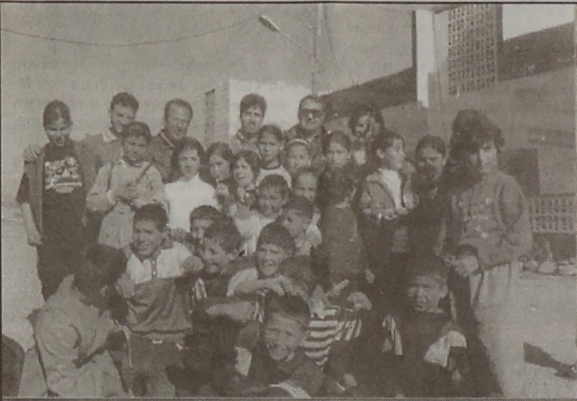
Συγκλονιστικές στιγμές και πρωτογνωμες εμπειρίες εξήσαν όσοι είχαν την τύχη να συμμετάσχουν στη νέα Αποστολή του "ΜΑΚΕΔΝΟΥ" στις χώρες της Μέσης Ανατολής Συ-