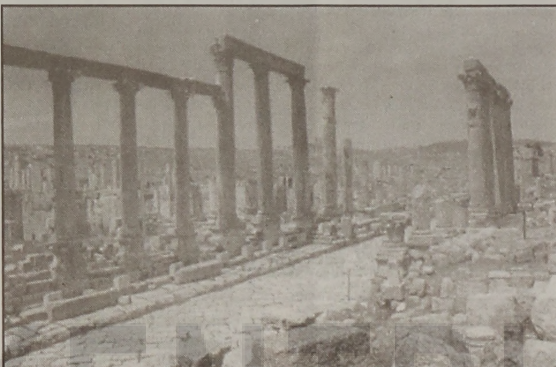
Γερασά. Την πολη που λεγεται ότι εκτίετο ο Μ. Αλεξανδρος, για τους Βακτριους πολεμιστες του