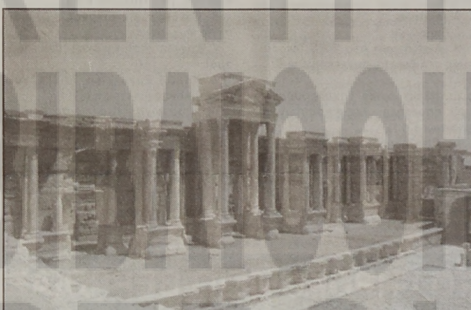
Παλμυρα. Υατεροελληνική πολη, ανεπιω τής χλιδής και ομορφιάς