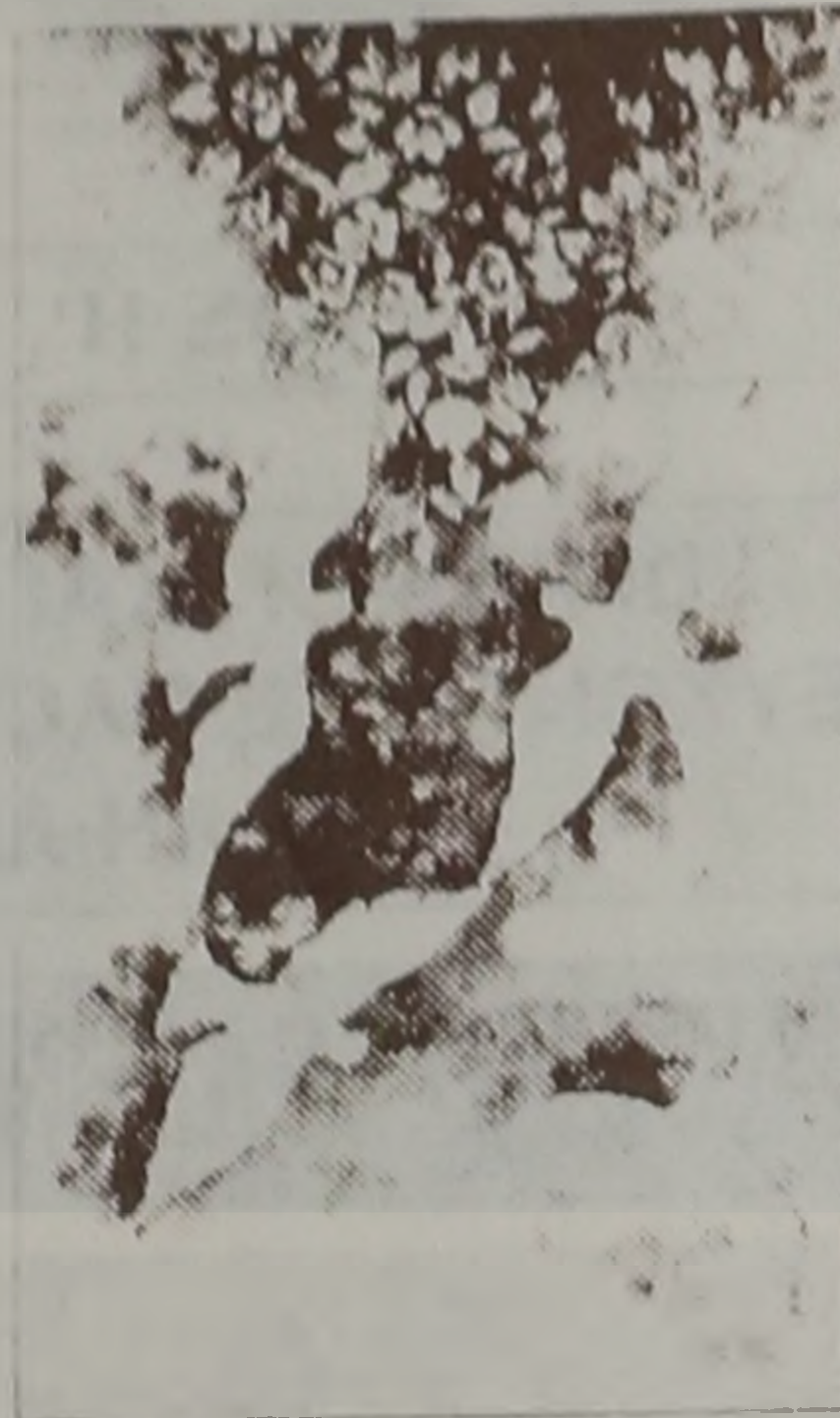
και στο Καλο. Ολα στην ακρη της "αφρουρητής" καρδιας μας, σαν μελι ευωδιαστο χιλιων οριζωντων, στο Ταχυδρομείο. Στη Ναουσα