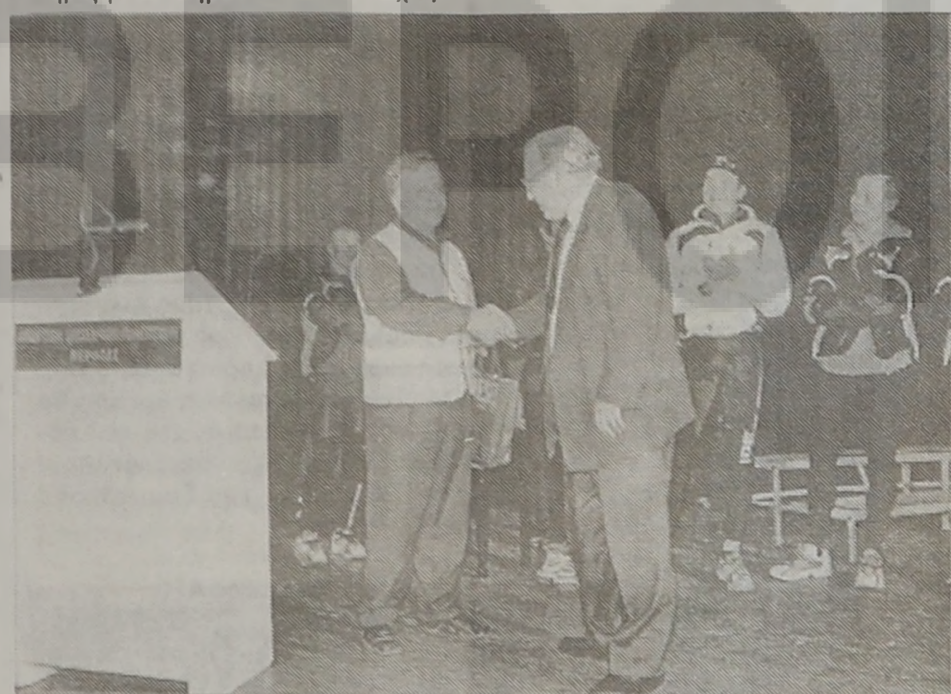
Θελοντικές πρωτοβουλίες στην πόλη.

Συλλόγου, της Ευξείνου Λεσχης, του Μορφωτικού Συλλόγου "ΚΑΛΛΙΘΕΑΣ", Ποδηλατικό Σύλλογο Βερροίας, αλλά και μεμονωμένοι Πολίτες προσέφεραν στον Πρόεδρο του Συλλόγου μεγάλα και μικρότερα ποσά για την ενίσχυση των δραστηριο-