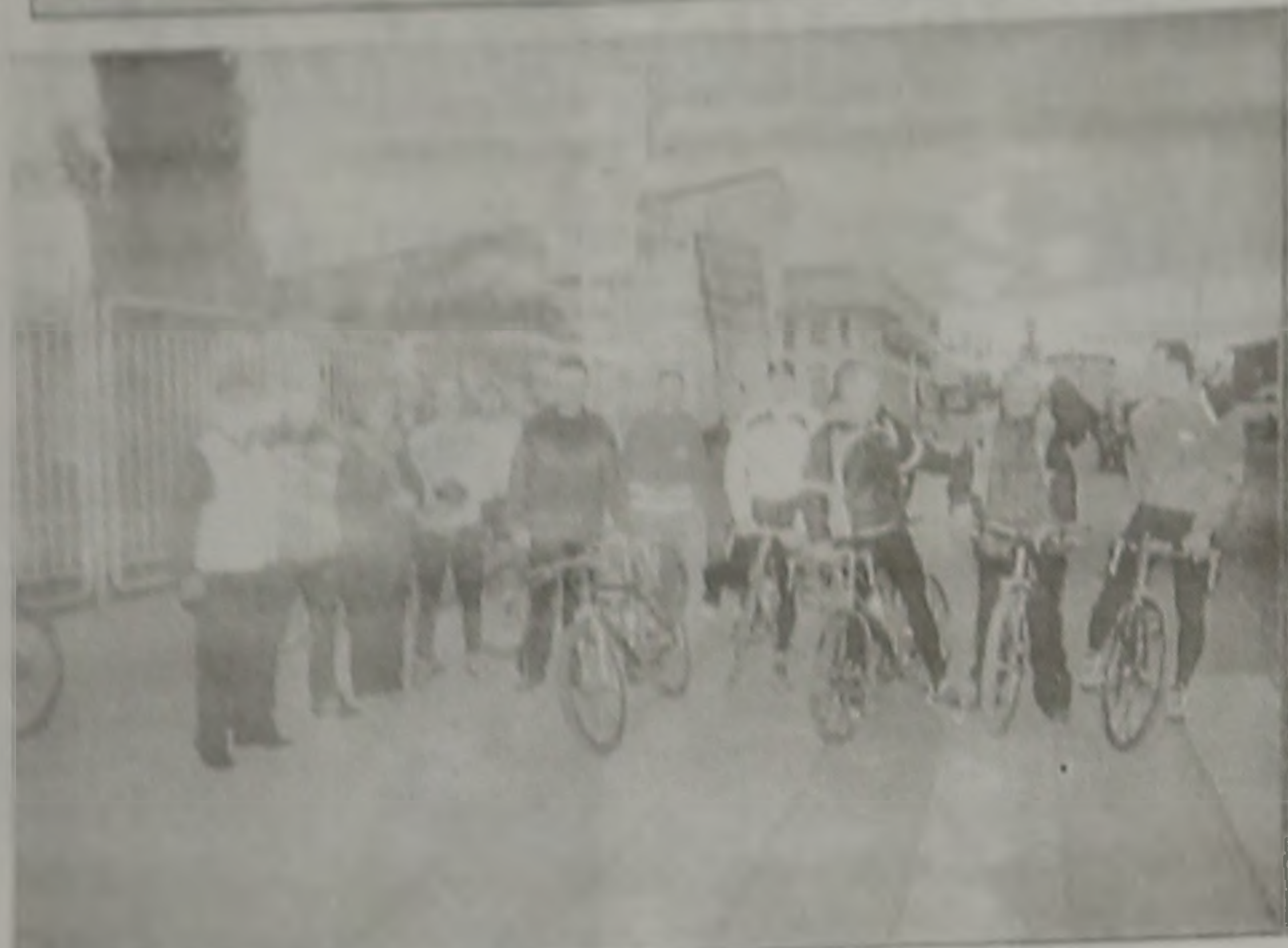
Με επιτυχία οργανώθηκε στη Βερροία η υποδοχή των "Μαραθωνοδρομικών Αγώνων" του Συλλόγου "Χαμογελο του Παιδιού".

Η συνεχεια χρωματίστηκε από την παραδοση των χρημάτων που συγκεντρώσαν εκπροσωπού, του Δήμου, της Πρωτοβάθμιας και Δευτεροβάθμιας Εκπαίδευσης, του Εμπορικού Συλλόγου Βερροίας, του Ροταριανού Ομίλου, του Δικηγορικού