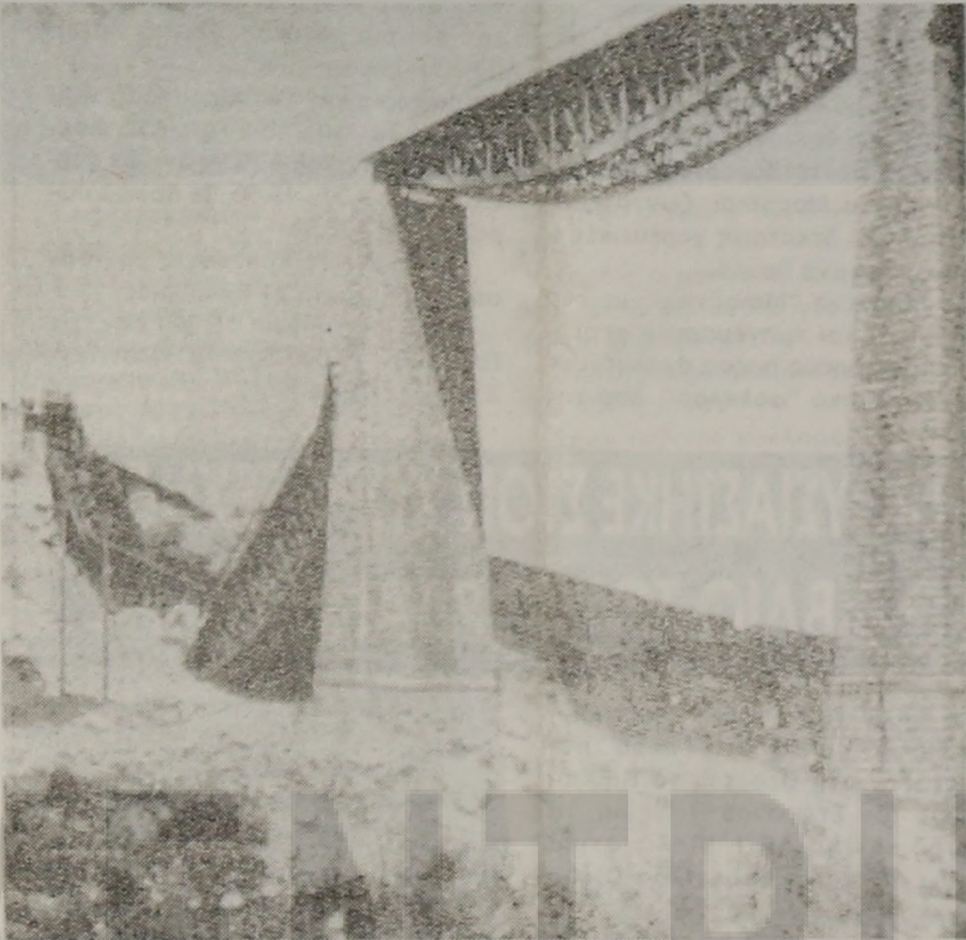
Η Γέφυρα του Γοργοποταμού στην Φθιώτιδα, μετά την ανατίναξη της από τις Ενωμένες Δυνάμεις του ΕΛΑΣ και του ΕΔΕΣ και την συνεργασία των Αγγλων! Κορυφαία Αντιστασιακή Πράξη από έναν Ανυπότακτο Λαό που εδράζει πάνω απ' όλα την Ελευθερία του! Αυτοί ήταν πάντα οι Έλληνες!...