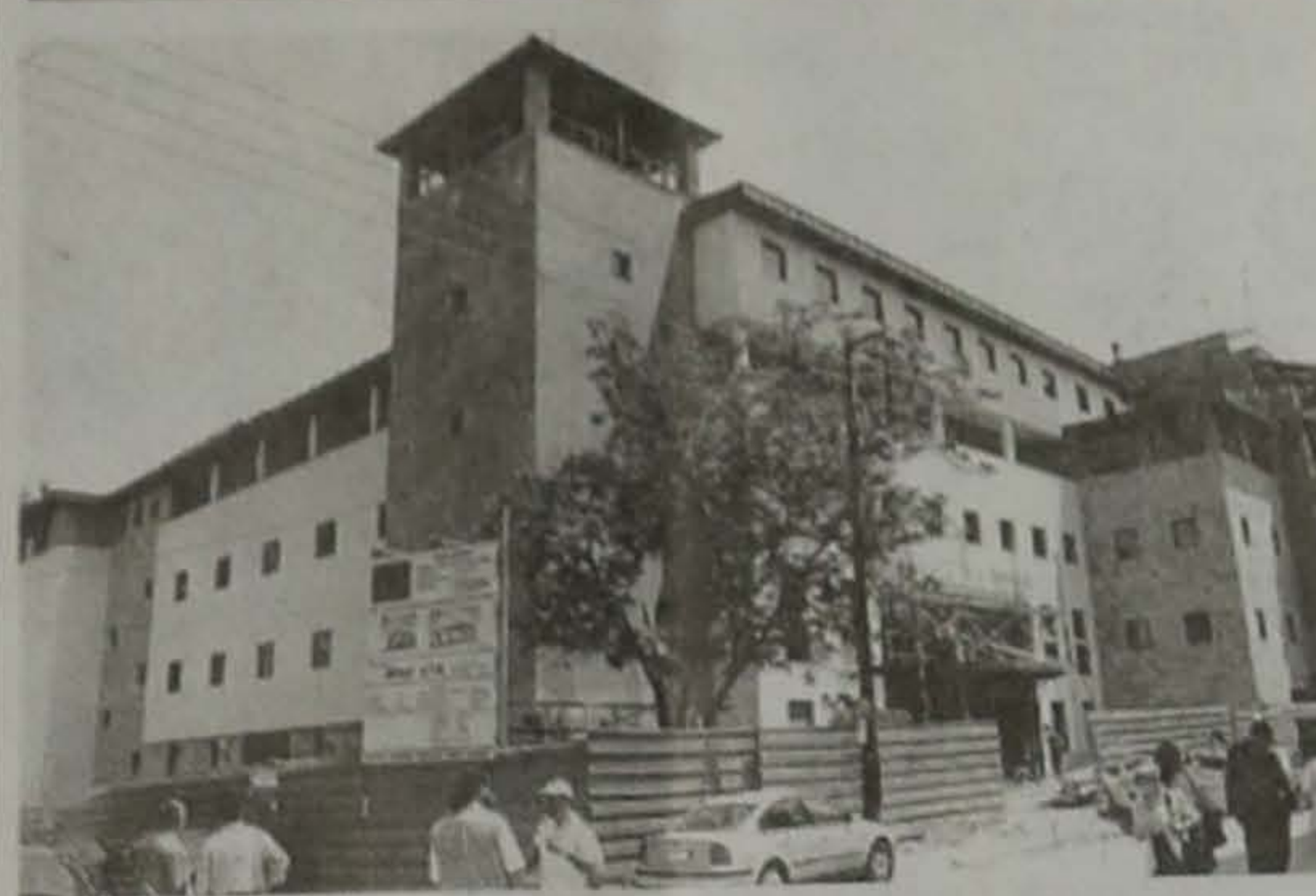
Συνέχεια από την 1η σελίδα

Το Συνεδριακό Κέντρο - Θέατρο του Δήμου Βέρροιας είναι το μοναδικό μεγάλο έργο που προγραμματίστηκε, υλοποιήθηκε και παραδίδεται προς χρήση το Καλοκαίρι του 1999 στο πλαίσιο του Εθνικού Πολιτιστικού Δικτύου Πόλεων του Υπουργείου Πολιτισμού.