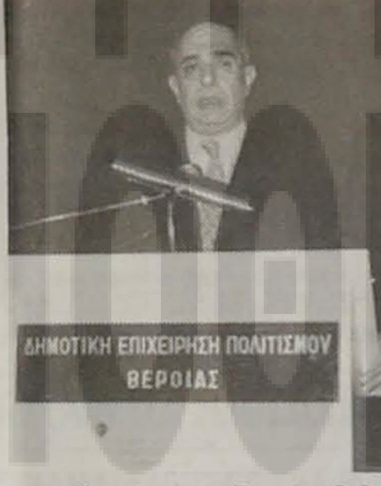
ΔΗΜΟΤΙΚΗ ΕΠΙΧΕΙΡΗΣΗ ΠΟΛΙΤΙΣΜΟΥ ΒΕΡΡΟΙΑΣ