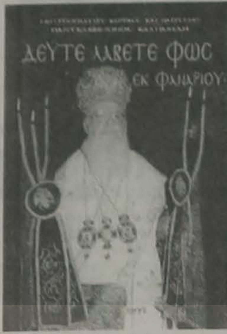
την γαλήνια μορφή του Πατριάρχη μας.