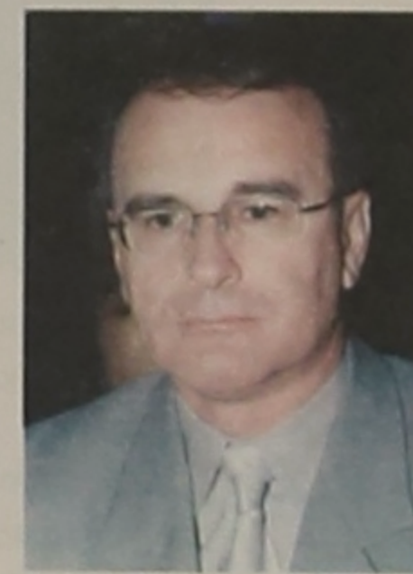
Επιμέλεια Καπουρτίδης Χαράλαμπος

Την άριστη διοργάνωση της 14ης χορευτικής συνάντησης είχε ο γυμναστικός σύλλογος «ΚΙΜΩΝ» Δήμου Ευλοτύμβου.