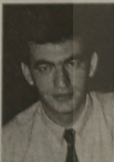
Γράφει ο Χαραφαίδης Αβραάμ

Η περιοχή της Ματσούκας βρίσκεται στην καρδιά του Πόντου, μεταξύ της Τραπεζούντας και της Αργυρούπολης, ανάμεσα στα παράλια του Εύξεινου και τα όρη Κουλαντάγ - Ζύγανα - Παρυάδρης, που αποτελούν τη διαχωριστική οριογραμμή Ματσούκας - Χαλδίας και ορθώνονται σε υψόμετρο άνω των 2.500 μέτρων. Άλλα βουνά της περιοχής είναι το Καράκαπαν, το Χορόζνταγ, το όρος Μελά κ.