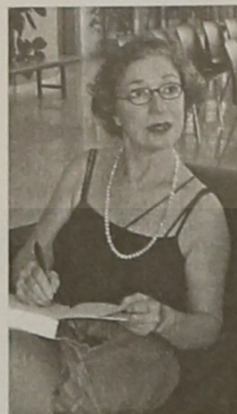
Η συγγραφέας Thea Halo υπογράφει το βιβλίο επισκέψεων της Ευξείνου Λέσχης Βέροιας

Σκεφτείτε την Παγκόσμια κινητοποίηση, το μέγεθος της προσφοράς, τα χαμόγελα των Ποντίων από την ικανοποίησή τους για τη συμμετοχή τους σε αυτό το ιδιότυπο Παγκόσμιο μνημόσυνο και αντίστοιχα την προβολή αυτού του τόσο σημαντικού κοινωνικού γεγονότος από τα Παγκόσμια ΜΜΕ. Η δύναμη του κοινωνικού μηνύματος και της κοινωνικής προσφοράς της Αιμοδοσίας προς το Συνάνθρωπο και της Δεντροφύτευσης στο Περιβάλλον, απέναντι στη στείρα άρνηση της Τουρκίας να συμβιβαστεί με το παρελθόν της και να αναγνωρίσει τη Γενοκτονία των Ποντίων. Δεν έχει συμβεί ποτέ ανάλογη κίνηση με τέτοιες διαστάσεις, και το μέγεθος του κοινωνικού μηνύματος θα καταδείξει την υπεροχή του Πολιτισμού έναντι της βαρβαρότητας κάθε Γενοκτονίας, παρελθούσης ή σύγχρονης.