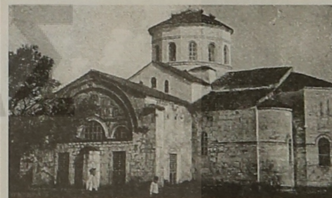
Μονή Αγ. Σοφίας στην Τραπεζούντα.