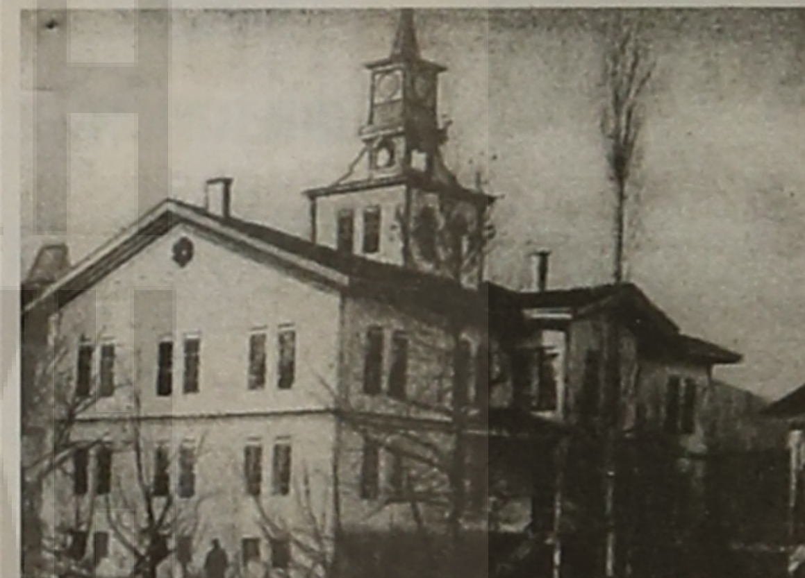
Το κολέγιο "Ανατόλια" στη Μερζιφούντα