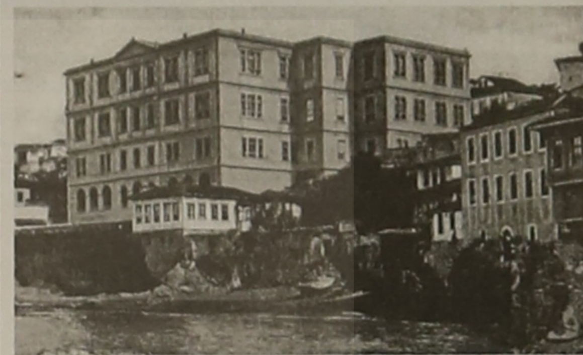
Το Φροντιστήριο της Τραπεζούντας