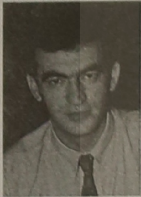
Γράφει ο Χωραφαΐδης Αβραάμ

Δεν ήταν πολιτεία η Σάντα. Ήταν ένα συγκρότημα 7 χωριών - συνοικιών σκαρφαλωμένων στον ορεινό όγκο