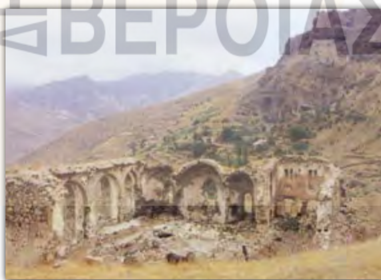
Τα ερείπια της Μητρόπολης (ναός Αγίου Γεωργίου)

Για να κάνουν τους Έλληνες πιο πρόθυμους γι' αυτό το βαρύ και επικίνδυνο έργο, τους παραχώρησαν πολλά προνόμια. Οι μεταλλουργοί ονομάζονταν (άνθρωποι του κράτους) και θεωρούνταν δημόσιοι υπάλληλοι. Δεν καταπιέζονταν από τους Τούρκους και χάρη σ' αυτούς απολάμβαναν σχετική ελευθερία και οι άλλοι Έλληνες ε-παγγελματίες. Για το λόγο αυτό στην Αργυρούπολη κατέφευγαν από όλο τον Πόντο όσοι ήθελαν να αποφύγουν την βαναυσότητα των Τούρκων.