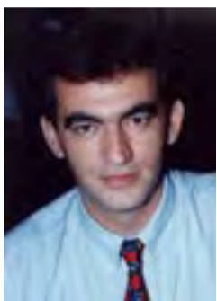
Επιμέλεια: Χωραφαΐδης Αφραΐμ

Ένας τόπος του οποίου η μακρόχρονη ιστορία είναι συνυφασμένη από τη μια πλευρά με το χρυσό και το ασημί που εξαγόταν επί αιώνες από τα ορυχεία, που ήταν διά-σπαρτα στην περιοχή, και από την άλλη με τη δράση των Ακριτών που υπερασπιζό-νταν το Βυζάντιο και την Αυτοκρατορία της Τραπεζούντας στα αμέτρητα κάστρα που ορθώνονται στις βουνοκορφές της περιοχής.