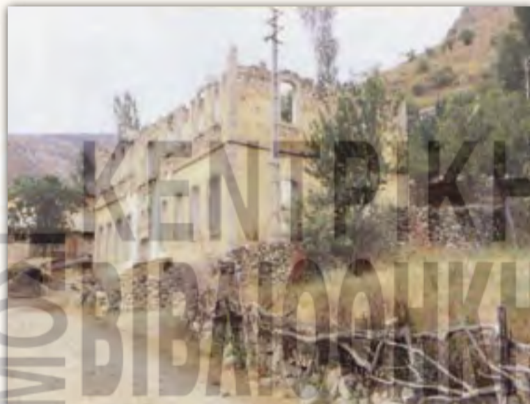
Τα ερείπια του Φροντιστηρίου