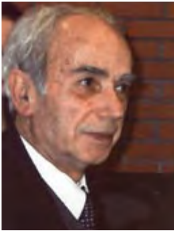
Του αείμνηστου Ιου διευθυντή του Αργοναύτη και επίτιμου προέδρου της Ε.Λ.Β.

ΑΝΑΔΗΜΟΣΙΕΥΣΗ ΑΠΟ ΤΟ 1ο ΦΥΛΛΟ ΤΟΥ ΑΡΓΟΝΑΥΤΗ (ΙΑΝΟΥΑΡΙΟΣ 1989)