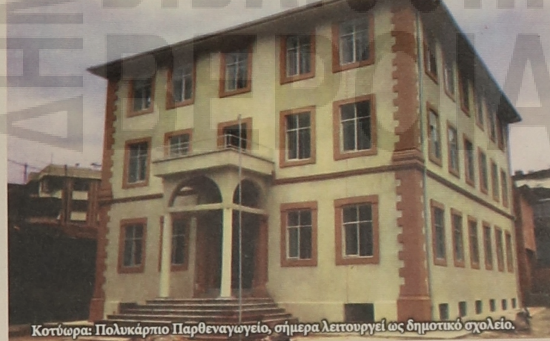
Κοτώρα: Πολυκάρπιο Παρθεναγωγείο, σήμερα λειτουργεί ως δημοτικό σχολείο.

2. Στη συνέχεια η εκπαίδευση αναπτύσσεται σημειώνοντας σημαντική πρόοδο στην αύξηση μαθητών, ίδρυση σχολείων, αλλά και στην ποιότητα παρεχομένων γνώσεων. (Το 1860 υπήρχαν 100 σχολεία στοιχειώδους εκπ/σης και 15 «ελληνικά σχολεία»). 3. Από το 1880 και ύστερα, η εκπαίδευση παρουσιάζει αλματώδη ανάπτυξη. Σχολεία αναγείρονται παντού, σε πόλεις και χωριά. Δημιουργούνται βαθμίδες εκπ/σης: νηπιαγωγείο, δημοτικά σχολεία, σχολαρχεία, ημιγυμνάσια και γυμνάσια. Πύρω στο 1890 υπήρχαν πεντακόσια περίπου σχολεία των δύο βαθμίδων (στοιχειώδους και μέσης), στα οποία φοιτούσαν 20.500 μαθητές και δίδασκαν 543 δάσκαλοι και καθηγητές. 4. Στις αρχές του 20ου αιώνα η πρόοδος της ελληνικής παιδείας στον Πόντο φτάνει στο απόγειό της. Από κανένα χωριό, έστω