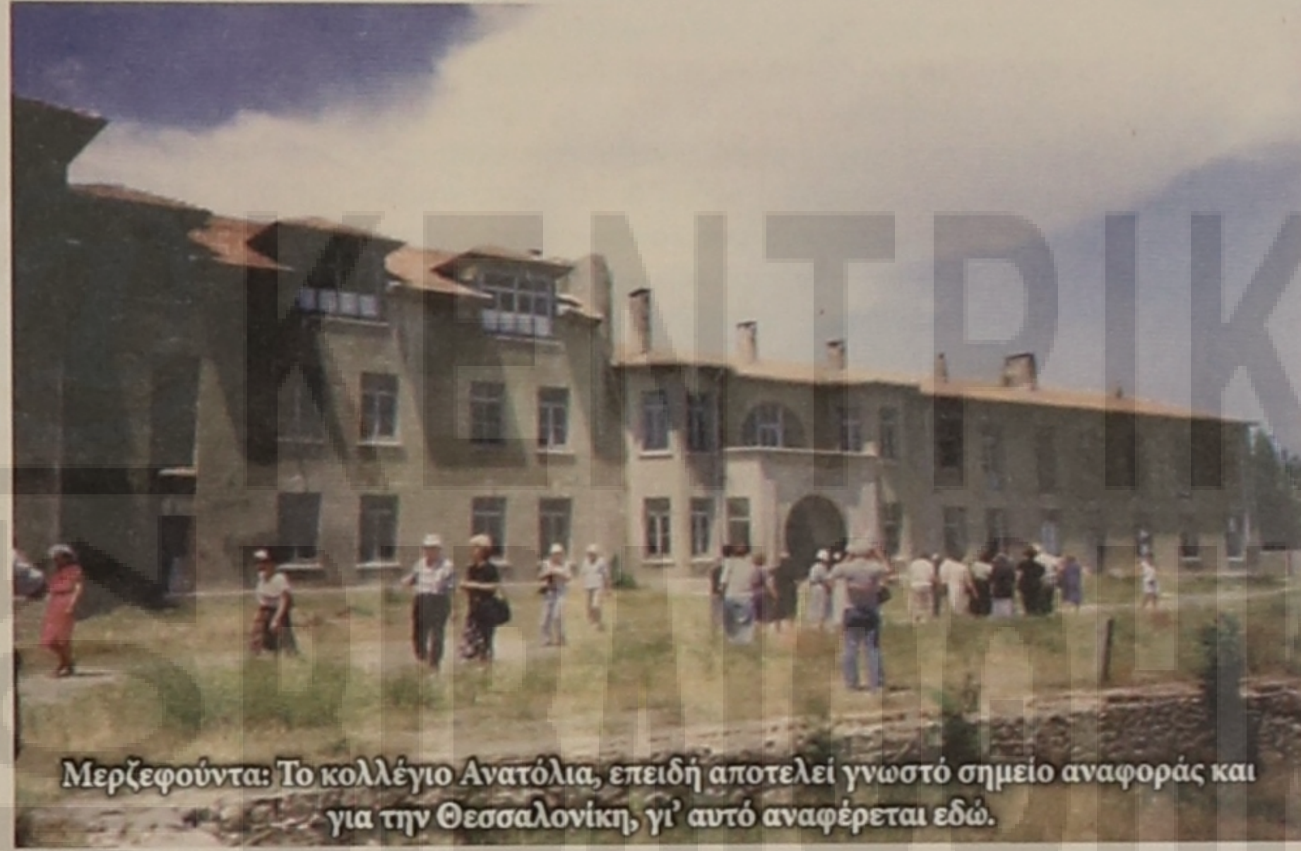
Μερζεφούντα: Το κολλέγιο Ανατόλια, επειδή αποτελεί γνωστό σημείο αναφοράς και για την Θεσσαλονίκη, γι' αυτό αναφέρεται εδώ.