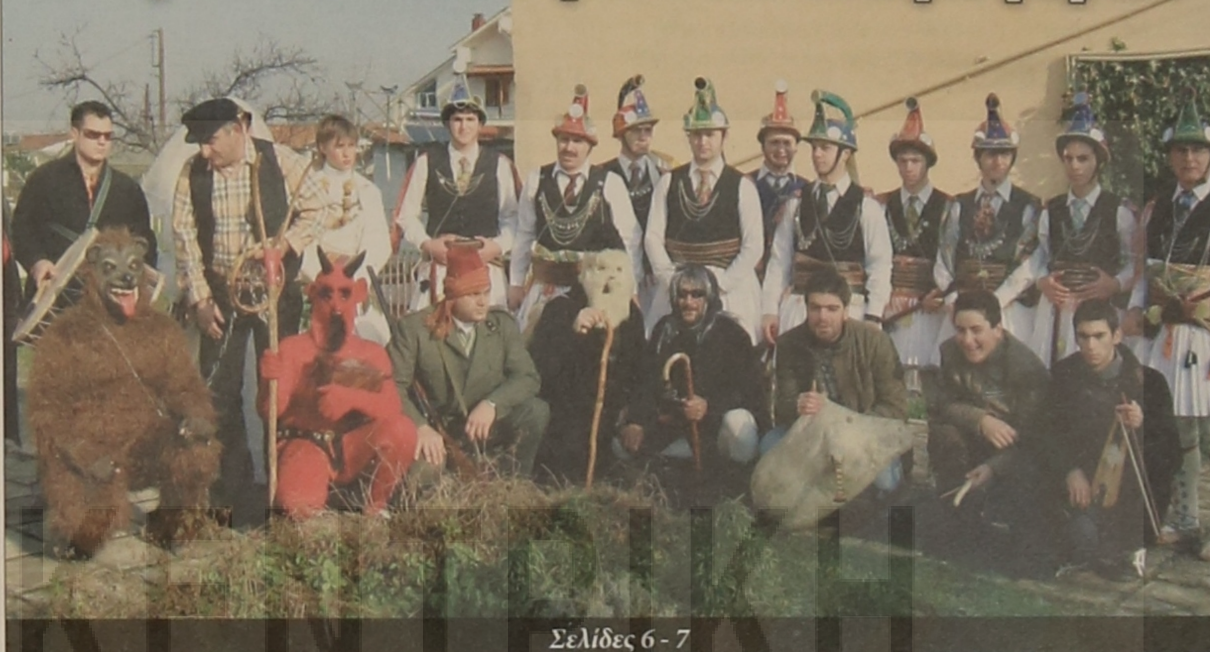
Σελίδες 6 - 7

Νέο Διοικητικό Συμβούλιο στην Παμποντιακή Ομοσπονδία Ελλάδος