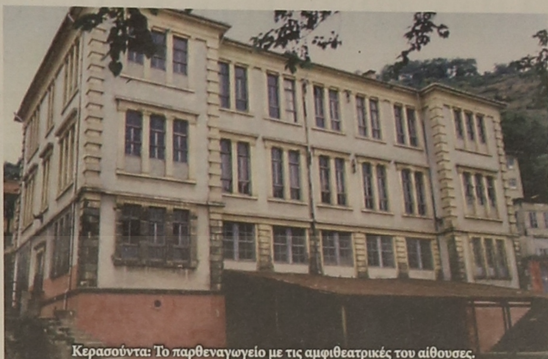
Κερασούντα: Το παρθεναγωγείο με τις αμφιθεατρικές του αίθουσες.

1. Στην αρχή της περιόδου η εκπαίδευση εμφανίζεται με λίγα σχολεία στα αστικά κέντρα, καθώς και στα μοναστήρια. Οι δάσκαλοι, παπάδες και καλόγεροι δίδασκαν μέσα στις εκκλησίες και στα σπίτια τους. Οι