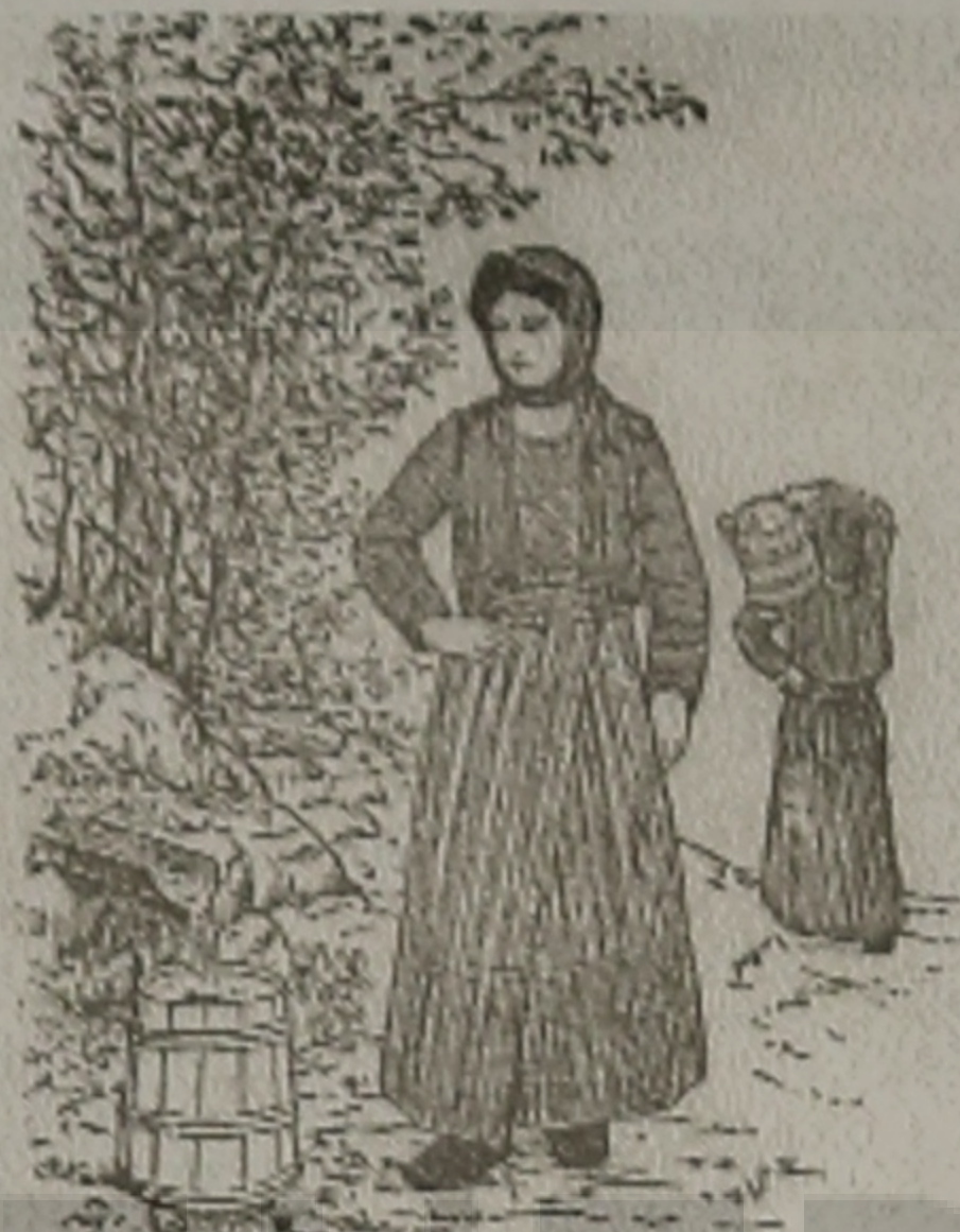
Η ΜΑΤΣΟΥΚΑΤΣΑ 'Σ ΟΣ ΚΙΣΝΙΝ

- Εγώ Ρούσος Δεσποτ'ς θα ίνουμε, είπεν ο Ηλίτσον.