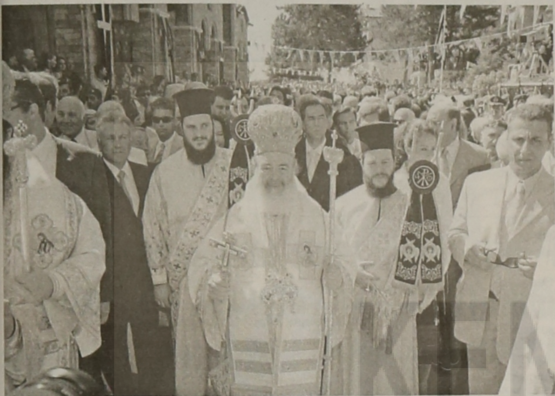
συνέχεια από την 1η σελ.

✓ Θεμελιώθηκε το "Μελισσανίδειο Μέλαθρο"