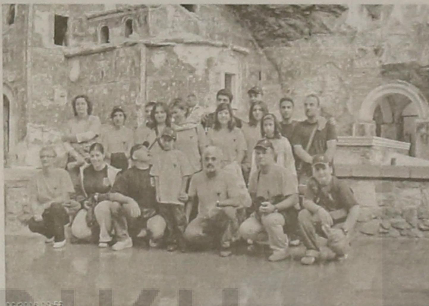
Το χορευτικό, μπροστά στην είσοδο της Ιεράς Μονής Παναγίας Σουμελά

Στη διαδρομή μας συναντήσαμε την πόλη Μπάφρα. Στην επικοινωνία μας με τους κατοίκους της, διαπιστώσαμε πόσο ζεστοί και