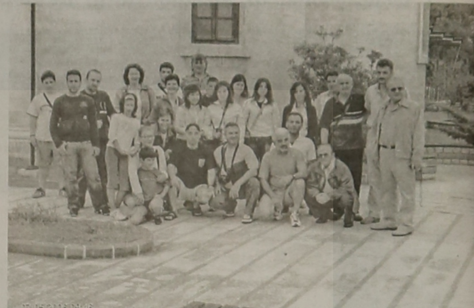
Αναμνηστική, στον πάλαι ποτέ Ιερό Ναό Υπαπαντής του Κυρίου στα Κοτύωρα, σήμερα Πολιτιστικό Κέντρο

Κυριακή 9/7. Αναχωρούμε από την Αμάσεια με την πανοραμική θέα που μας χάριζε το ξενοδοχείο, που βρισκόταν ακριβώς απέναντι από την πόλη σε ύψωμα. Την πόλη τη διασχίζει ο Ίρις ποταμός (πράσινο ποταμός). Εδώ επισκεφθήκαμε τους λαξευτούς μέσα σε βράχο τάφους των Μιθριδατών. Η ανάβα-