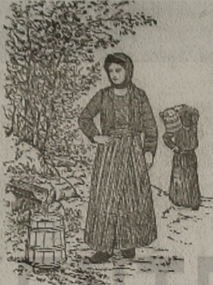
Η ΜΑΤΣΟΥΚΑΤΣΑ 'Ο ΣΟ ΚΡΕΝΗΝ

-Να ζής, Τραντάφυλλε. Εμείς ούλ' με τ' εσέν είμες!