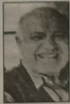
Γράφει ο Ανδρέας Ελ. Τσατσίριδης Ζάκυνθος

Θεωρείται (όπως και είναι άλλωστε) υψίστη τιμή για ένα πνευματικό άνθρωπο οιασδήποτε επιδόσεως (δηλ. συγγραφέα, επιστήμονα, καλλιτέχνη κ.λ.π.) το να βραβευθεί από την Ακαδημία Αθηνών, που είναι, όντως, το κορυφαίο πνευματικό ίδρυμα της χώρας μας.