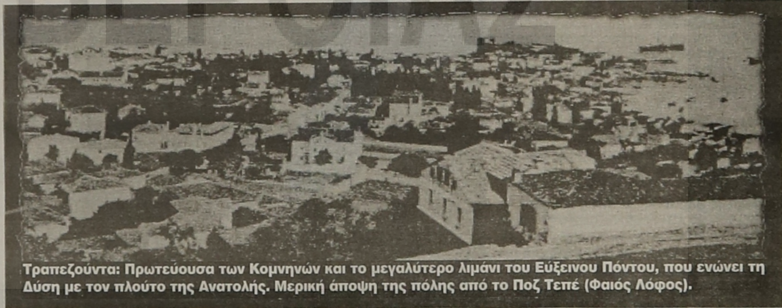
Τραπεζούντα: Πρωτεύουσα των Κομνηνών και το μεγαλύτερο λιμάνι του Εύξεινου Πόντου, που ενώνει τη Δύση με τον πλούτο της Ανατολής. Μερική άποψη της πόλης από το Ποζ Τεπέ (Φαίος Λόφος).