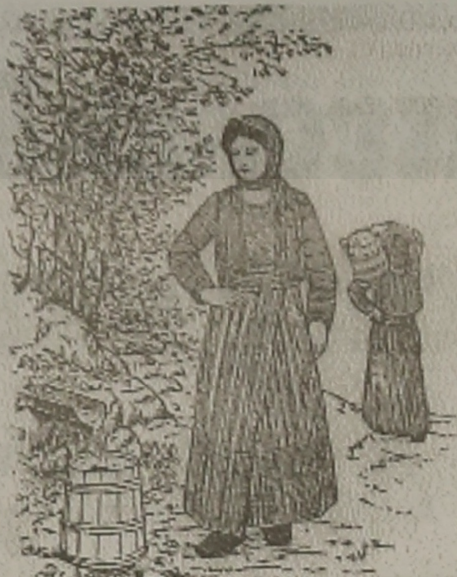
Η ΜΑΤΣΟΥΚΑΤΣΑ 'Ο Ο ΚΡΕΝΙΝ

- Θείο Νικόλα, τα 5 λίρας ντ' εδώκες με 'κ' εκανέ-θαν, δος με κι άλλα 5 και σε δέκα ημέρας θα φέρω σε και τα 10.