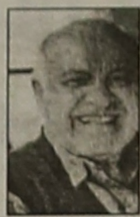
Γράφει ο Ανδρέας ΕΛ. Ταταρίδης Ζάκυνθος

Δεν ξέρω αν η γνωστή δημοσιογράφος των Αθηνών Σεμίνα Διγενή είναι ποντιακής καταγωγής ή έχει σχέση με τον Πόντο! Εκείνο που ξέρω είναι ότι η εν λόγω Δημοσιογράφος δια της γνωστής τηλεοπτικής εκπομπής της "ΚΟΙΤΑ ΤΙ ΕΚΑΝΕΣ" από το κανάλι "ΑΛΦΑ" τελευταία, δύο φορές ασχολήθηκε με δύο πολύ πολύ γνωστούς και κοσμαγάπητους καλλιτέχνες τον κινηματογραφικό ηθοποιό και τραγουδιστή Νίκο Ξανθόπουλο και τον τραγουδιστή λαϊκών τραγουδιών Στέλιο Καζαντζίδη.