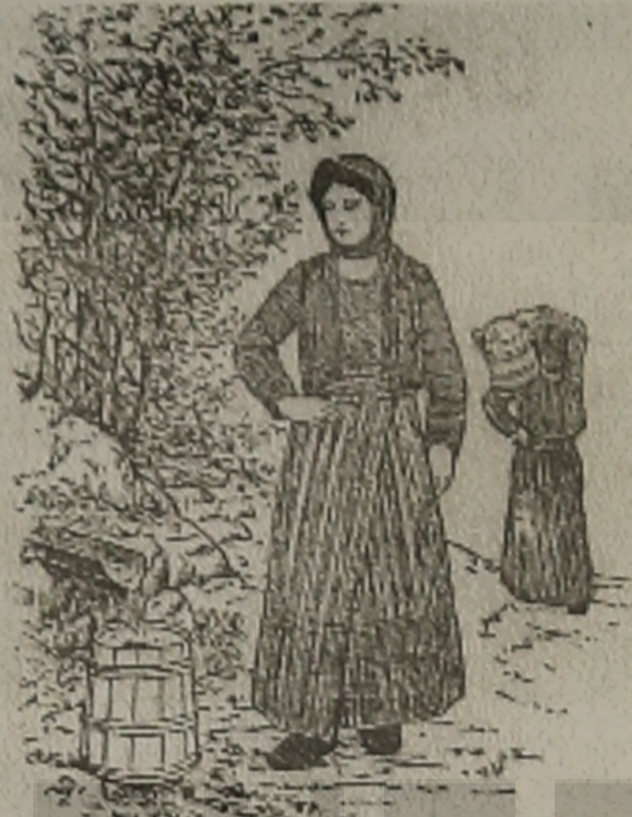
Η ΜΑΤΣΟΥΚΑΤΣΑ 'Ο ΣΟ ΚΙΣΙΝΙΝ

Ο Τούρκον εχαμογέλασεν, εντώκεν ατέν απάν σ' ωμίν, εδέκεν ατέν το πασιπόρτ και είπεν ατέν: Αφερουμ, καλά εποίκες μας.