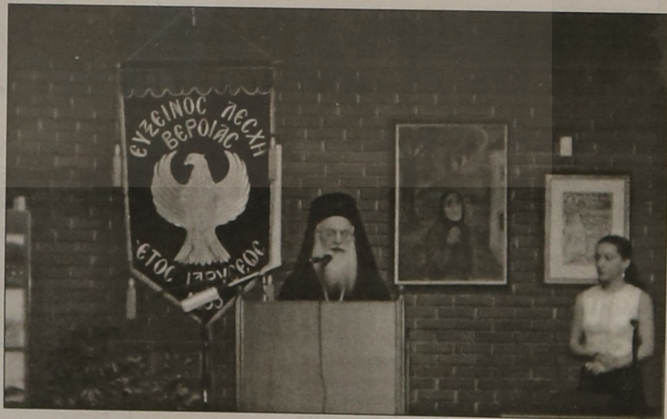
Ο Σεβασμιώτατος Μητροπολίτης Βεροίας κ. Παντελεήμων, ενώ απευθύνει χαιρετισμό.

Χαιρετίζοντας τη σημερινή ημερίδα σας συγχαίρω για το σπουδαίο έργο που επιτελείτε και εύχομαι να το συνεχίσετε και στα επόμενα χρόνια μεταδίδοντας έτσι τις παραδόσεις, τα ήθη, τα έθιμα, τις λαχτάρες αλλά και την υπερηφάνεια των πατέρων και των προγόνων σας στη νεώτερη γενιά, αποδεικνύοντας πόσο αληθινά είναι τα λόγια του ποιητή πως η Ρωμανία δεν πέθανε, ζει