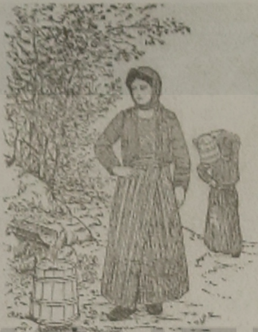
Η ΜΑΤΣΟΥΚΑΤΣΑ 'Σ ΣΟ ΚΡΕΝΙΝ

- Θεία Παρέσσα, λέει ατεν ο Νάνον. Ατόσον αν εστεναχωρεύτες, χά τ' ουράδα ακεκά είν'... Έπαρ' τέκαψον ατα οπίσ' ατου.