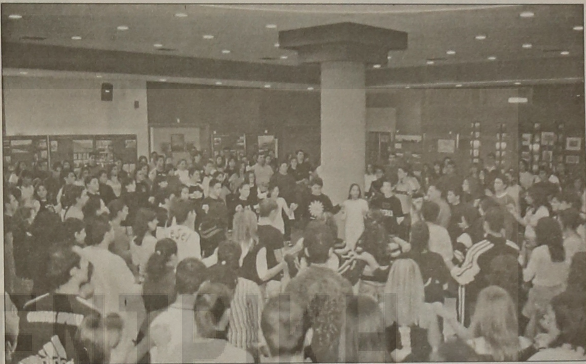
Τέλος, έντονο αναμένεται να είναι και το στίγμα της Ε.Λ.Β. στην εκδήλωση του Σαββάτου στο "Παλαί", όπου θα συμμετέχει με 55μελή αποστολή ενηλίκων χορευτών.

Έτσι, για ακόμη μία φορά η Ευξείνου Λέσχη Βέροιας έγινε ο πόλος έλξης και συγκέντρωσης χορευτών και παραγόντων Συλλόγων από όλη τη Μακεδονία και Θεσσαλία και στάθηκε αφορμή να σταθεί το βλέμμα των επισκεπτών της και στην πόλη μας, οι οποίοι έμειναν με τις καλύτερες εντυπώσεις τόσο από την οργάνωση της συγκεκριμένης πρόβας, όσο και από τη φιλοξενία των μελών της Ευξείνου Λέσχης, αλλά και τη γενικότερη δραστηριότητα του Συλλόγου, καθώς είχαν την ευκαιρία να επισκεφτούν από κοντά, στο χώρο της Ευξείνου Λέσχης, την μοναδική στο είδος της πολυθεματική έκθεση του Βεροιώτη καθηγητή Παν/μίου Δυτικής Μακεδονίας κ. Κώστα Φωτιάδη με θέμα τη Γενοκτονία των Ποντίων.