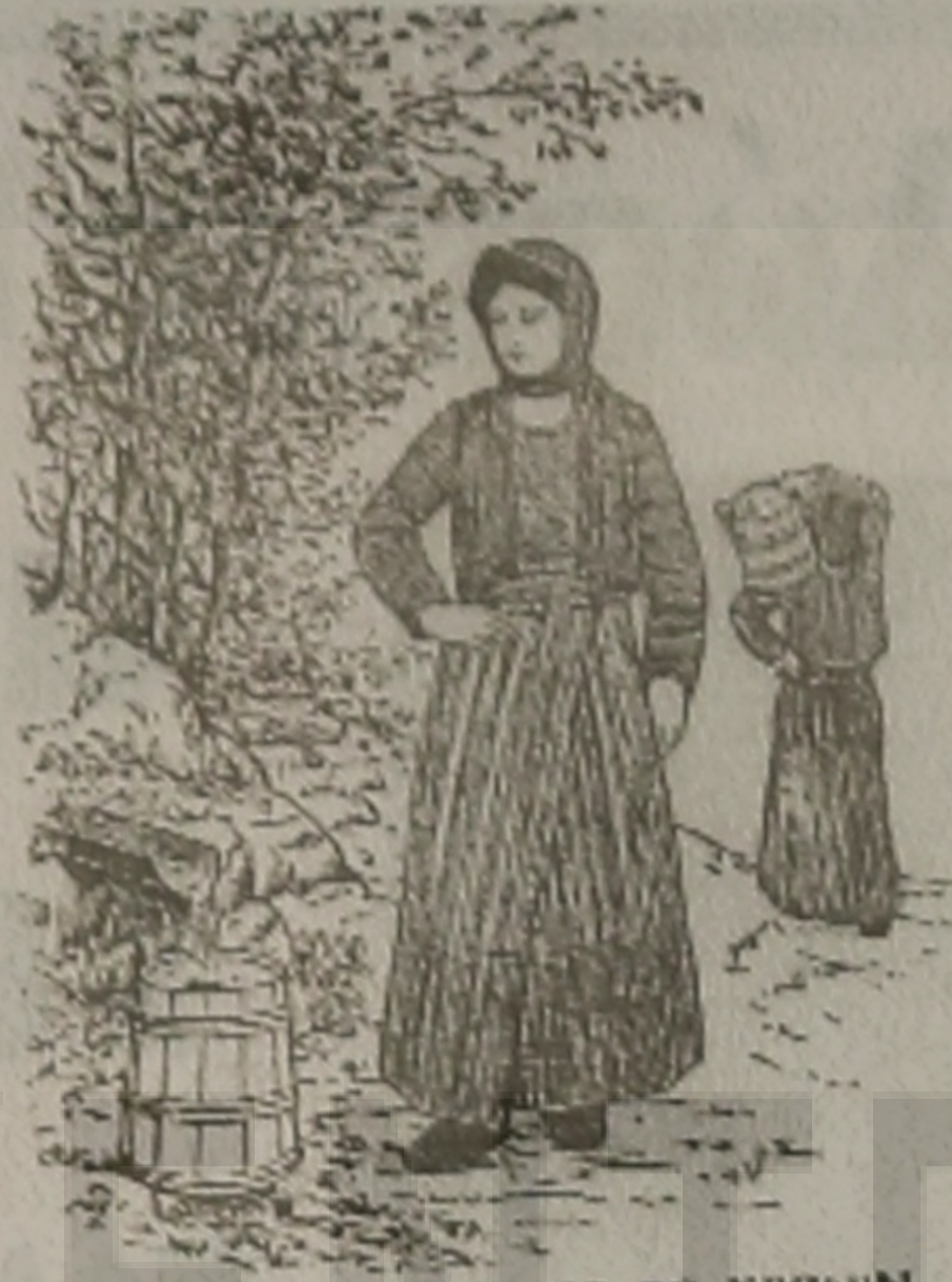
Η ΜΑΤΣΟΥΚΑΤΣΑ 'Σ Ο Ο ΚΡΕΝΙΝ

Ο Τιαριάς ο Στοφόρον ας σοι Πινιατάντων εγέραςεν στην Ξεντεϊάν, στην Ρουσιάν, άμα άμον ντο έτον τσιολπάης σα χέρια 'τα, αέτς πα έτον τσιολπάης και σο μάθεμαν. Δύο ρουσιικά 'κ