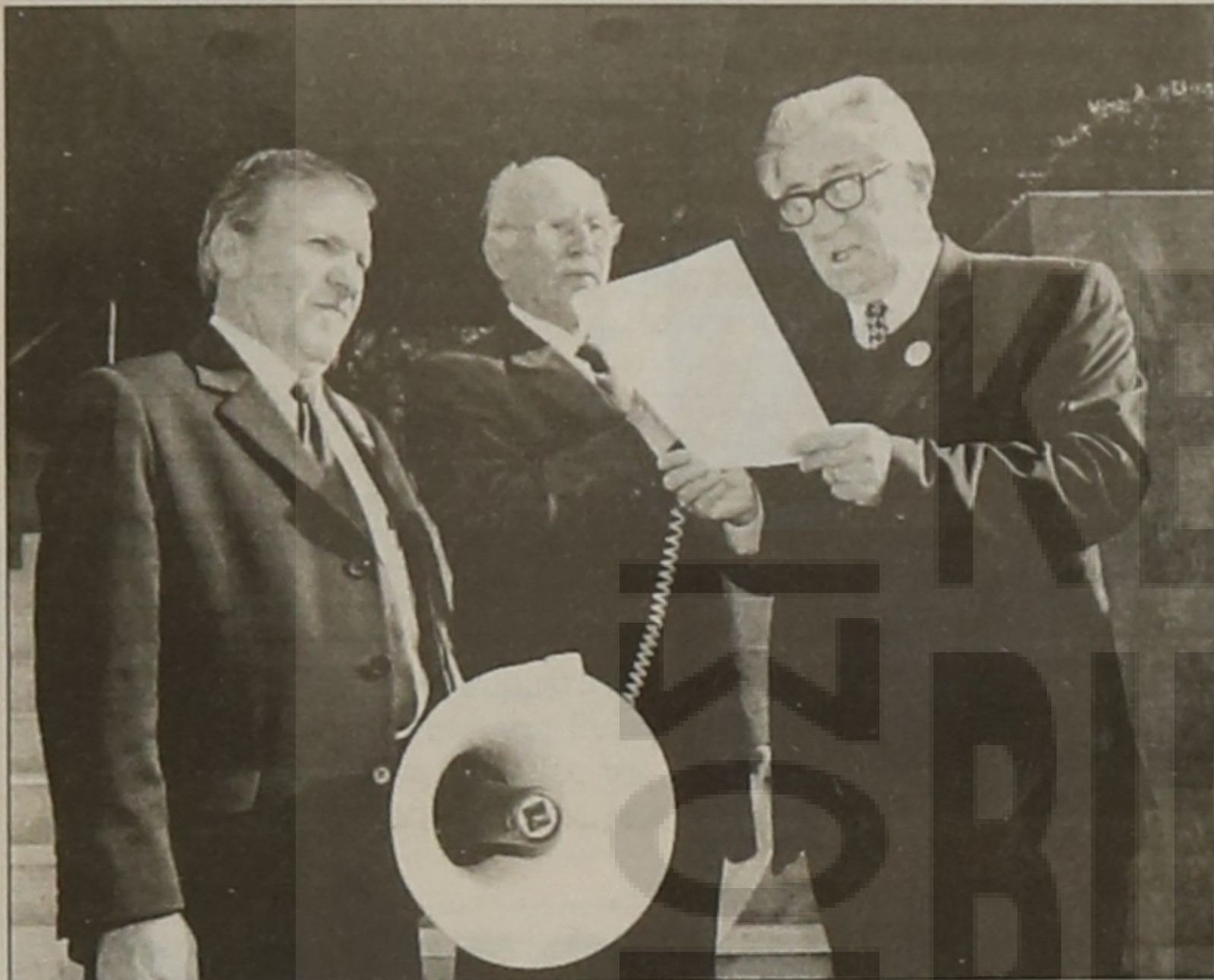
Κατά την ανάγνωση του ψηφίσματος διαμαρτυρίας, στην είσοδο του Τουρκικού προξενείου Μελβούρνης

Κεντρική ομιλία έγινε την Κυριακή 22 Μαΐου 2005, 7 μ.μ. στην αίθουσα της Ποντιακής Κοινότητας Μελβούρνης και Βικτώριας με θέμα: "Το χρονικό της Γενοκτονίας του Ποντι-