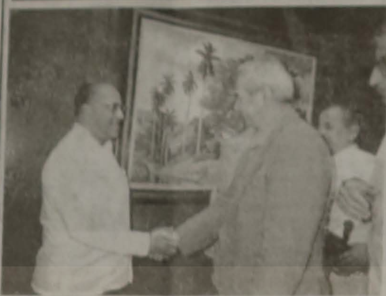
Ο Βουλευτής Ημαθίας Κος Μόσχος Γικονόγλου με τον Υπουργό Εξωτερικών της Κούβας.

Εντυπωσιασμένος επέστρεψε από το πρόσφατο ταξίδι του στην Κούβα ο Βουλευτής Ημαθίας Κος Μόσχος Γικονόγλου, όπου μετείχε Διακομματικής Επιτροπής, με την ιδιότητα του Προέδρου της Κοινοβουλευτικής Επιτροπής Εθν. Αμυνας.