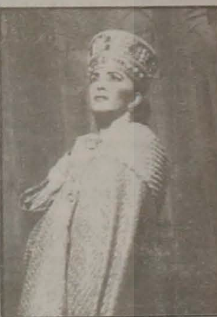
τητα η Κα Ντενίση! Η παράσταση θα δοθεί την Δευτέρα 21 Ιουλίου, στις 9.30μ.μ., στο Θέατρο Άλσους "Μελίνα Μερκούρη".

Την πόλη μας επισκέπτεται την ερχόμενη Δευτέρα 21 Ιουλίου ο Θίασος της ΜΙΜΗΣ ΝΤΕΝΙΣΗ με το έργο "ΘΕΟΔΩΡΑ - Η ΑΠΑ ΤΩΝ ΦΤΩΧΩΝ"! Πρόκειται για ένα σημαντικό καλλιτεχνικό γεγονός όπου το θεατρόφιλο κοινό της Βερροίας θα έχει την ευκαιρία να θαυμάσει την Μεγάλη Ελληνίδα Πρωταγωνίστρια, και τους Συνεργάτες της σε μια μεγαλειώδη παράσταση. Η Κα Ντενίση περιστοιχιζόμενη απο Μεγάλα Ονόματα του Θεάτρου και Κινηματογράφου μας, αναδίδουν μια από τις σημαντικότερες περιόδους της Βυζαντινής Αυτοκρατορίας, με πρωταγωνίστρια την Αυτοκράτειρα Θεοδώρα, την οποία ενσαρκώνει με πιστικό-