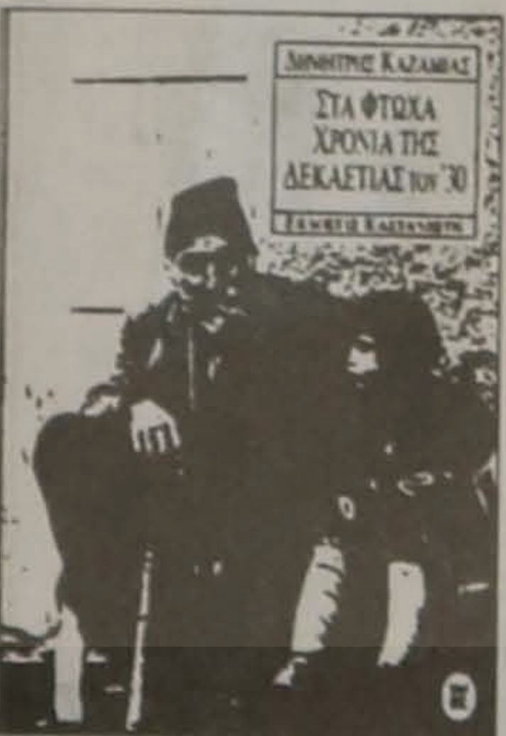
ΔΗΜΗΤΡΗΣ ΚΑΖΑΜΙΑΣ ΣΤΑ ΦΤΩΧΑ ΧΡΟΝΙΑ ΤΗΣ ΔΕΚΑΕΤΙΑΣ ΤΟΥ '30 ΚΕΝΤΡΟΣ ΕΚΔΟΣΕΩΝ

Η δεκαετία που ένωσε όλους τους Νεοέλληνες, ντόπιους και πρόσφυγες, κόντρά τους να νιώσουν δυνατότεροι, κι απ' την κα-