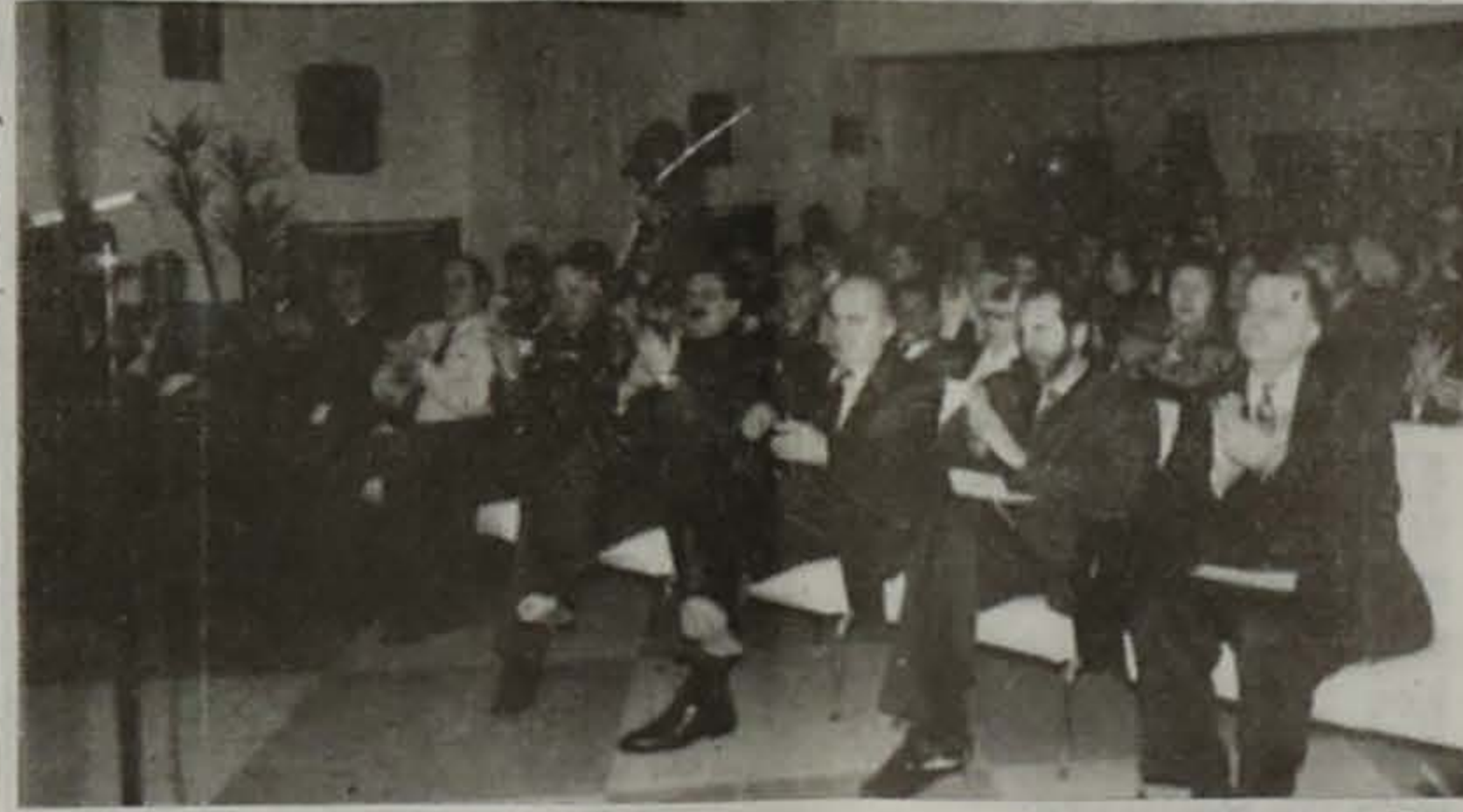
Στιγμιότυπο από την εκδήλωση κοπής της πίτας του 1ου Συστήματος Προσκόπων Βέρροιας την οποία παρακολούθησαν οι Τοπικές Αρχές και πλήθος κόσμου

Με πολύ μεγάλη επιτυχία πραγματοποιήθηκε η κοπή πίτας του 1ου Συστήματος Προσκόπων Βέρροιας, στην καταμεστή από γονείς και φίλους αίθουσα του Δικηγορικού Συλλόγου της πόλης μας, την Κυριακή 11 Φεβρουαρίου 1996.