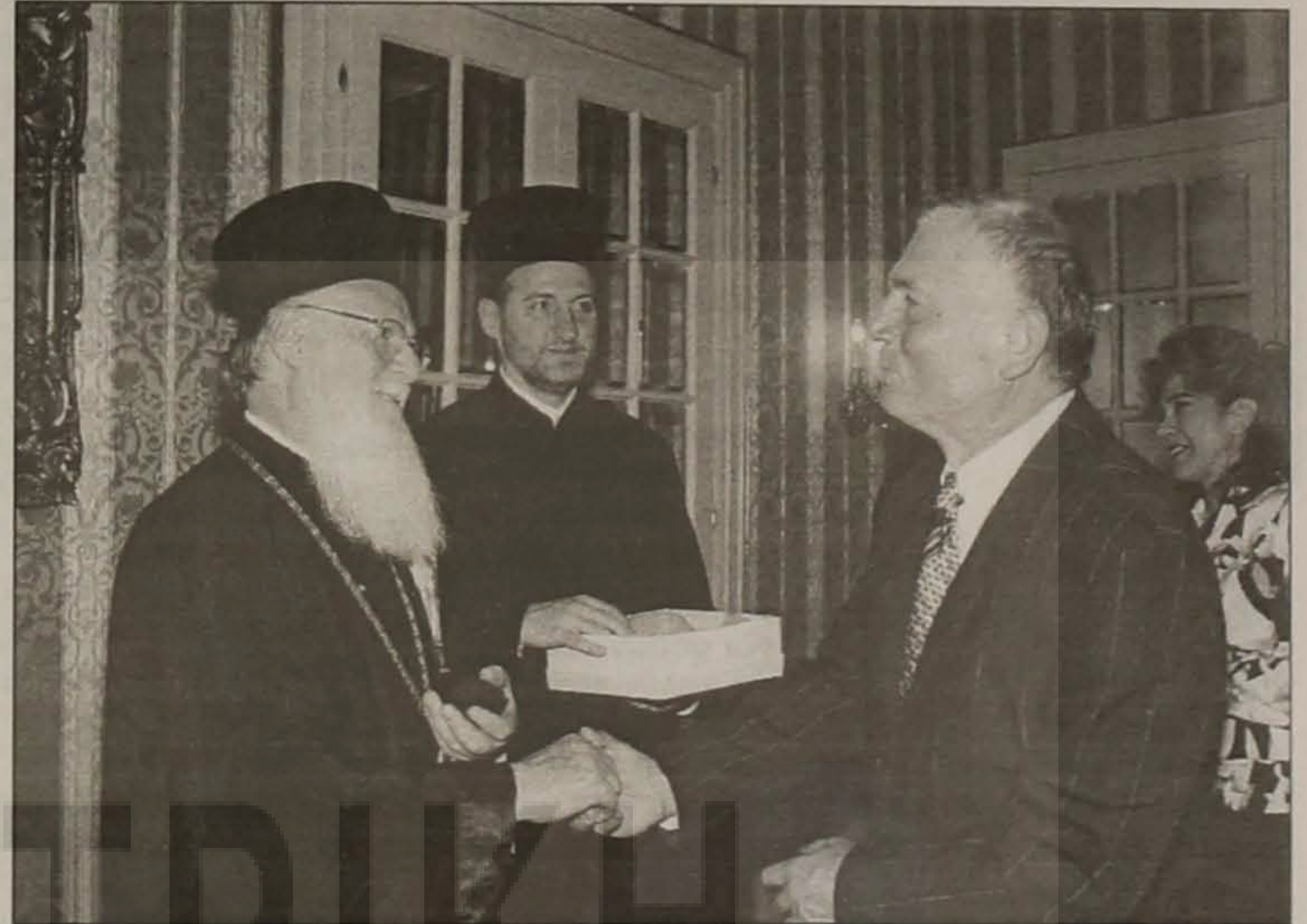
Στιγμιότυπο από τη συνάντηση του κ. Ερμίδα με τον Οικουμενικό Πατριάρχη κ.κ. Βαρθολομαίο.

Στις 13 Νοεμβρίου, σε κεντρική αίθουσα της αυστριακής πρωτεύουσας πραγματοποιήθηκε εκδήλωση του "ΞΕΝΙΤΕΑ", Συλλόγου Ποντίων και φίλων Ποντίων Βιέννης, όπου σύσσωμος η ελληνική παροικία έδωσε το μεγάλο "παρών".