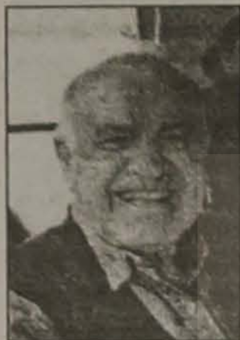
Γράφει ο Ανδρέας ΕΛ. Ταταρίδης

"Ο κακός χρόνος περνάει, ο κακός γείτονας όχι!" (ελληνική παροιμία)