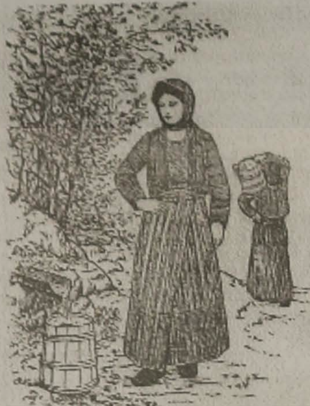
Η ΜΑΤΣΟΥΚΑΤΣΑ 'Σ Ο ΚΡΕΝΙΝ

Έναν ημέραν, η καλομάνα μ' είδεν έναν χωρέτεν τη Χάμπονος κ' ερώτεσεν ατον, ντο ευτάει ο Χάμπον. Γιατί κ' εφάνθεν άλλο αδακέσ'; Γιαμ' ερώτεσεν;