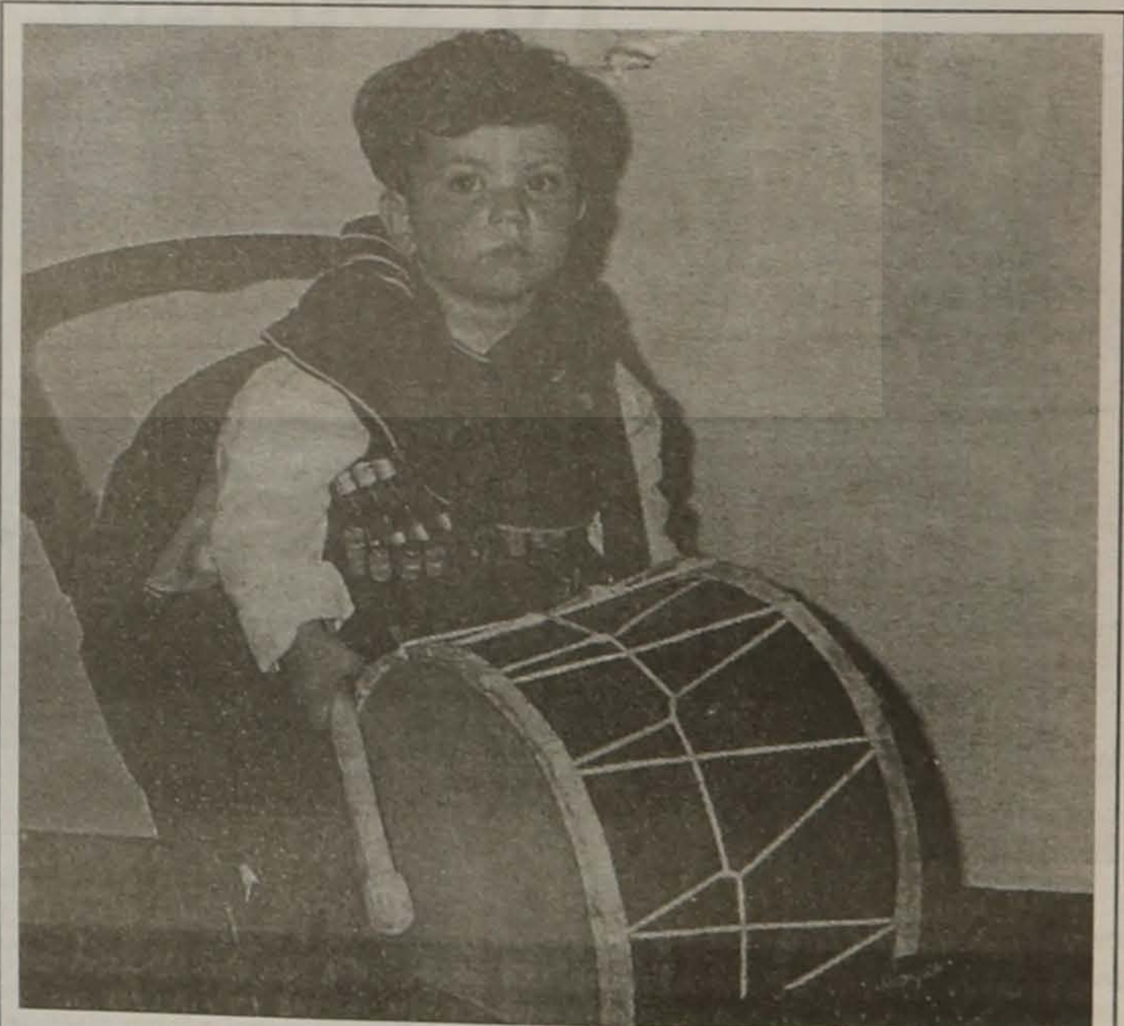
Η παράδοση συνεχίζεται

* Από το βιβλίο "Οι Ρίζες μας" του Γιάννη Μελετιδη