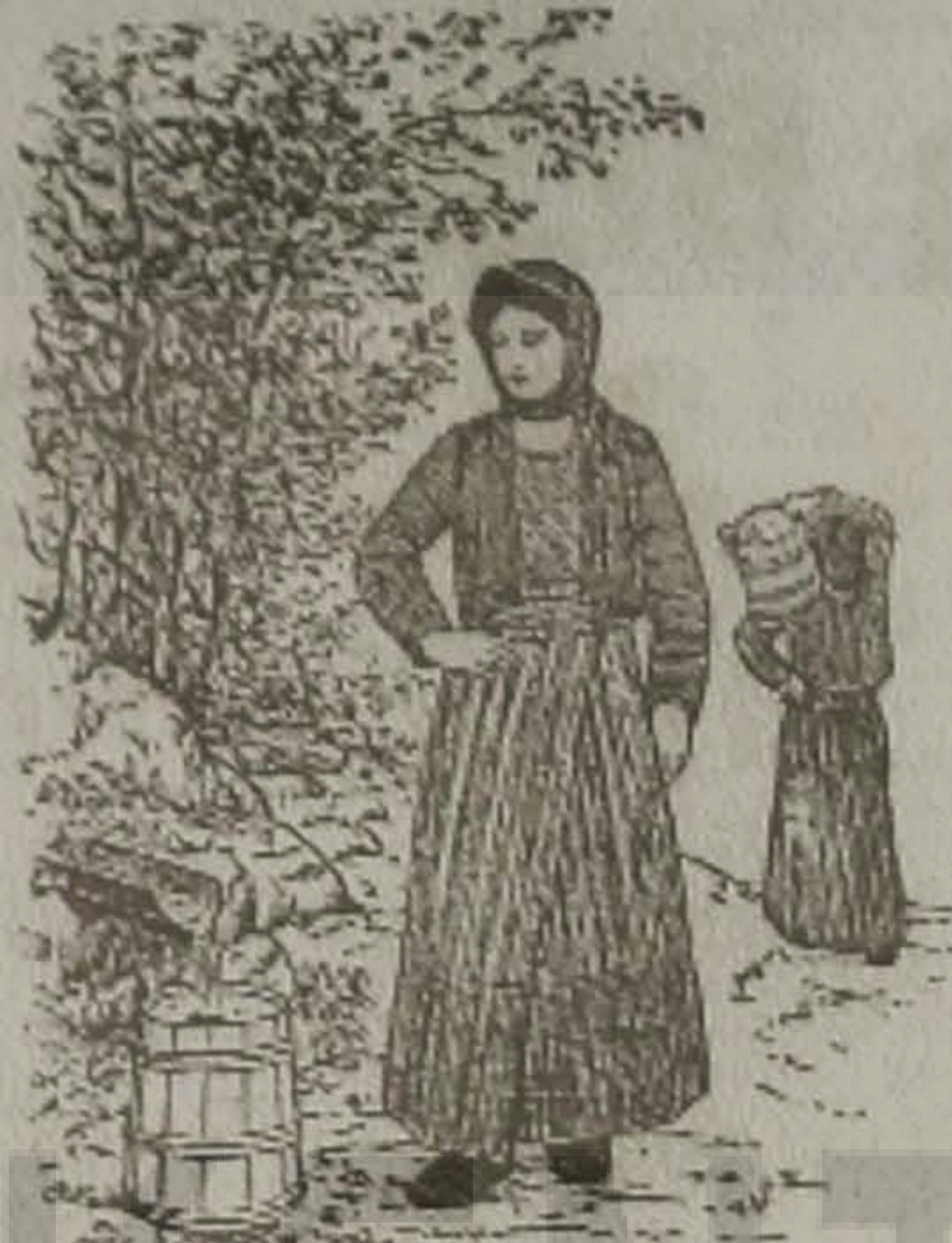
Η ΜΑΤΣΟΥΚΑΤΣΑ 'Σ ΟΣ ΚΙΣΙΝΙΝ

-Γιατί να φεύω, είπεν. Ζατί πουρνά θα εβγάλετε με. Αφίστε με, εγώ ς' σα δύο - τρία ώρας αδά είμαι.