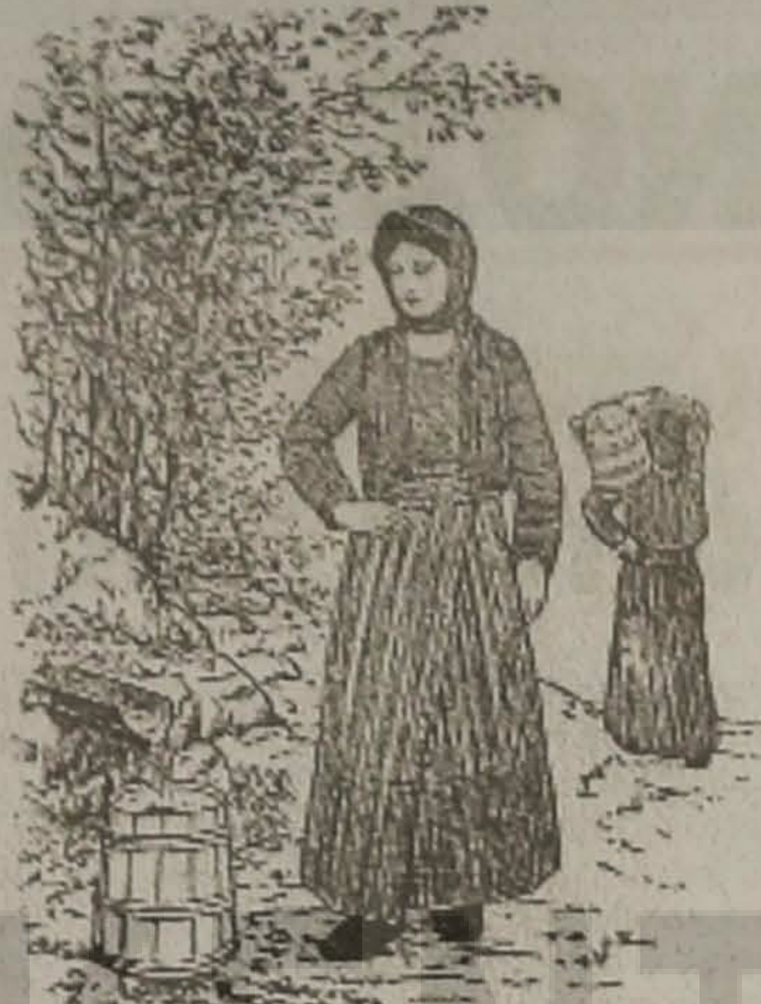
Η ΜΑΤΣΟΥΚΑΤΣΑ 'Ο Ο ΚΡΕΝΙΝ

- Θεία Ελένε, εντρέπουμαι να έρχουμαι ελάτεν επάρτε με.