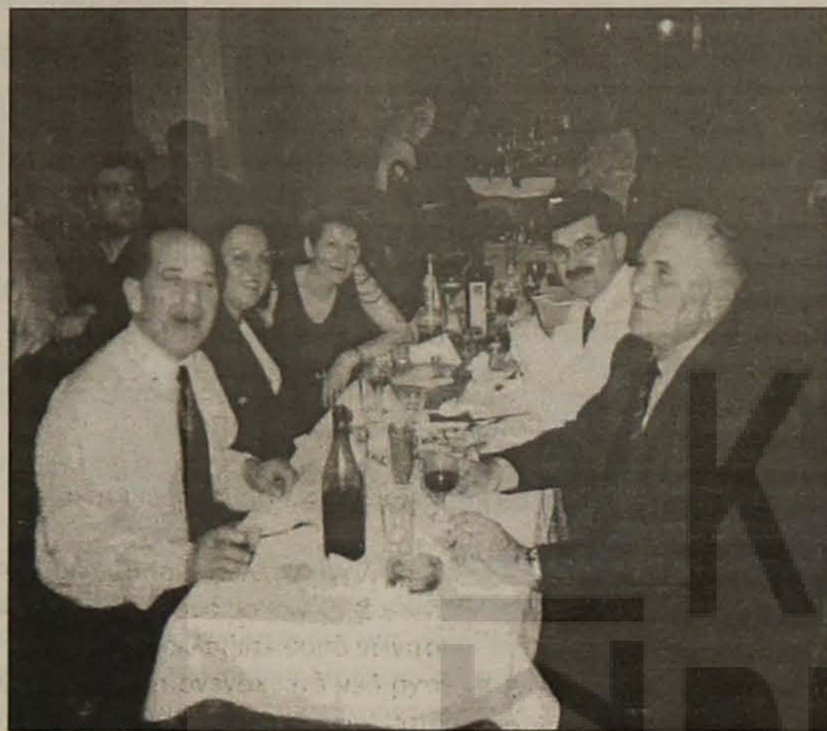
Οι πατρίδες οι ξεριζωμένοι "Έλληνες διέπρεψαν σε πολλούς τομείς της ανθρώπινης δραστηριότητας."

Εγγραψαν μια μοναδική ιστορία αιώνων και άφησαν έναν αξιολύπητο πολιτισμό. Η Πολιτεία δεν έδειξε, ως όφειλε, κάποιο ενδιαφέρον. Θα ήταν ένα από τα απίστευτα, σε παγκόσμια κλίμακα, να ξεχαστεί μια τέτοια ιστορία. Έτους προσφυγικούς συλλόγους της χώρας πέφτει το βάρος της προβολής και αξιοποίησης της με λογής-λογής εκδηλώσεις. Οι σωστά οργανωμένοι χοροί μας μπορούν να βοηθήσουν προς την κατεύθυνση αυτή.