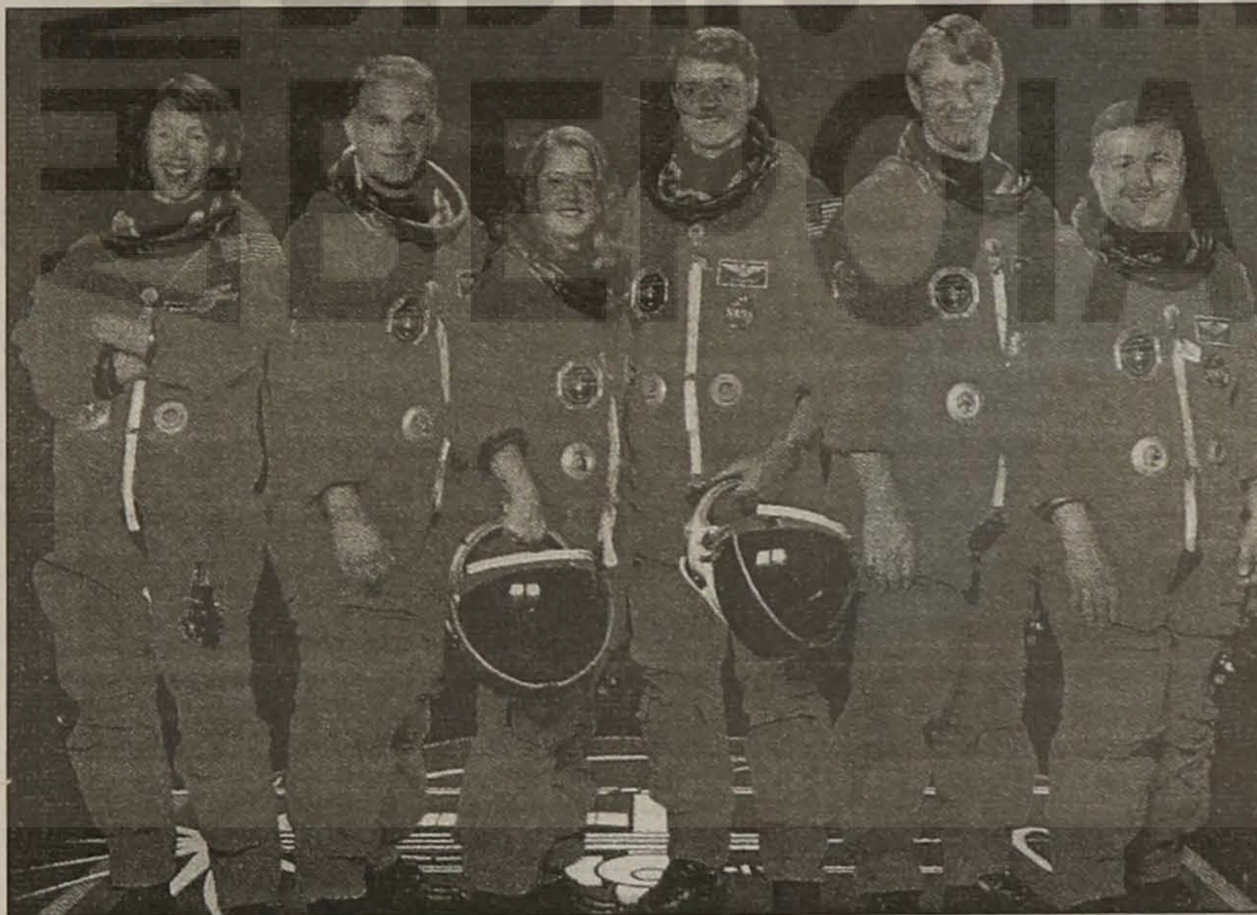
Η κοινή αμερικανορωσική αποστολή που πέταξε στο διάστημα με το διαστημικό λεωφορείο ΑΤΛΑΝΤΙΣ: Σ. Μάγκνους, Ντ. Βούλφ, Π. Μελρόι, Ντ. Εσμπι, Π. Σέλλερς και Θ. Γιουρτσίν Γραμματικόπουλος

Αισθανθήκατε να επικοινωνείτε καλύτερα με το Θεό στο διάστημα;