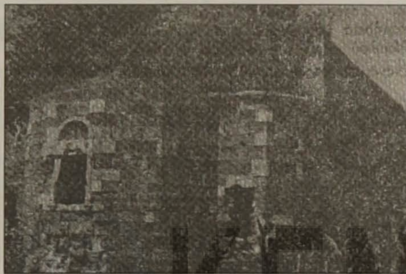
Ο εγκαταλειμμένος ναός της Παναγίας στο Ιασόνειο ακρωτήριο

Ανάμεσα στην Φάτσα και την Ορτού (Κοτύωρα) και σε απόσταση περίπου χιλίων μέτρων από τον δημόσιο δρόμο, βρίσκεται το Ιασόνειο ακρωτήριο (Γιασούν Μπουρνού). Κοντά δε εκεί υπάρχει μια έρημη εκκλησία της Παναγίας. Επειδή τώρα τελευταία έχει δημοσιευθεί και αναφέρεται ως εκκλησία του Αγίου Νικολάου, γι' αυτό παραθέτω τις παρακάτω συγκεκριμένες πληροφορίες από την διεθνή βιβλιογραφία πως ο ναός αυτός είναι αφιερωμένος στην μνήμη της Κοιμήσεως της Θεοτόκου.