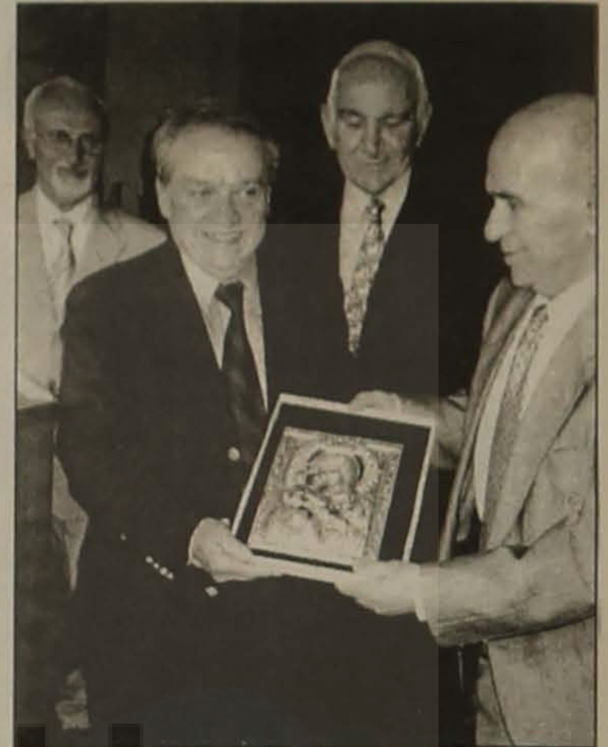
Ο Υπουργός Στέλιος Παπαθεμελής δίδει την εικόνα της Παναγίας, προσφορά του Προέδρου Γεωργίου Τσαλουχίδη στον στρατηγό Αλέξανδρο Καλεντερίδη με πολλές ευχές.

Ο μπουφές με τα πλούσια εδέσματα έδωσε την ευκαιρία στους προσκεκλημένους να σχολιάσουν, ευμενώς, τόσο το έργο των τιμωμένων προσωπικοτήτων, όσο και της εκδήλωσης ευρύτερα.