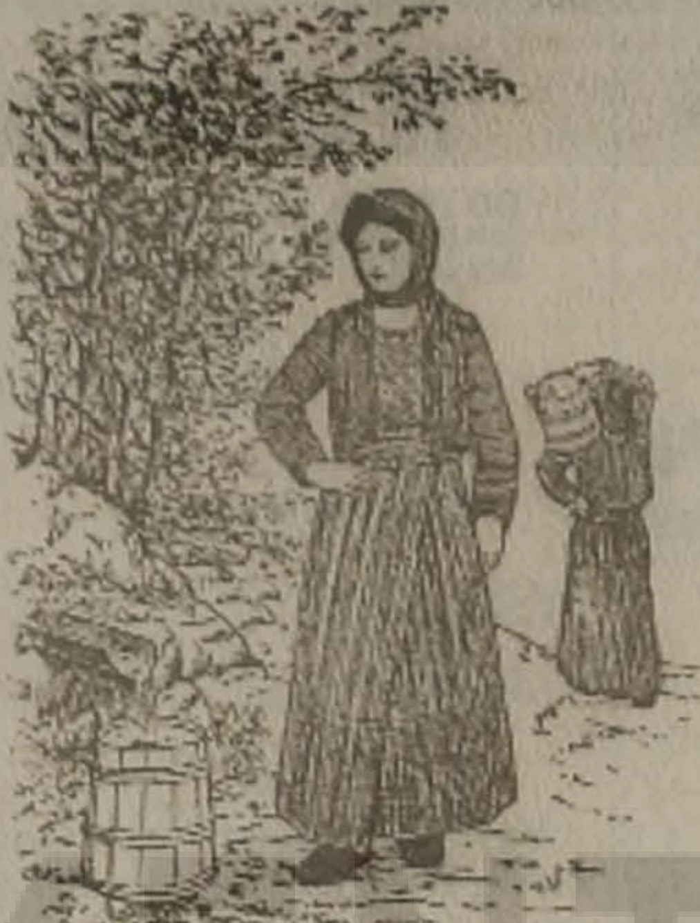
Η ΜΑΤΣΟΥΚΑΤΣΑ 'Σ ΣΟ ΚΡΕΝΙΝ

Δύο νομάτ' χωρέτ' γειτονάδες επήγαν να κόφτ' νε ξύλα. Προτού να εμπαινε σ' ορμάν, ελάλεσεν ο κού-