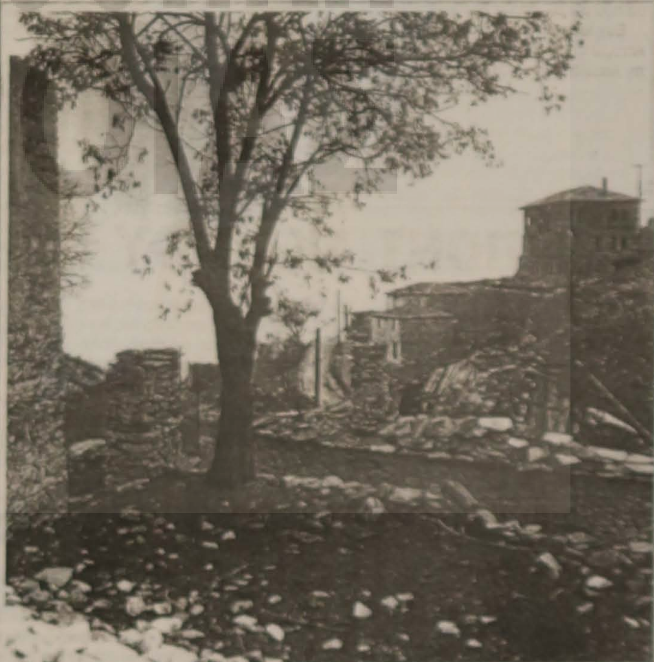
Εικόνας και λόγος

Ο κόσμος μας είναι κλειστός, όλα βριστά και έχουν σκοπό το χαμηλό σκοπό μέρα και νύχτα. Δεν έχουμε ποικιλία δεν έχουμε αγάπη δεν έχουμε πατρίδα, μονάχα λίγες στίβες, φθίσι κι αυτίς, που έχουν και που κι προσκολληται. Ήχος επικρατώντας στίβους, ήχος με τη μοναχιά μας ήχος με την αγότη μας, ήχος με τα σκατά μας. Μετ φαίνετε παρήσαν που κόντος μεταίσιμα να γίνισσιν τα αυτίς τα καλφίον και τη στίβας μας.