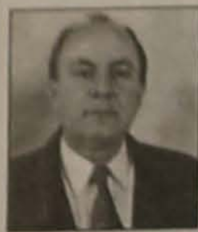
Γράφει ο Νίκος Ιωσφίδης Μαθηματικός - Φροντιστής

Πολλές φορές αναγκάστηκε να διαμαρτυρηθεί για το κατόντημα του Ποντιακού τραγουδιού και την καταστροφή αυτής της τεράστιας πολιτισμικής μας κληρονομιάς με την διεξόδυση νέων στοιχείων που αλλοιώνουν την ταυτότητα της και την ποιότητα της.