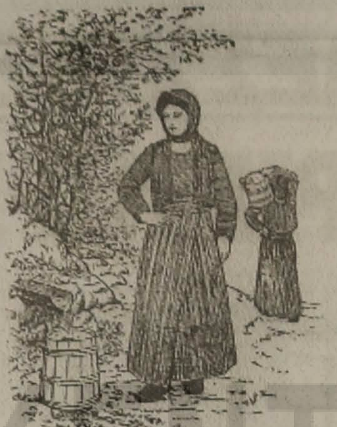
Η ΜΑΤΣΟΥΚΑΤΣΑ 'Σ Ο ΚΡΕΝΙΝ

Εντώκεν έναν κι' επήγεν εντώκεν τα' άλλο ενου-