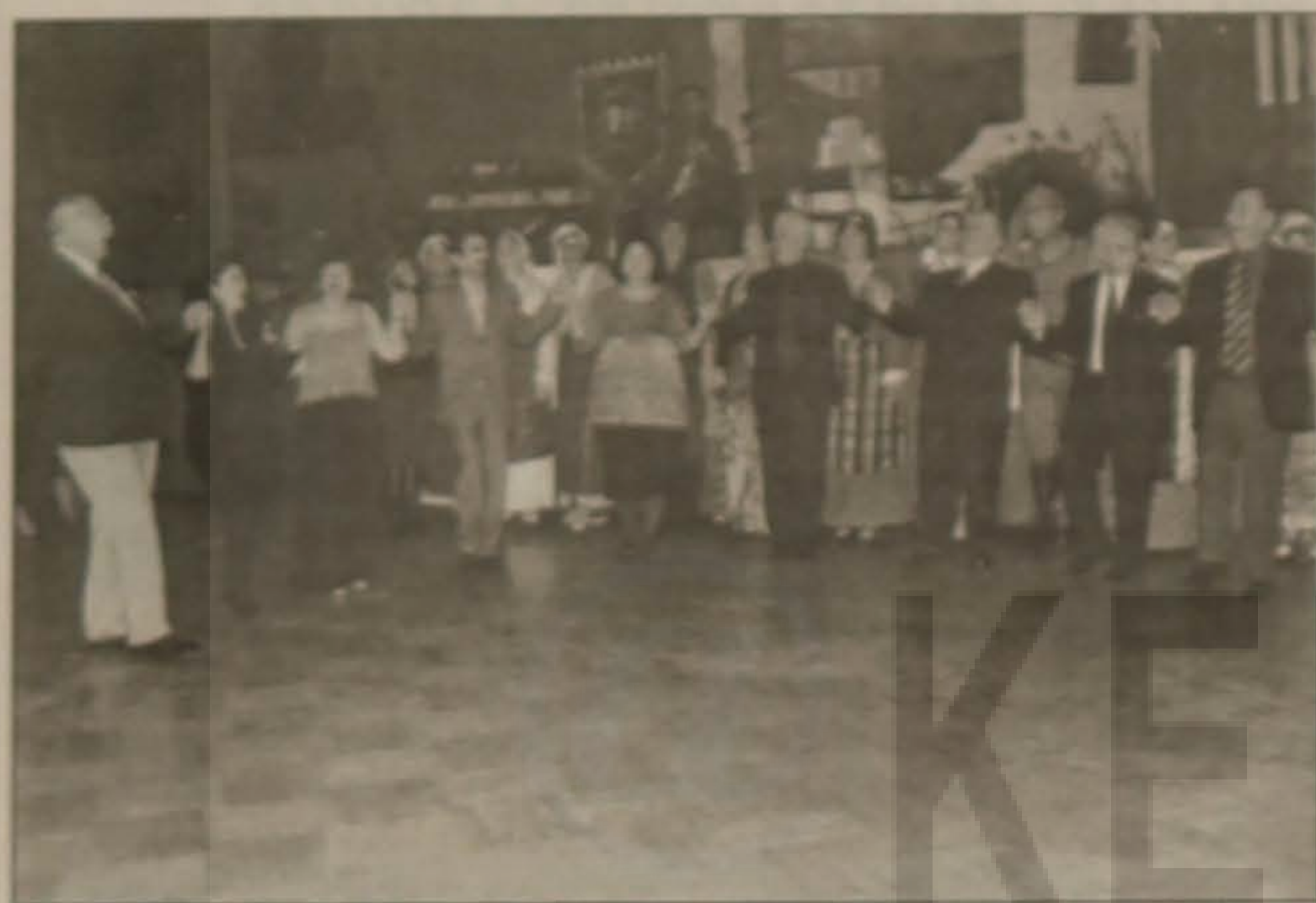
Χορός των Ποντίων Βιέννης Φεβρουάριος 2003 Το Συμβούλιο του ΞΕΝΙΤΕΑΣ τραγουδώντας και χορεύοντας την Λεμόνα