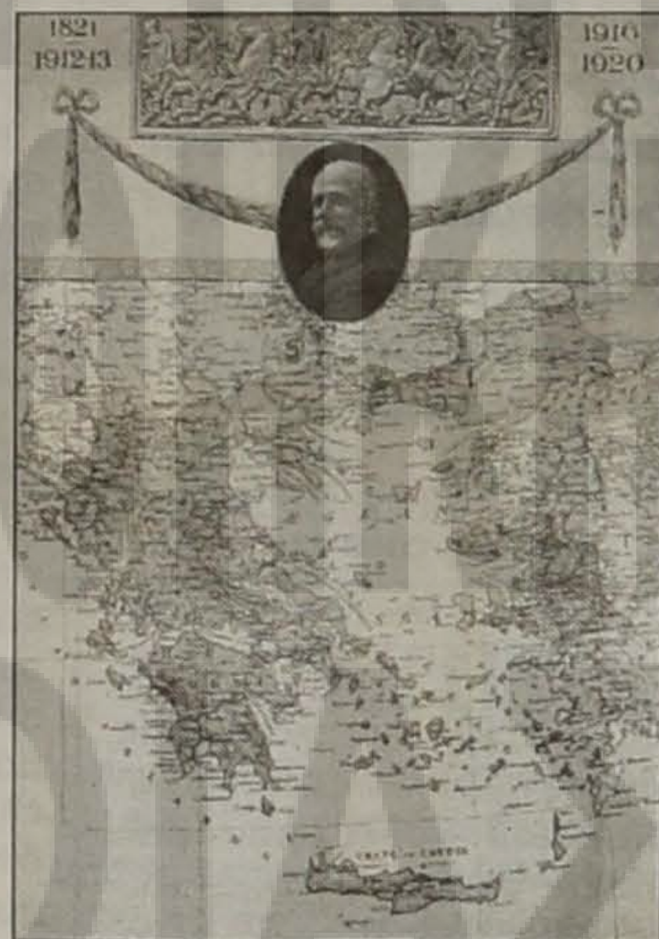
Λαϊκή αφίσσα του καλοκαιριού του 1920 που εικονίζει τα ελληνικά εδαφικά κέρδη μετά τις συνθήκες Νείγυ και Σεβρών. Σ' αυτήν εικονίζεται ως εδαφικό κέρδος της Ελλάδος και η βόρεια Ηπειρος, εφόσον η παραχώρησή της στην Ελλάδα συμπεριλαμβανόταν στους όρους της συμφωνίας Βενιζέλου - Τπτά-νι, η οποία όμως τελικά καταγγέλθηκε από τους Ι-ταλούς (Αθήνα, Γεννάδειος Βιβλιοθήκη)

σχετικά ο σεπτός Ιεράρχης Χρυσάνθος: "Τα ιερά ταύτα κειμήλια οι μοναχοί κατά την εκ της μονής αναχώρησιν έχουν θάψει κρυφίως εντός του μετοχίου της Αγίας Βαρβάρας". Μετά την εγκατάστασή τους στην Ελλάδα ένας από τους τελευταίους μοναχούς, ο Ιερεμίας Σουμελιώτης, με επιστολή του προς τον Μητροπολίτη Τραπεζούντος και αποκριστάριο τότε, του Πατριαρχείου, Χρυσάνθο, περιέγραψε τον τόπο της κρυψώνας. Όταν αργότερα, το 1930, οι σχέσεις της Ελλάδος με την Τουρκία περνούσαν περίοδο φιλίας, με εντολή του πρωθυπουργού της Τουρκίας, Ισμέτ Ινονού, ένας άλλος ιερομόναχος, ο Αμβρόσιος Σουμελιώτης, θα τα φέρει στην Ελλάδα.