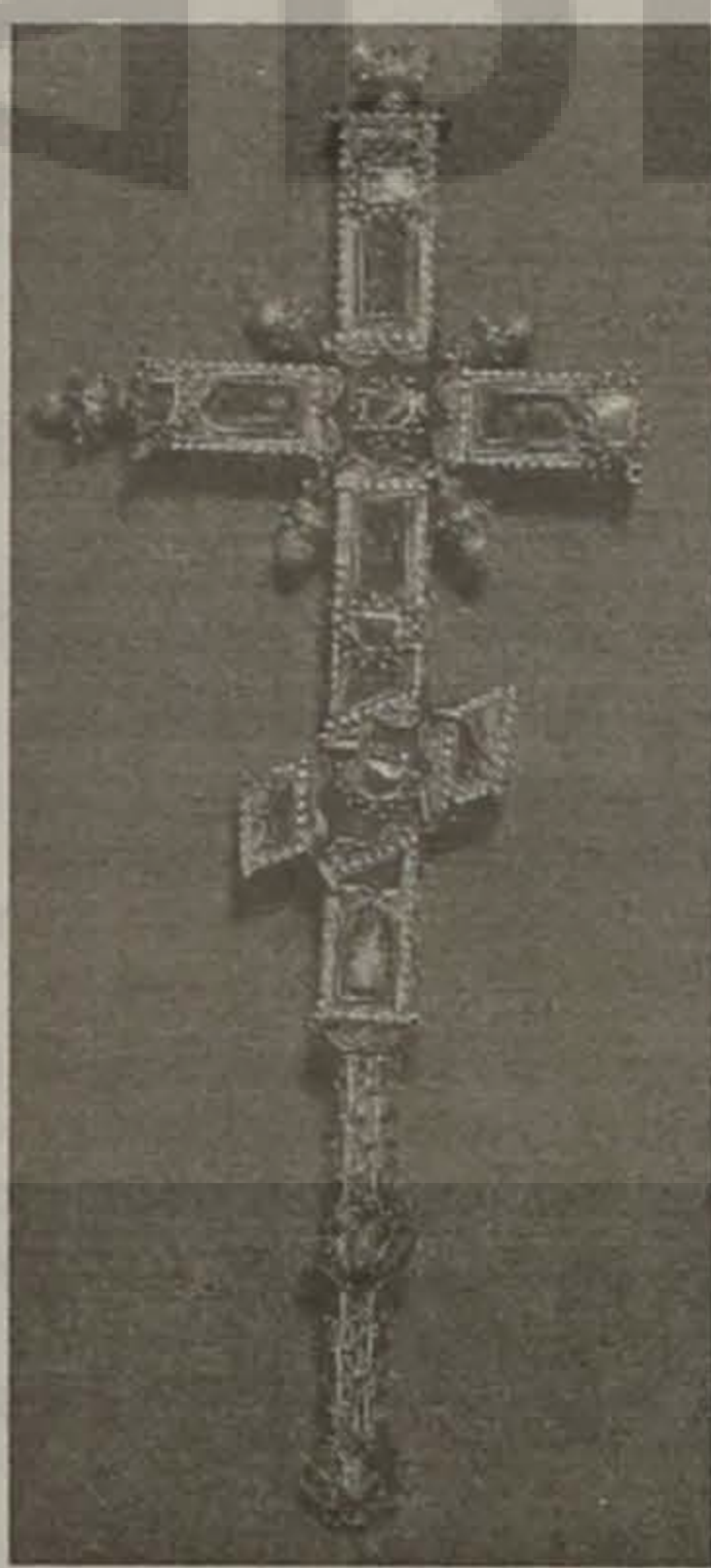
Βαρύτιμος Σταυρός περιέχων μέγιστον τμήμα Τιμίου Ξύλου. Κτήμα του Αυτοκρατορικού θησαυροφυλακίου Τραπεζούντας. Αφιερώθη εις την Ιεράν Μονήν Παναγίας Σουμελά υπό του Αυτοκράτορος Τραπεζούντας Μανουήλ Γ του Μεγάλου Κομνηνού (1390 μ.Χ.)