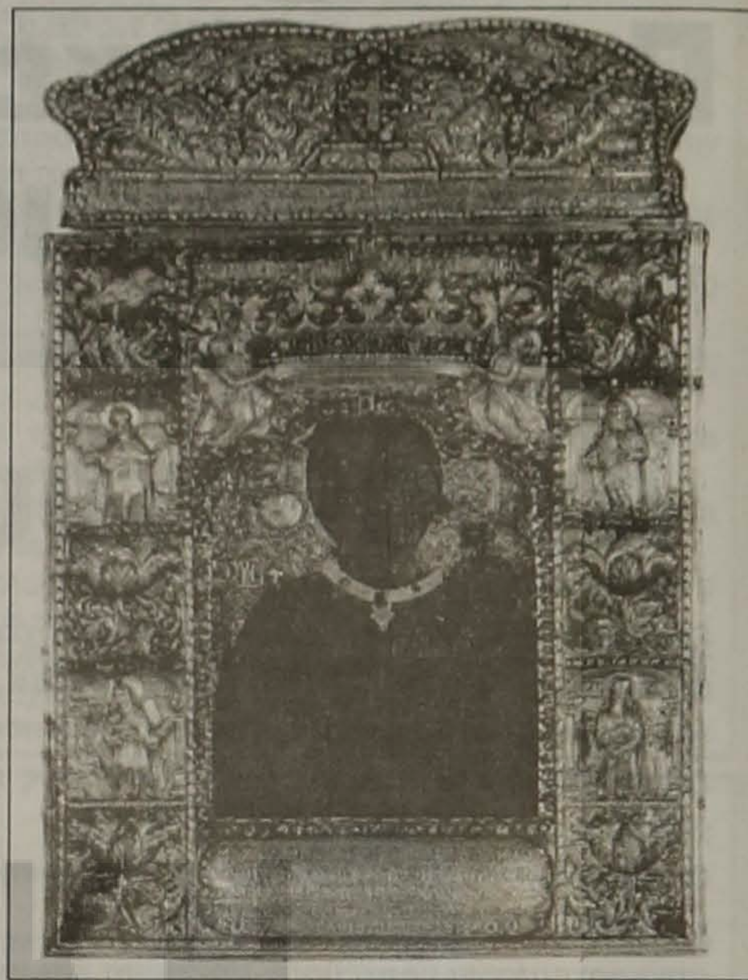
Η θαυματουργή εικόνα της Παναγίας Σουμελά

Αφησαν εκείνη, η Μεγάλη Κυρία Θεοτόκος, να αποφασίσει για το μέλλον το δικό της και του περιούσιου λαού. Γράφει