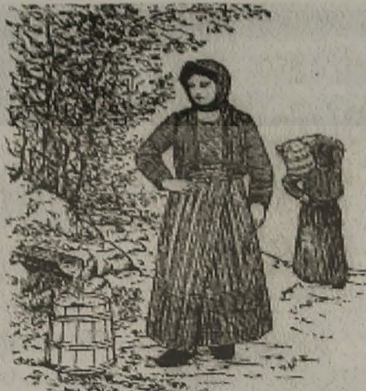
Η ΜΑΤΣΟΥΚΑΤΣΑ 'Σ ΤΟ ΚΡΕΝΙΝ

Γουρπάν εσουν, είπεν Αβραμαντίνα, εγώ εγέρασα, άλλο κι σώζω. Ντο ν' εφτάγω; Τα δύο σαλάκια έναν εφτάγ' ατά!