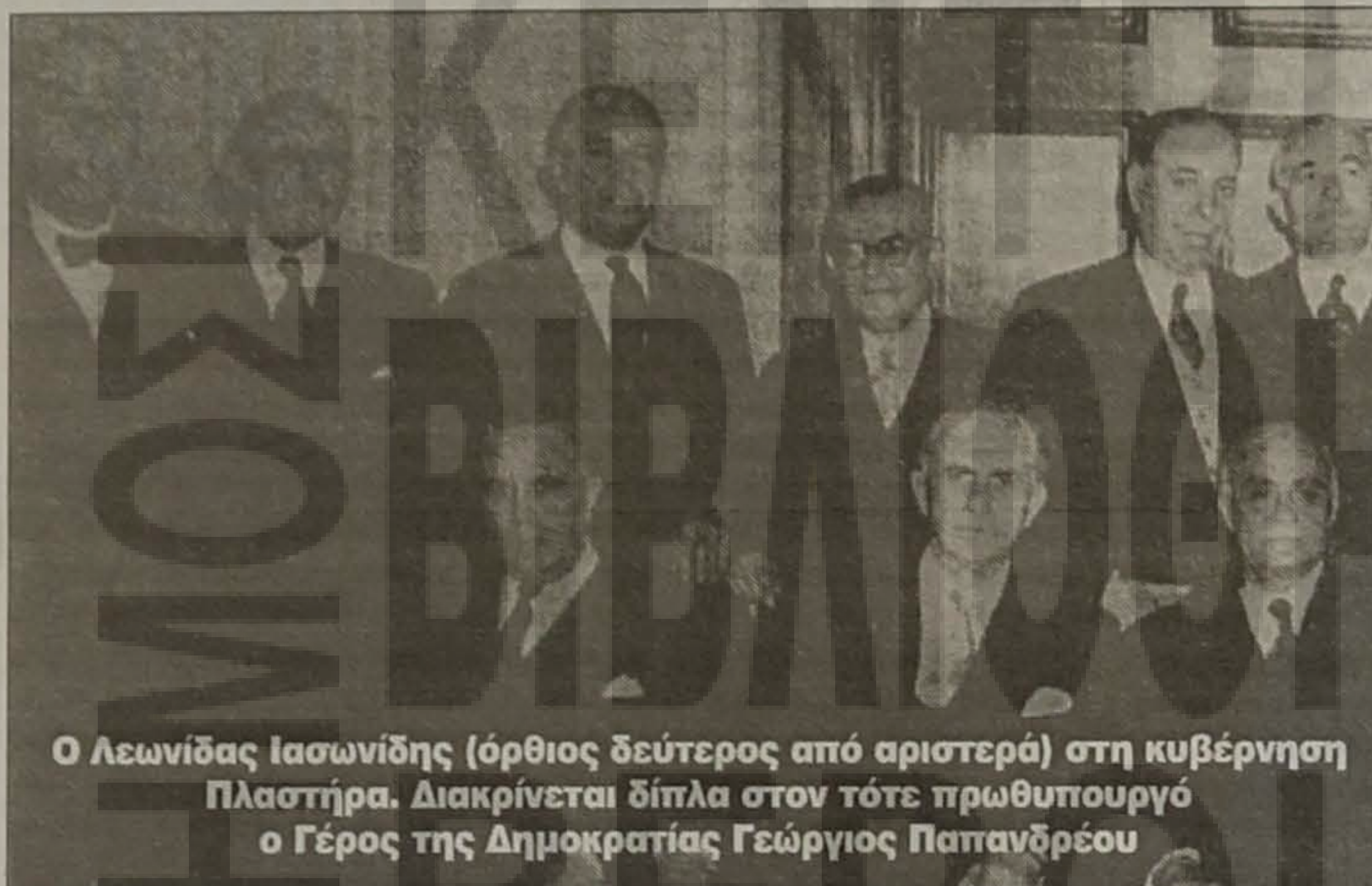
Ο Λεωνίδας Ιασωνίδης (όρθιος δεύτερος από αριστερά) στη κυβέρνηση Πλαστήρα. Διακρίνεται δίπλα στον τότε πρωθυπουργό ο Γέρος της Δημοκρατίας Γεώργιος Παπανδρέου

ράλληλα πλήρωσε βαρύ το τίμημα των εθνικών του αγώ- νων, χάνοντας τον εικοσιεπτάχρονο αδερφό του Ιάσωνα, τον οποίο οι Τούρκοι - μην μπορώντας να συλλάβουν τον ίδιο - έκαψαν ζωντανό.