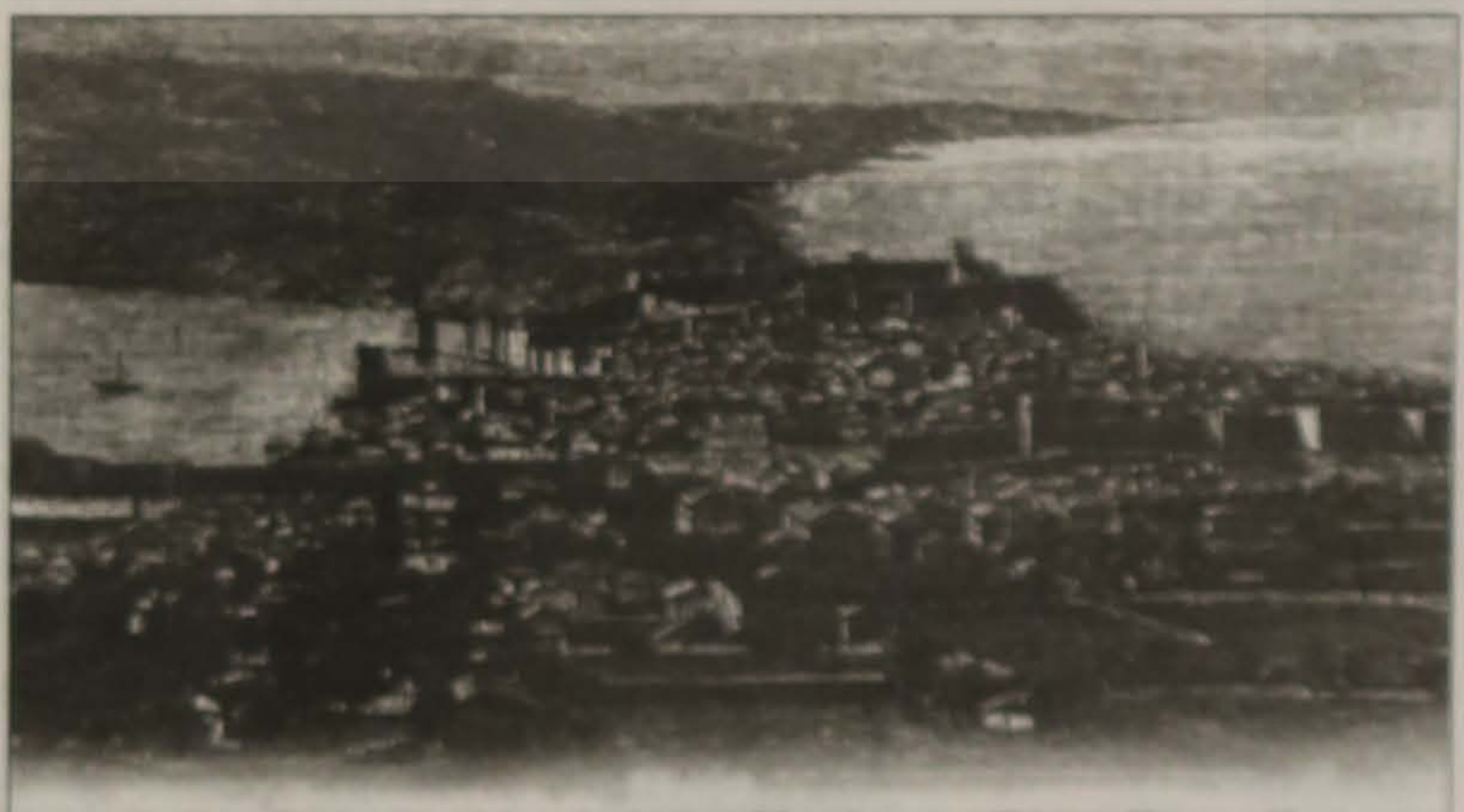
Γκραβούρα Σινώπης από τη συλλογή του κ. Τάσου Κιτσιακίδη