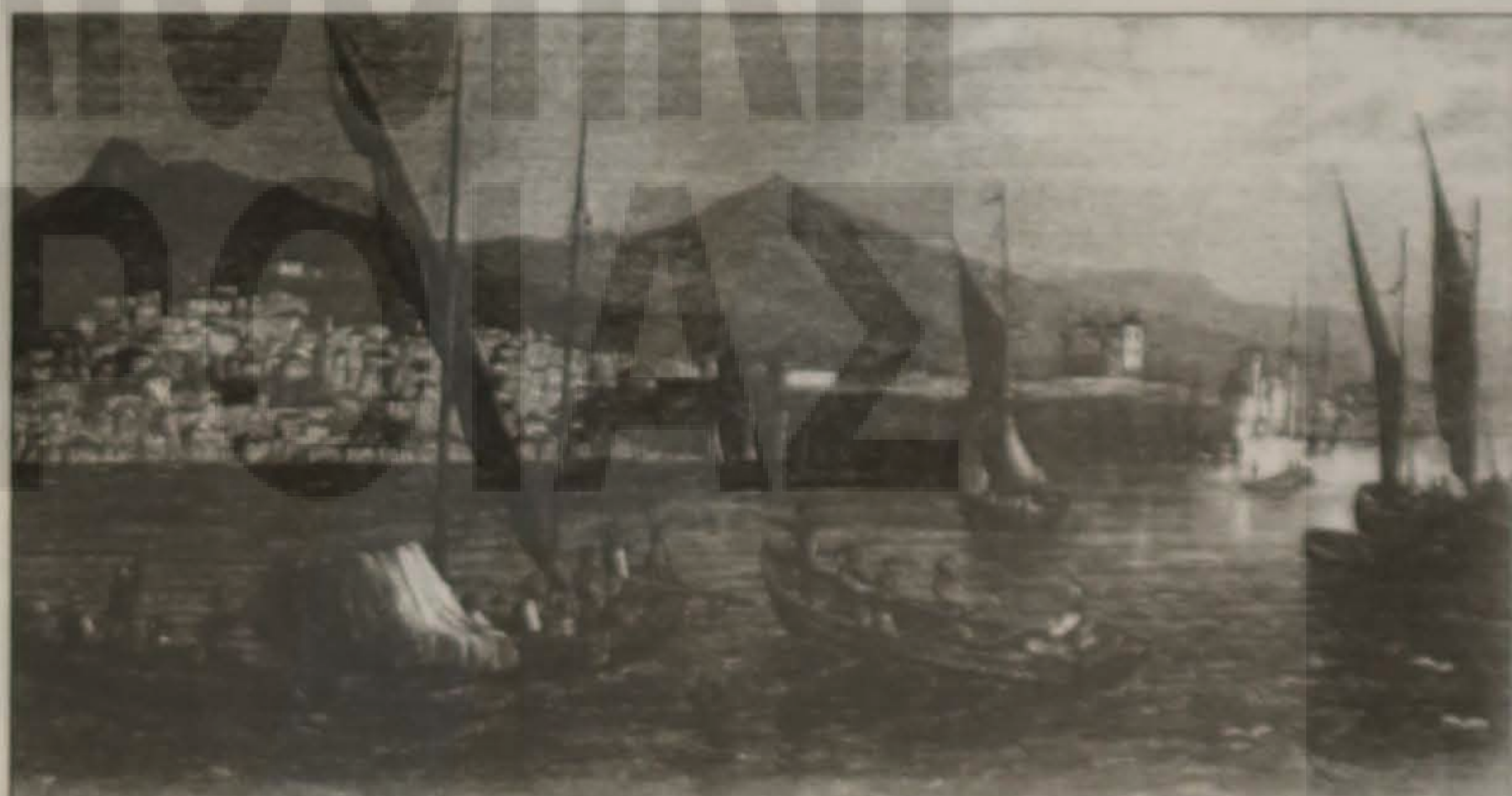
Γκραβούρα Τραπεζούντας από τη συλλογή του κ. Α. Αρτζόπουλου