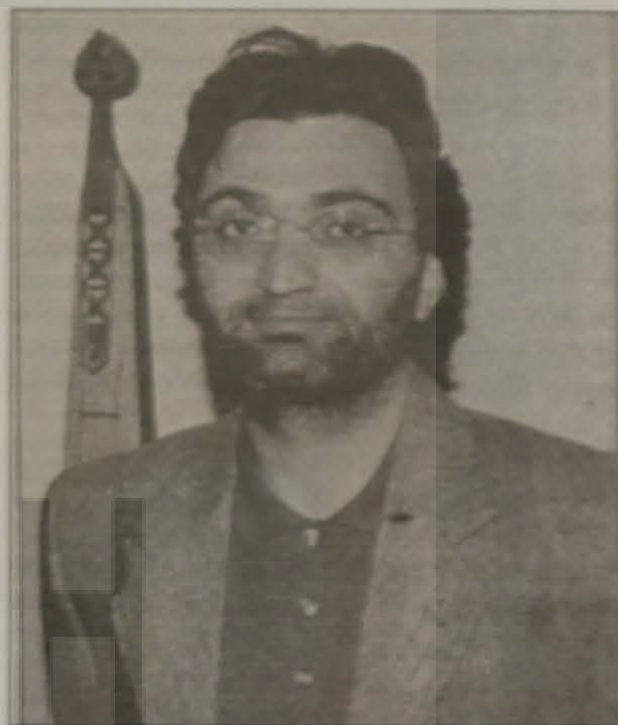
Ο ποντιακής καταγωγής Τούρκος συγγραφέας Ομέρ Ασάν.