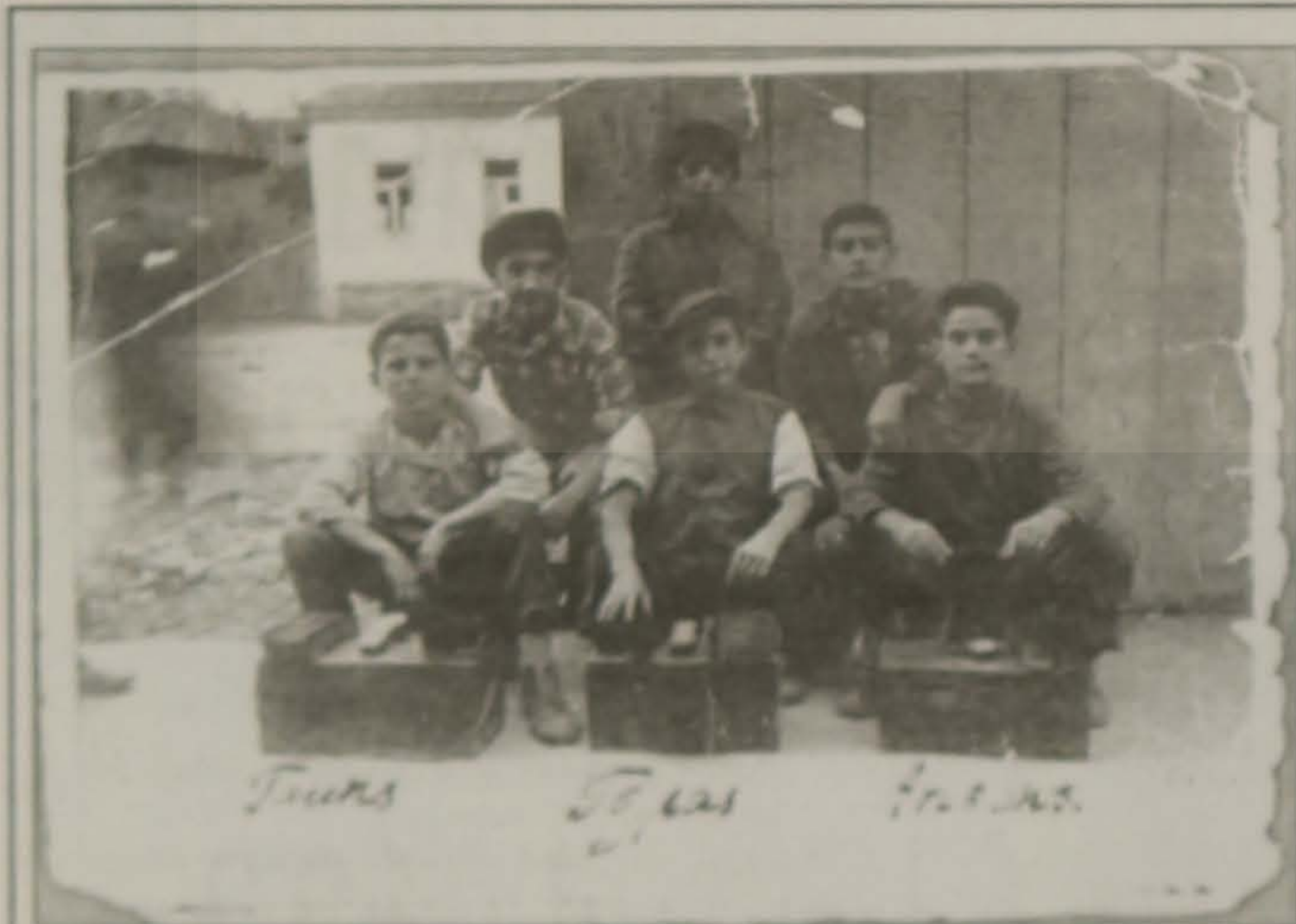
Καλαμαριά 1939. Προσφυγόπουλα από το Σοχούμ, εργάζονται σαν λούστροι.