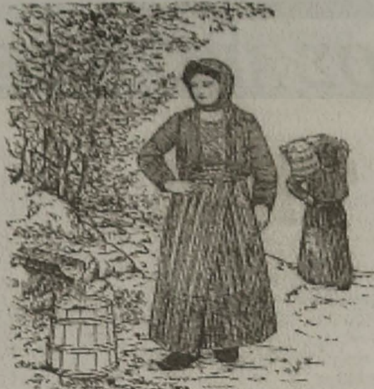
Η ΜΑΤΣΟΥΚΑΤΣΑ 'Ο Ο ΚΡΕΝΙΝ

Πολλά έμνοστα τα κοκκία μ' εφτάτεν, γιατί αύριον πα- τρών' ατα οι χωρέτ' ατ λένε: Ντο έμνοστα που έσαν τα κοκκία τη Βαρβάρας! Να επεθάνεν κι ο Χαρίτας κι έτρωγα με και τ' εκείνού πα, κι εγώ από ξάι κι θέλα το.