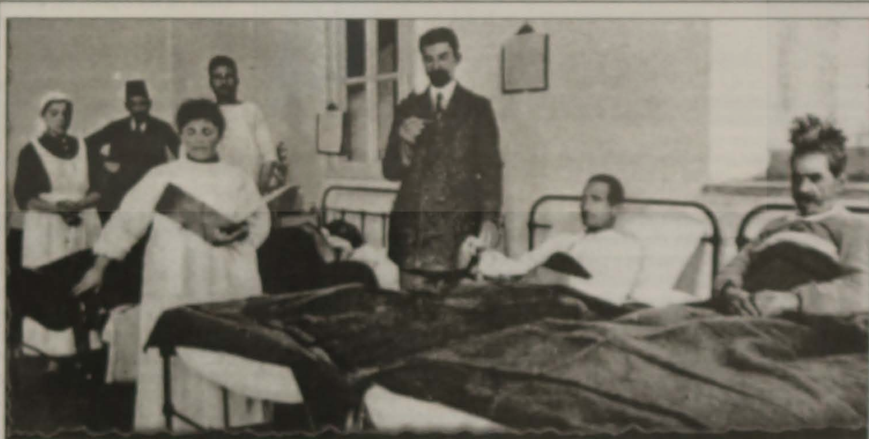
Στη δυτική πλευρά του Μίθριου βουνού, στην Τραπεζούντα, κάτω από την κερή μονή της Θεοσκεπάζου ήταν κτισμένο το Ακρίτειο νοσοκομείο, το οποίο περιέβαλλε διαρκώς τους έμπορους Έλληνες ασθενείς.