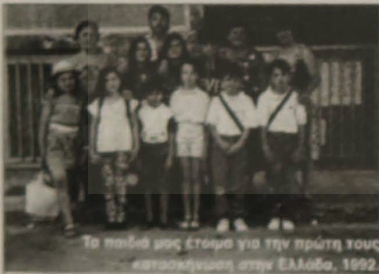
Τα παιδιά μας έτοιμοι για την πρώτη τους κατασκήνωση στην Ελλάδα, 1992.