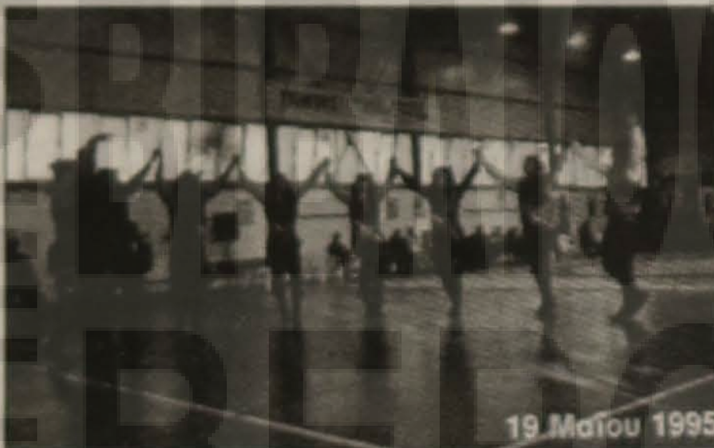
19 Μαΐου 1995

καταγράφουμε, αναλύουμε, τεκμηριώνουμε και θέτουμε επανειλημμένα υπόψη των ελληνικών κυβερνήσεων τα ζωτικής σημασίας προβλήματα και εμπόδια, που συναντούν οι Έλληνες του Πόντου από την πρώην Σοβιετική Ένωση και τα οποία αφορούν την εργασία, την εκπαίδευση, την στέγαση, την κοινωνική ένταξη, κρινωτικοασφαλιστικά ζητήματα, στρατολογικά θέματα, θέματα πρόνοιας, τους εκβιασμούς, τα σκάνδαλα και την διασπάθιση πολλών δεκάδων δισεκατομμυρίων δρχ. - που προορίζονταν για τις οικογένειες των Ποντίων από την πρώην Σοβιετική Ένωση (ΕΙΑΠΟΕ, επιδοτούμενα προγράμματα κ.λπ.), τον εξοστρακισμό μαθητών και φοιτητών από την τριτοβάθμια εκπαίδευση στην Ελλάδα, την άμεση απομάκρυνση των ελληνικών οικογενειών από τον πόλεμο του Καυκάσου το 1992 - 1993, τις διώ-