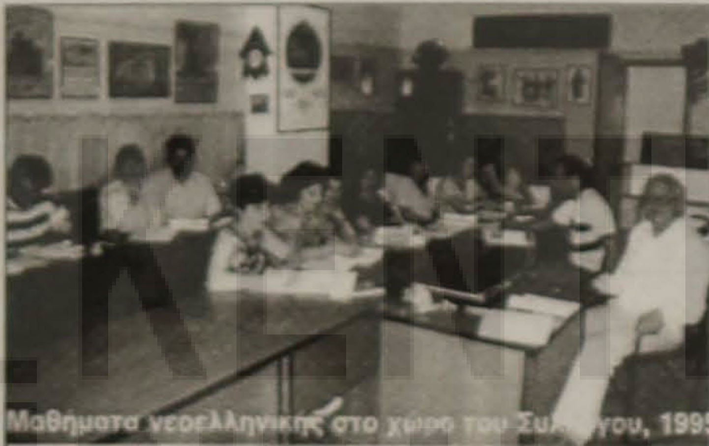
Μαθήματα νεοελληνικής στο χώρο του Συλλόγου, 1995