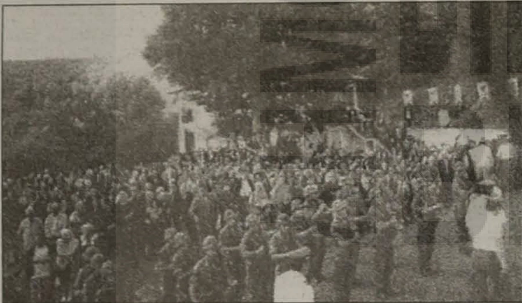
Ο αύλειος χώρος του Ξενώνα των Σανταίων, την ημέρα του ετήσιου μνημοσύνου. Στρατιωτική μπάντα και άνδρες του Β' Σώματος Στρατού αποδίδουν τιμές.

Οι Σανταίοι δεν τους ξεχνούν. Ας είναι αιωνία τους η μνήμη. Αναδημοσίευση: «ΛΑΟΣ», 9-9-2001