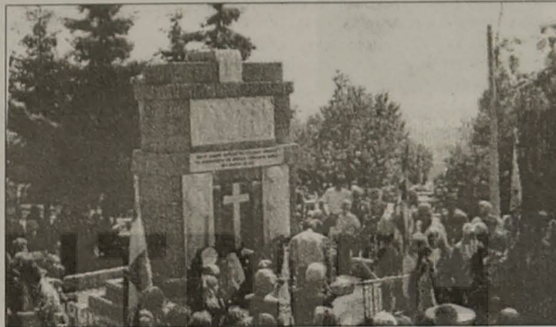
Από το ετήσιο μνημόσυνο των Σανταίων. Κατάθεση στεφάνων στο Μνημείο των νεκρών του Ολοκαυτώματος της Ηρωϊκής Σάντας του Πόντου, που ο τουρκικός στρατός την κατέστρεψε τον Σεπτέμβριο του 1921.

πραγματοποίησης των σκοπών των Σανταίων και του Συλλόγου των Σανταίων Θεσ/νίκης "Η Εφτάκωμος Σάντα".