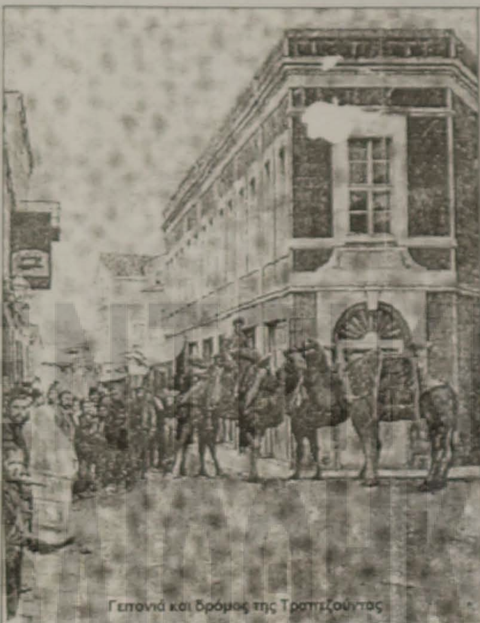
Γεγονιά και δρόμος της Τραπεζούντας

Ο Πόντος που αποτελεί το μεγαλύτερο μέρος της χώρας αυτής περιλαμβάνεται ανάμεσα στον ποταμό Άλυ, το Αργαίο όρος και δυτικά από τα μέρη του Παλιόδρου ως το Ιαζώνιο άκρο.