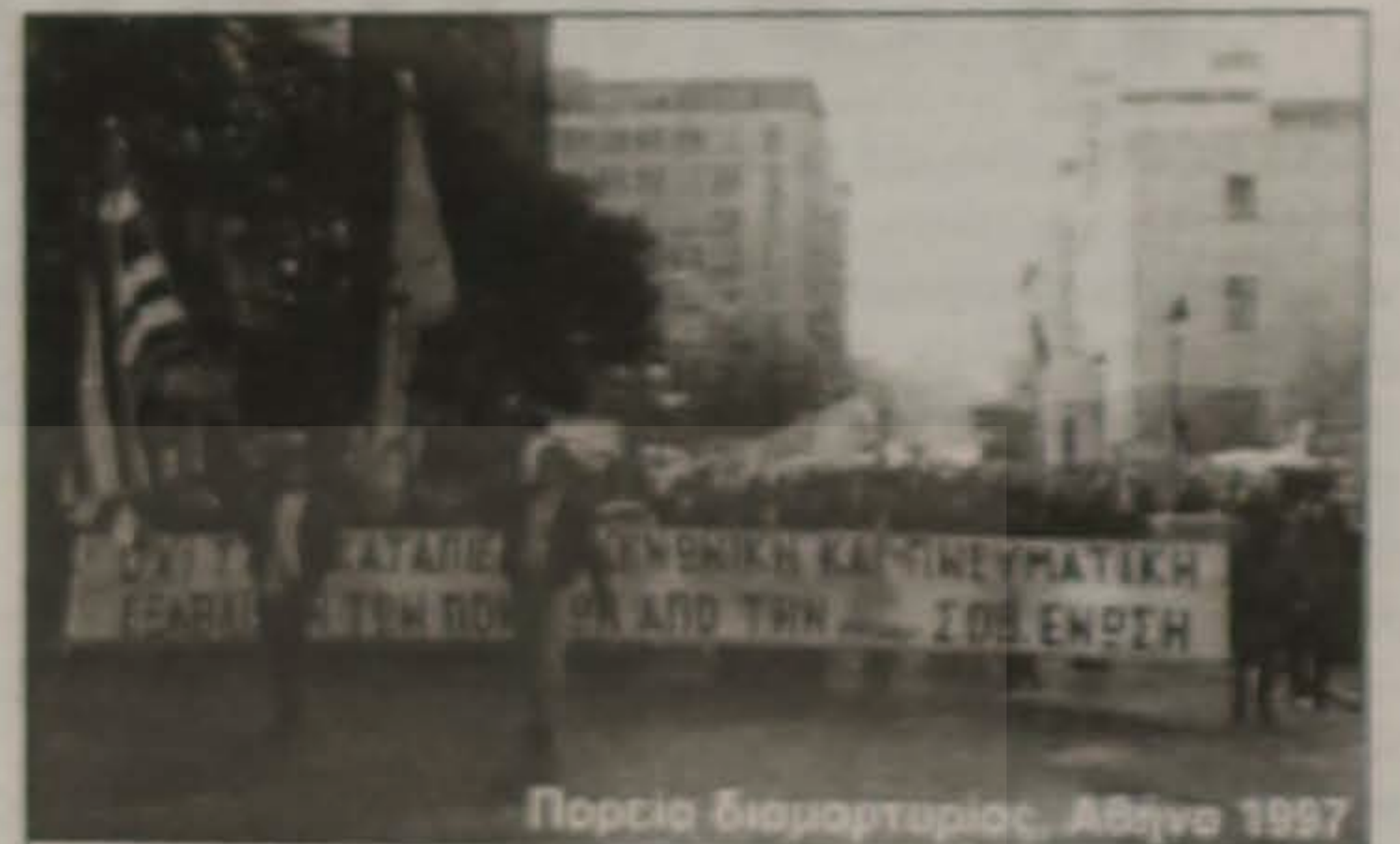
Πορεία διαμαρτυρίας, Αθήνα 1997

Στις εκδηλώσεις συμμετέχουν πολλοί σύλλογοι και παρευρίσκεται πλήθος κόσμου μέσα στον οποίο όλο και πιο πολύ ξεχωρίζει η παρουσία της νεολαίας. Στο ποντιακό τριήμερο, που πραγματοποιείται