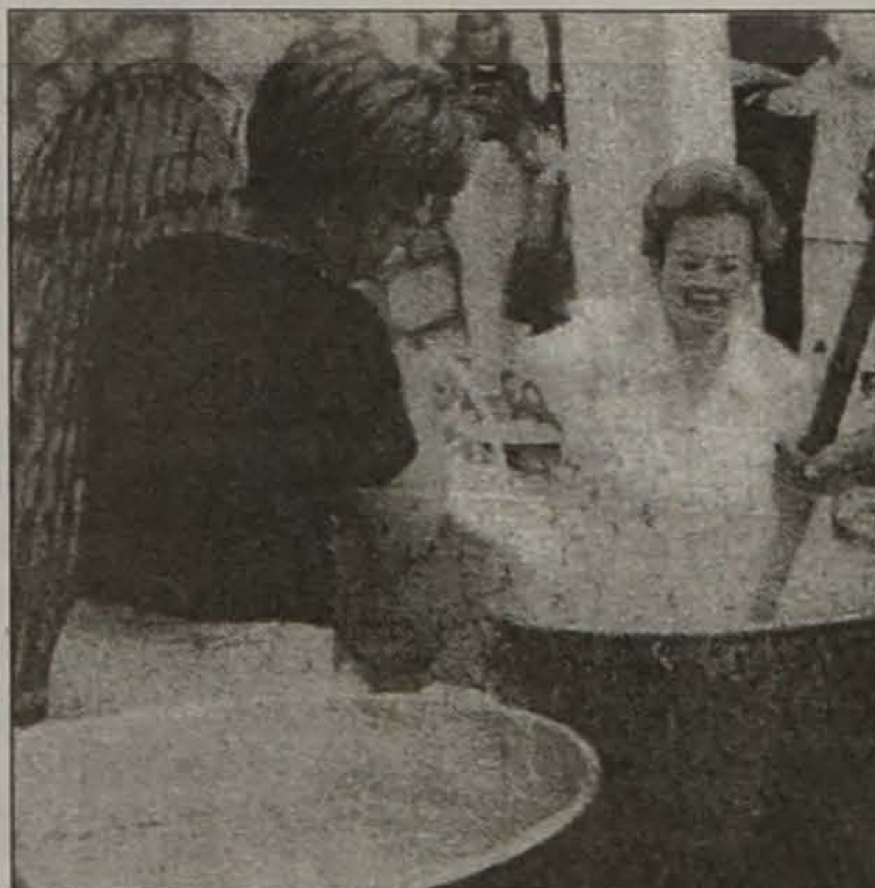
Σανταίες γυναίκες ετοιμάζουν τον πατροπαράδοτο σορβά για να προσφερθεί μετά το ετήσιο μνημόσυνο των Σανταίων.