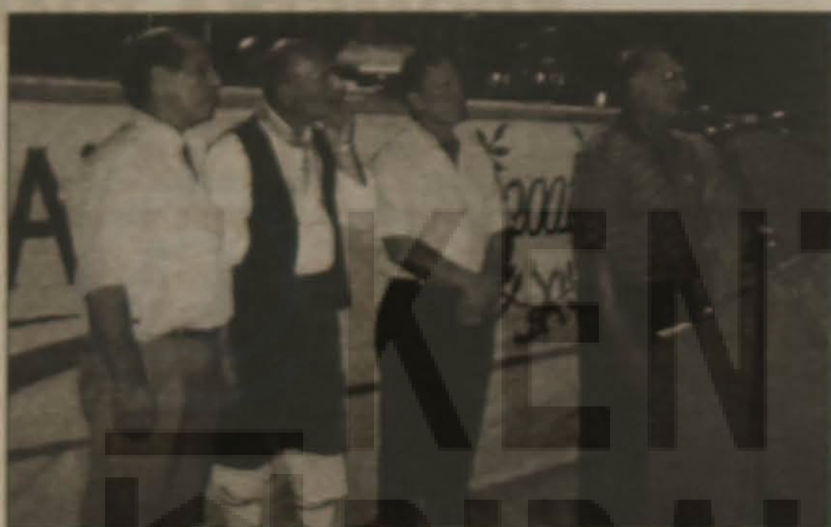
Στο μικρόφωνο απευθύνει χαιρετισμό ο πρόεδρος του Πολιτιστικού Συλλόγου Κομποτίου Άρτας. Δίπλα του ο Δήμαρχος Κομποτίου, ο πρόεδρος του Συλλόγου των Ελληνόφωνων Καλαβρίας της Νότιας Ιταλίας και ο πρόεδρος της Ευξεινίου Λέσχης Βέροιας.