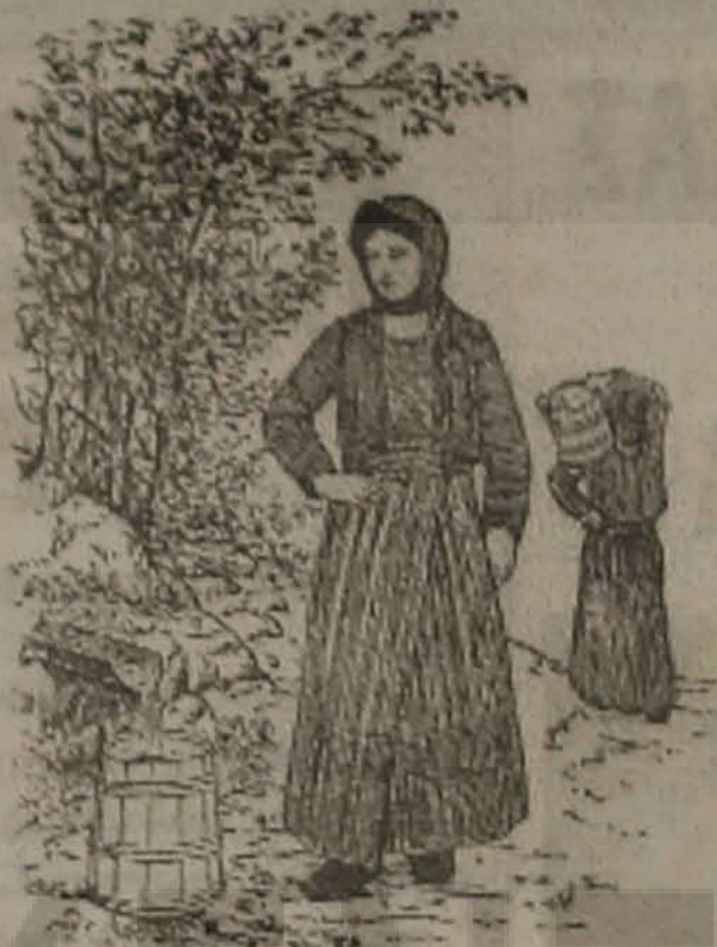
Η ΜΑΤΣΟΥΚΑΤΣΑ 'Ο ΣΟ ΚΡΕΝΙΝ

- Αφήστεν το χεροφιλεμα και φέρτεν ας βαφτίζω-