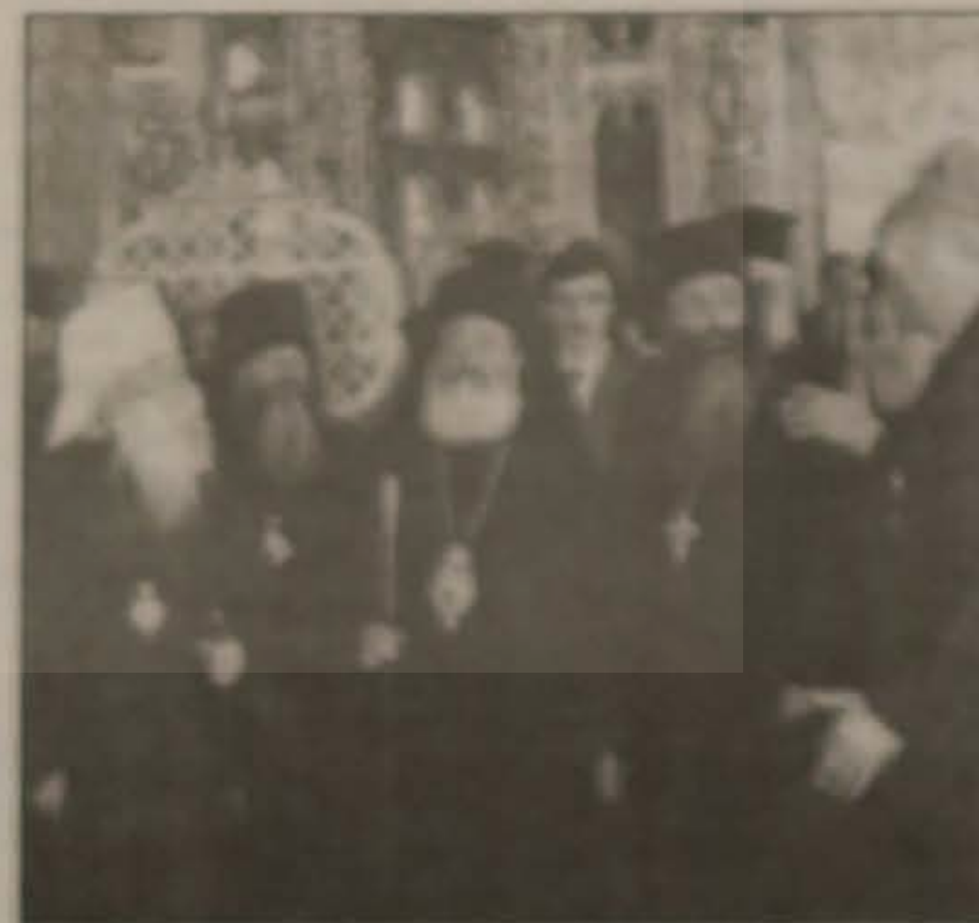
Ο Αρχιεπίσκοπος κ. Χριστόδουλος (στο μέσον) ξεναγήθηκε και στο παλάτι της Μεγάλης Αικατερίνης

Ο Αρχιεπίσκοπος κ. Χριστόδουλος, που αναμένεται να έχει εκ νέου συνάντηση με τον Πατριάρχη Μόσχας κ. Αλέξιο, λίγο προτού αναχωρήσει από την Αγία Πετρούπολη για τη Μόσχα, επισκέφθηκε έναν αρθόδοξο ναό, ο οποίος επί δεκαετίες είχε μετατραπεί σε μουσείο αθεΐας. «Διερωτώμαι, πώς είναι δυνατόν να διδάσκεται και να προωθείται η αθεΐα μέσα σε αυτό το μεγαλόπυργο, το οποίο διαλαλεί τη δόξα του Θεού. Πώς είναι δυνατόν να προβάλλεται η ανυπαρξία του Θεού μέσα σε αυτόν τον ναό, ο οποίος είναι απλή ένδειξη και μόνον ότι ο Θεός υπάρχει» προσέθεσε ο κ. Χριστόδουλος.