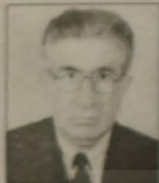
Γράφει ο Παναγιώτης Ι. Παπαδόπουλος Φιλολόγος - Καθηγητής

Για την Ελλάδα τα τύμπανα του πολέμου έχουν αρχίσει να χτυπούν από τον Οκτώβρη του περασμένου χρόνου, 1940. Ο ελληνικός στρατός δίνοντας μαθήματα πολεμικής αρετής, έφτασε στην καρδιά της Αλβανίας στο κινήγι των Ιταλών στρατιωτών του Μουσολίνι.