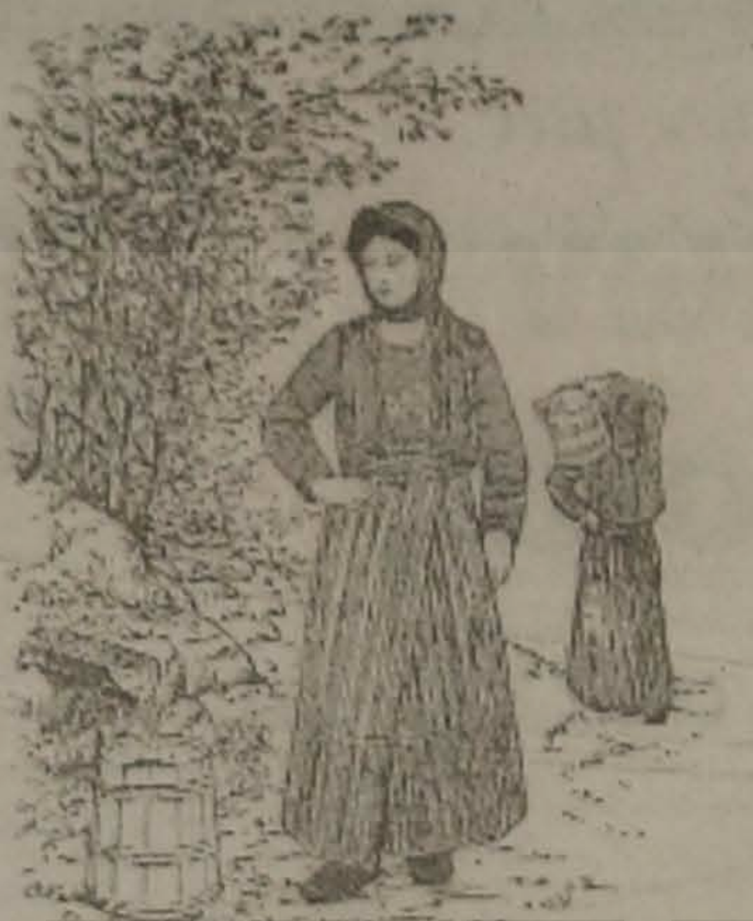
Η ΜΑΣΣΟΥΚΑΤΣΑ 'Σ ΣΟ ΚΡΕΝΙΝ

Εναν ημέραν ο Παρμαξούης εσεβεν σο καβενείον τη Χρύσσιονος και χολιασμένος ας σ' οσπίτ εγυροκλώσκουτον και εχοντρολάλνεν. Επουγαλεύτεν τη Κύρτογλη ο Χαράλαμπον και είπεν άτον: - Ντ' έπαθες κ' εσύ πα; Για τούλωσαν, για εξ απ' απαδαπέσ. - Ογώ, είπεν ο Παρμαξούης, ση βασιλέα το χώμαν απάν πατώ εσείν επάρτεν τα περβόλια σουν και δεβάτε πλαν, ας σου κι θέλετε ν' ακούτε με.