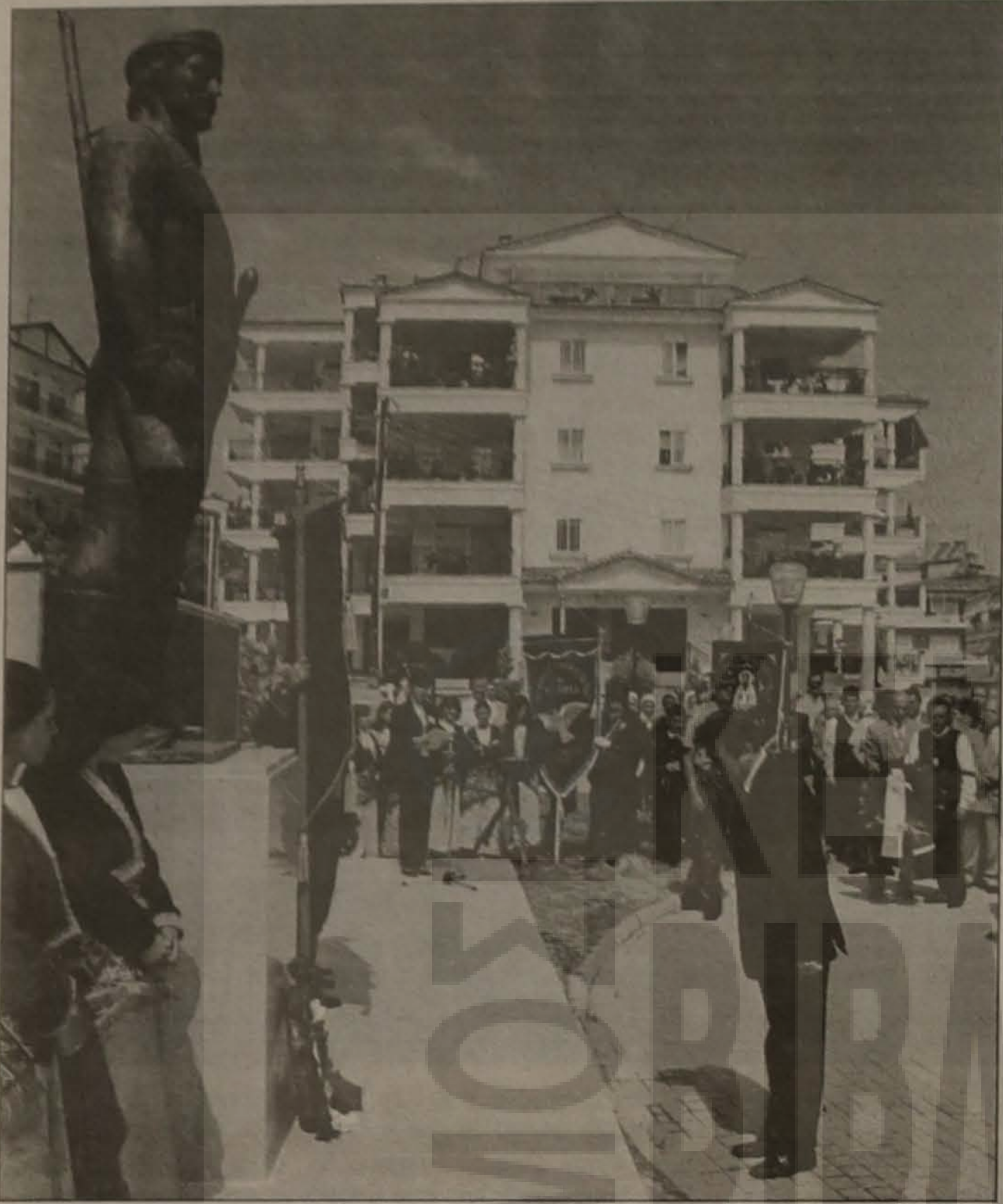
Ο Υπουργός Δημόσιας Τάξης κ. Μιχάλης Χρυσοχοΐδης