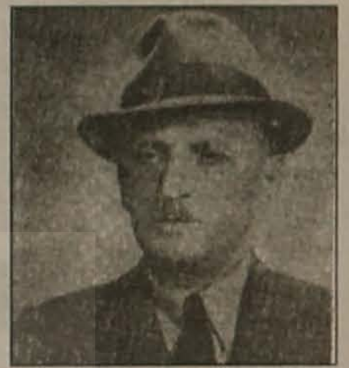
Νοσταλγός πατρίδας γιης ανιάτος Υμνωδός ιστορίας πό- ντου ασίγαστος Τηρητής ιερών παρα- δόσεων ανύστακτος Άξιος τίτλου εθνικού ποιητού Πόντου Αμαράντου στεφάνου δόξης κατηξίωται.