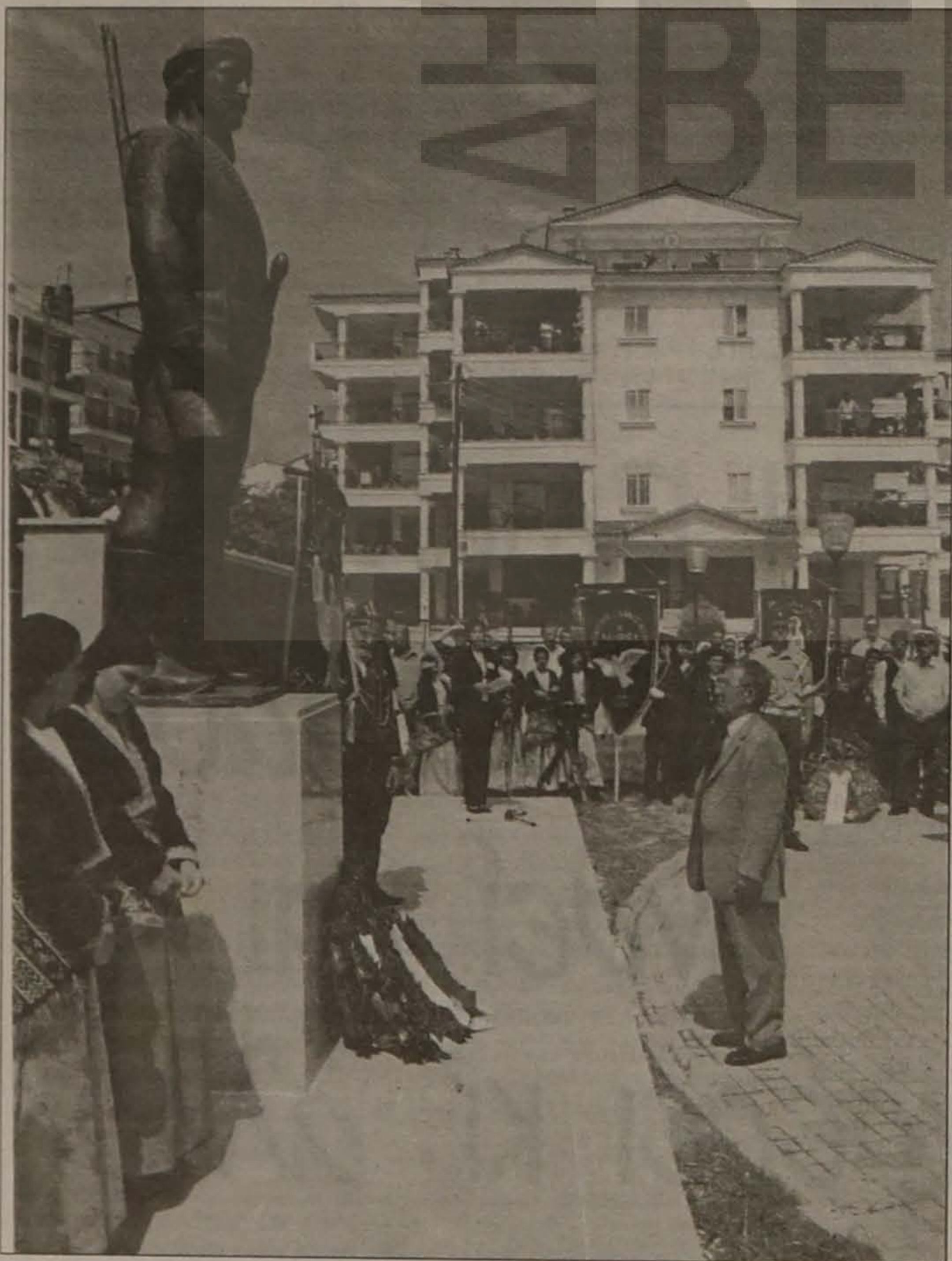
Ο Αντινομάρχης κ. Ορέστης Σιδηρόπουλος