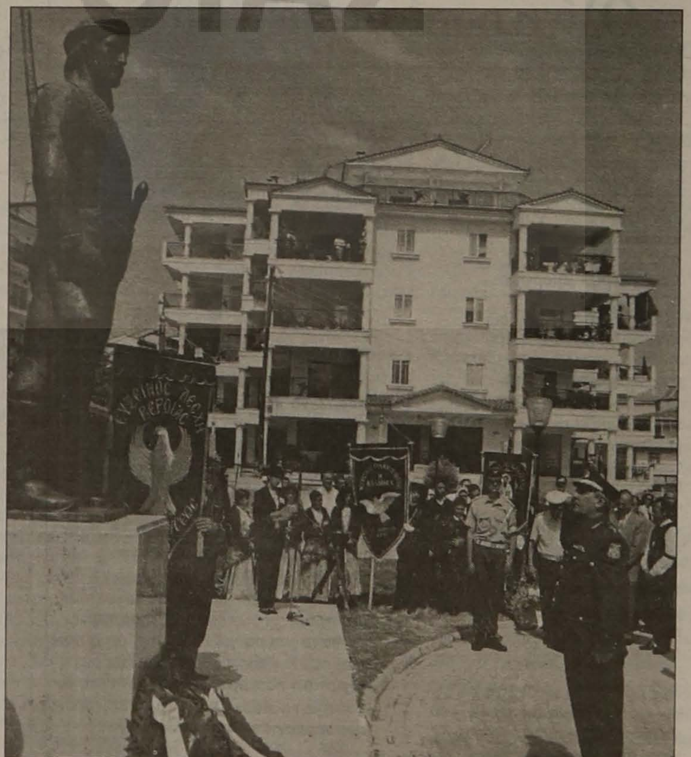
Η Αστυνομία μας