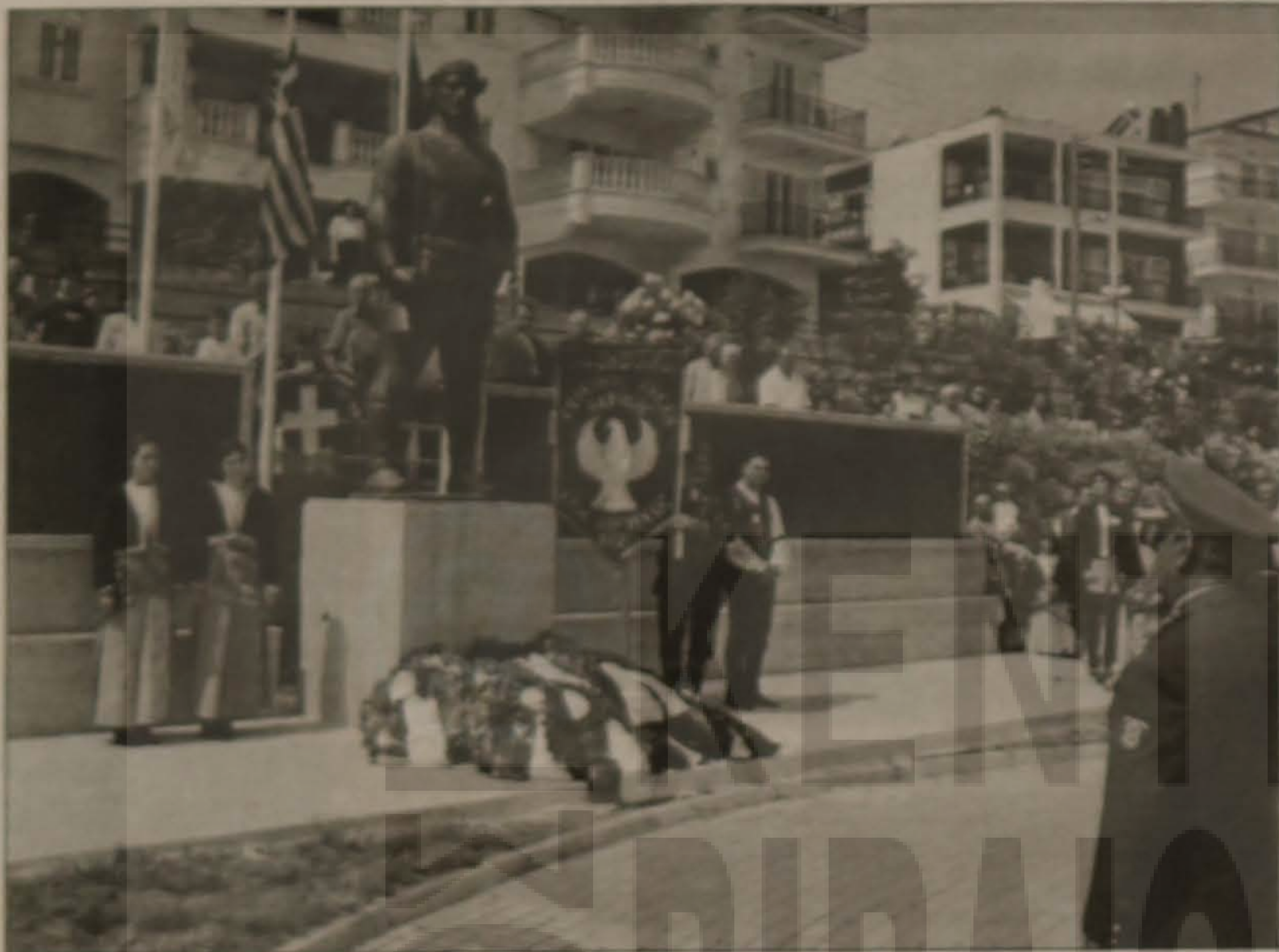
Ο Στρατός μας