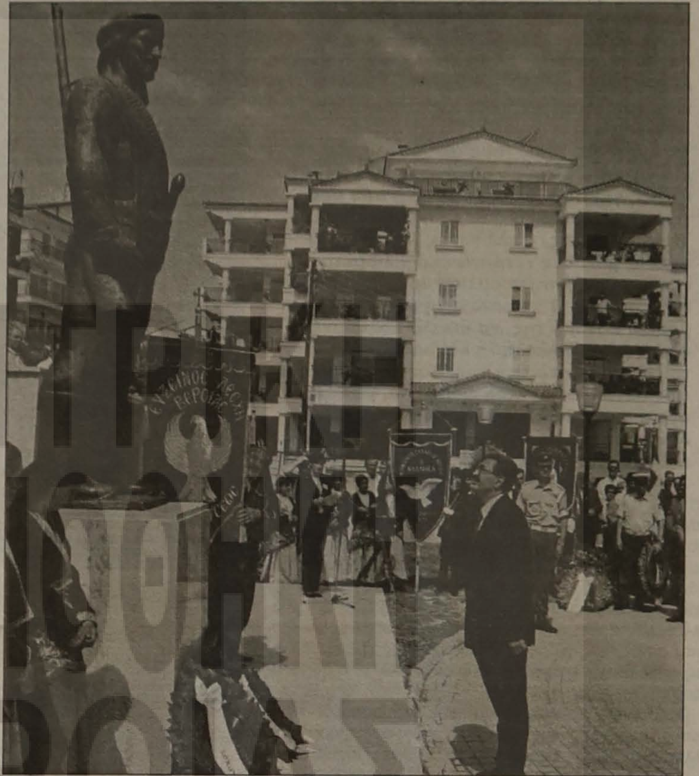
Ο Δήμαρχος Βέροιας κ. Γιάννης Χασιώτης