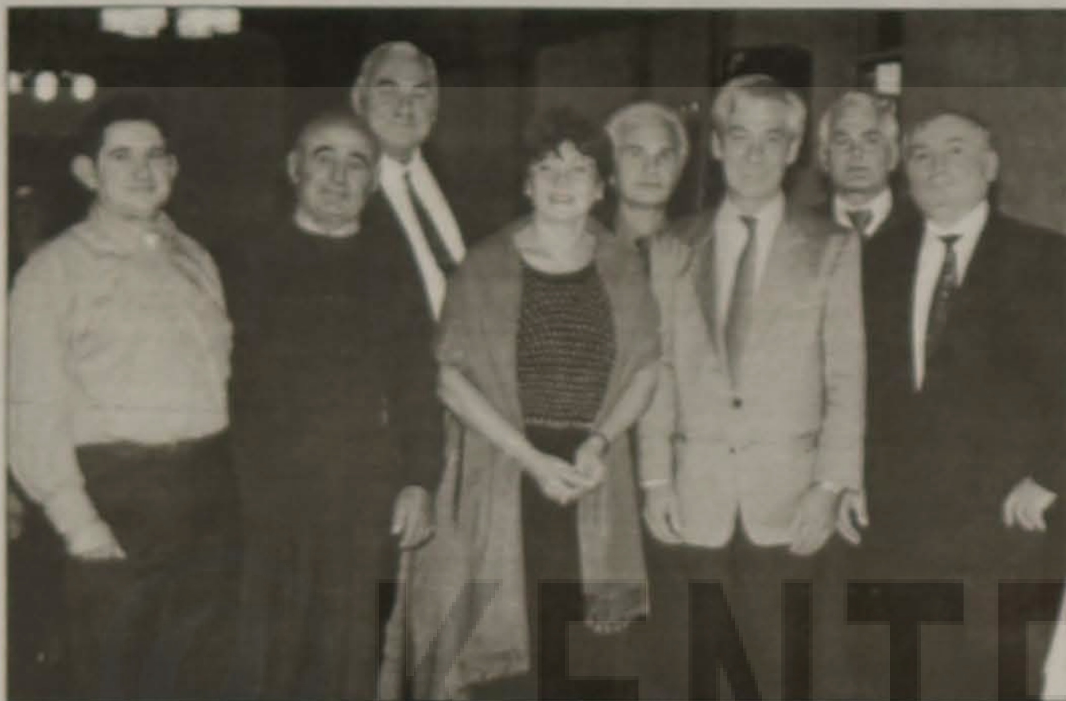
Αναμνηστική φωτογραφία από την εκδήλωση

Σε κεντρικό ξενοδοχείο της Αυστριακής πρωτεύουσας, ο Σύλλογος Ποντίων και Φίλων Ποντίων Βιέννης "Ο ΞΕΝΙΤΕΑΣ" πραγματοποίησε για μια ακόμη φορά μια λαμπρή εκδήλωση όπου παρευρέθησαν αντιπρόσωποι της ελληνικής Εκκλησίας και του Ελληνικού Διπλωματικού Σώματος και πλήθος Ποντίων και αυστριακών φίλων, που απέκτησε ο Σύλλογος στα 15 χρόνια της ιστορικής του διαδρομής.