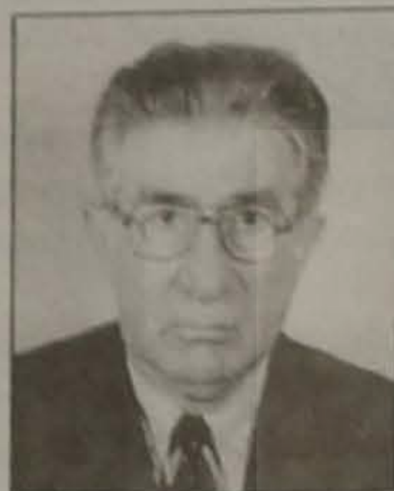
Γράφει ο Παναγιώτης Παπαδόπουλος Φιλολόγος - Καθηγητής

Η ιστορία της Βασίλισσας Μαρίας Γκιούλ Μπαχάρ της Λιβεραίας Από τις εκδόσεις Αδελφών Κυριακίδη