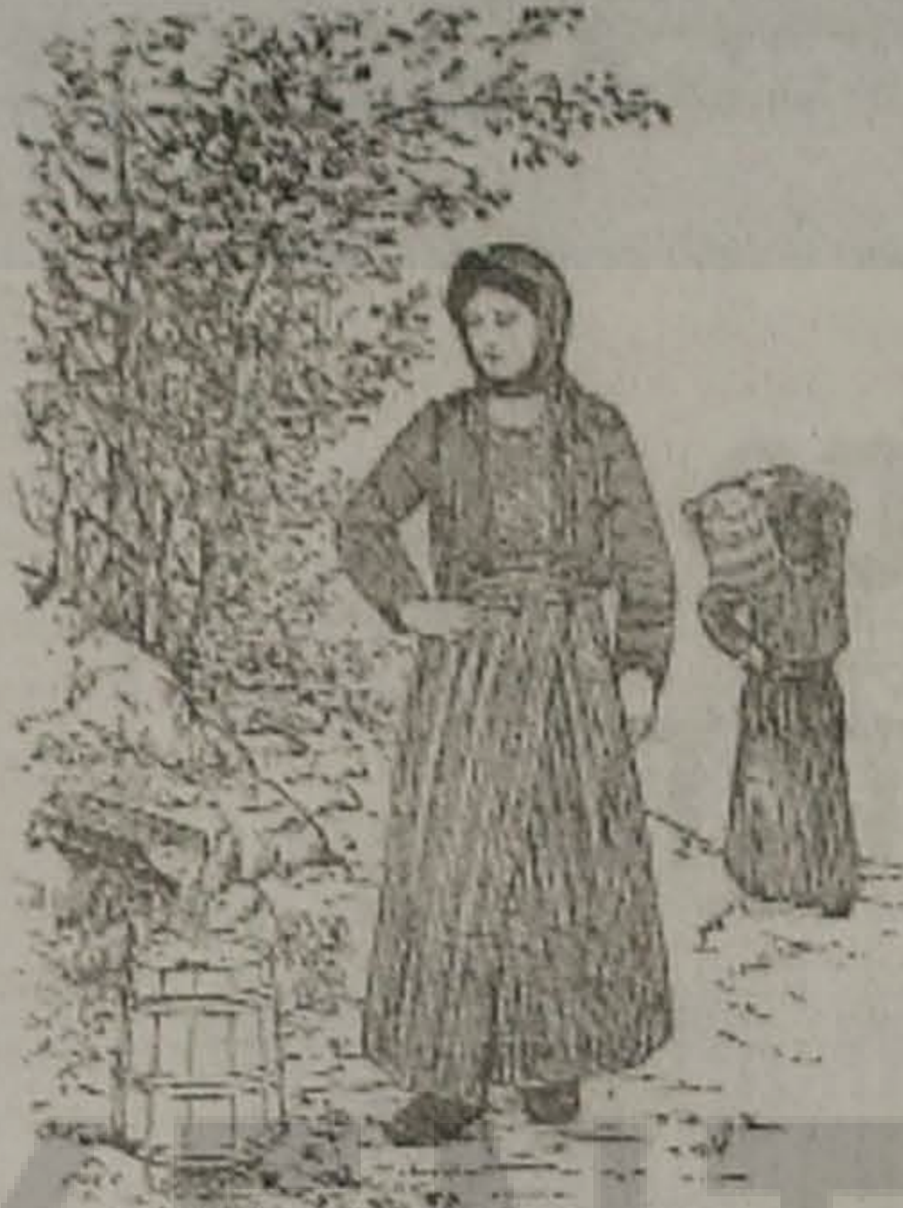
Η ΜΑΤΣΟΥΚΑΤΣΑ 'Ο ΣΟ ΚΡΕΝΙΝ

- Ερθεν κ' έρθεν σ' οσπίτ' ν ατ' έστειλεν εκάν δέκα οκάδες κρέας ση Σιαχπαντέρ... χωρίς παραδες.