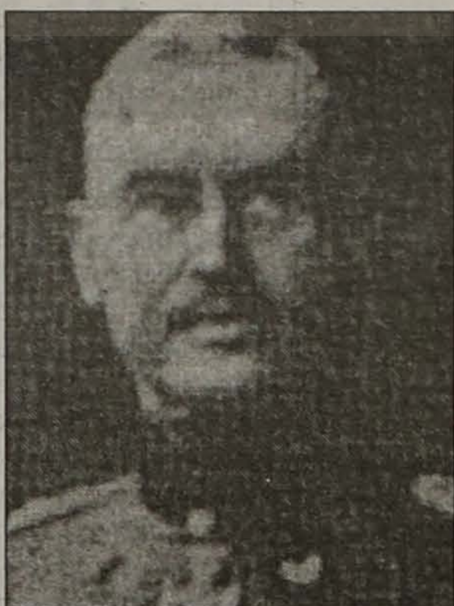
ΛΙΜΑΝ ΦΟΝ ΣΑΝΤΕΡΣ

Οι Γερμανοί αρχιτέκτονες του αφανισμού των Ελλήνων του Πόντου