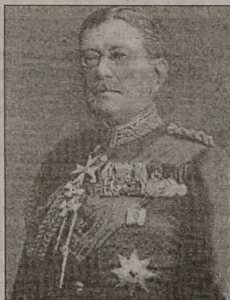
ΦΟΝ ΝΤΕΡ ΓΚΟΛΤΖ