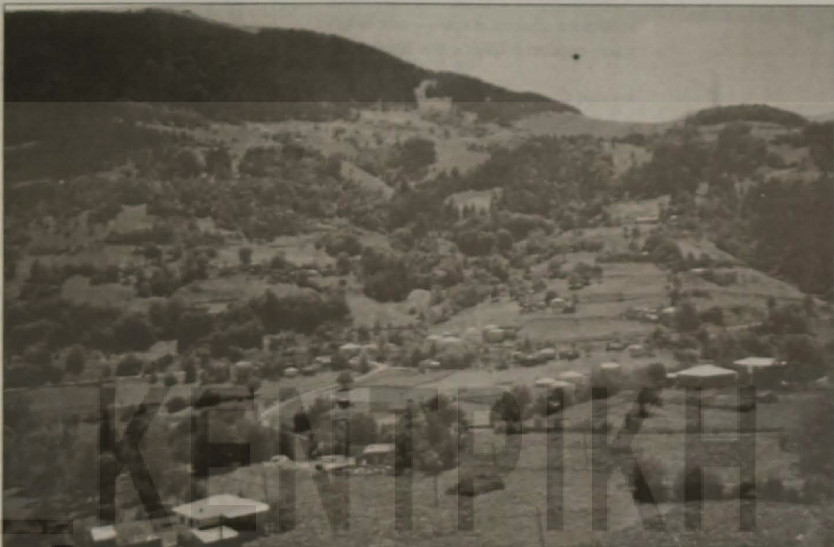
Το Χαφικιοί, όπου και σήμερα ακούεται η αθάνατη ποντιακή λύρα

Η μνήμη του παππού Sahil σε τέλεια κατάσταση θυμά-