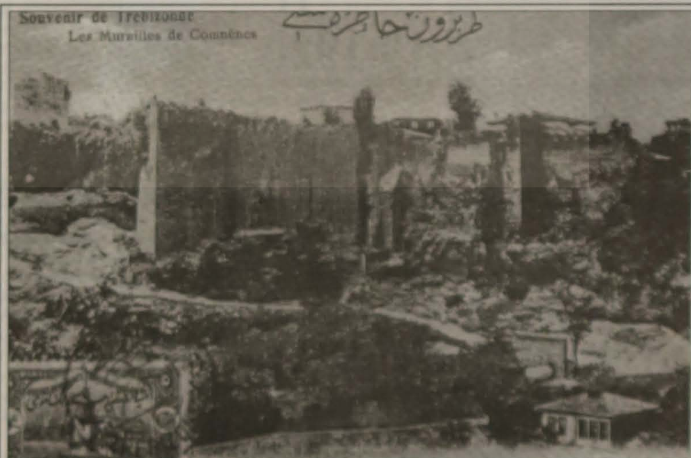
Τραπεζούντα, τα Κάστρα των Κομνηνών. Η αυτοκρατορία της Τραπεζούντας, με αυτοκράτορες τους Κομνηνούς, έζησε και μεγαλούργησε για 250 περίπου χρόνια, από το 1204 έως το 1461, δοξάζοντας στην Ανατολή τον ελληνικό πολιτισμό και την ιστορία.