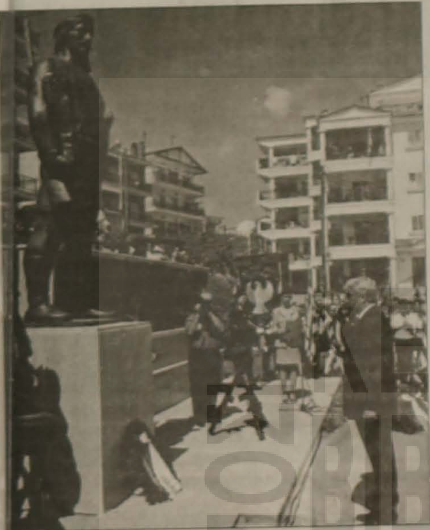
Ο βουλευτής Ημαθίας κ. Μιχάλης Χαλκίδης.