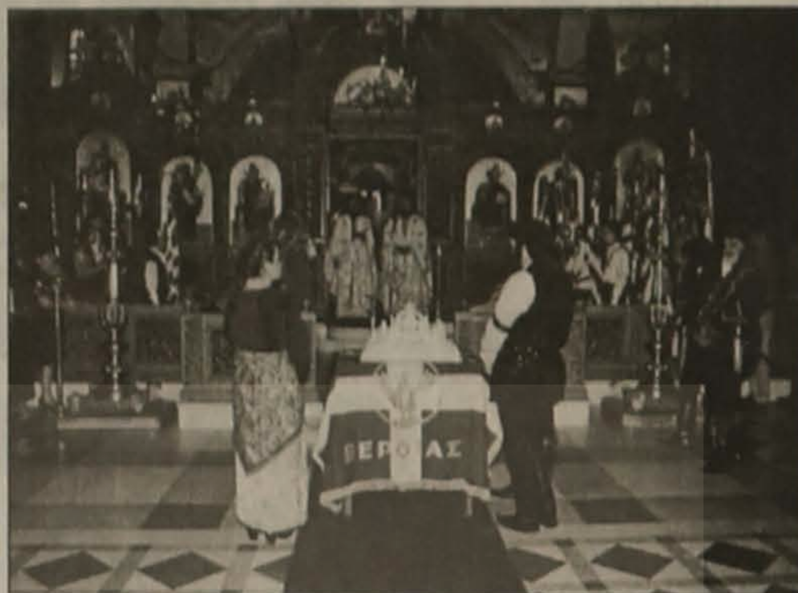
“Εις αιωνίαν μνήμην”