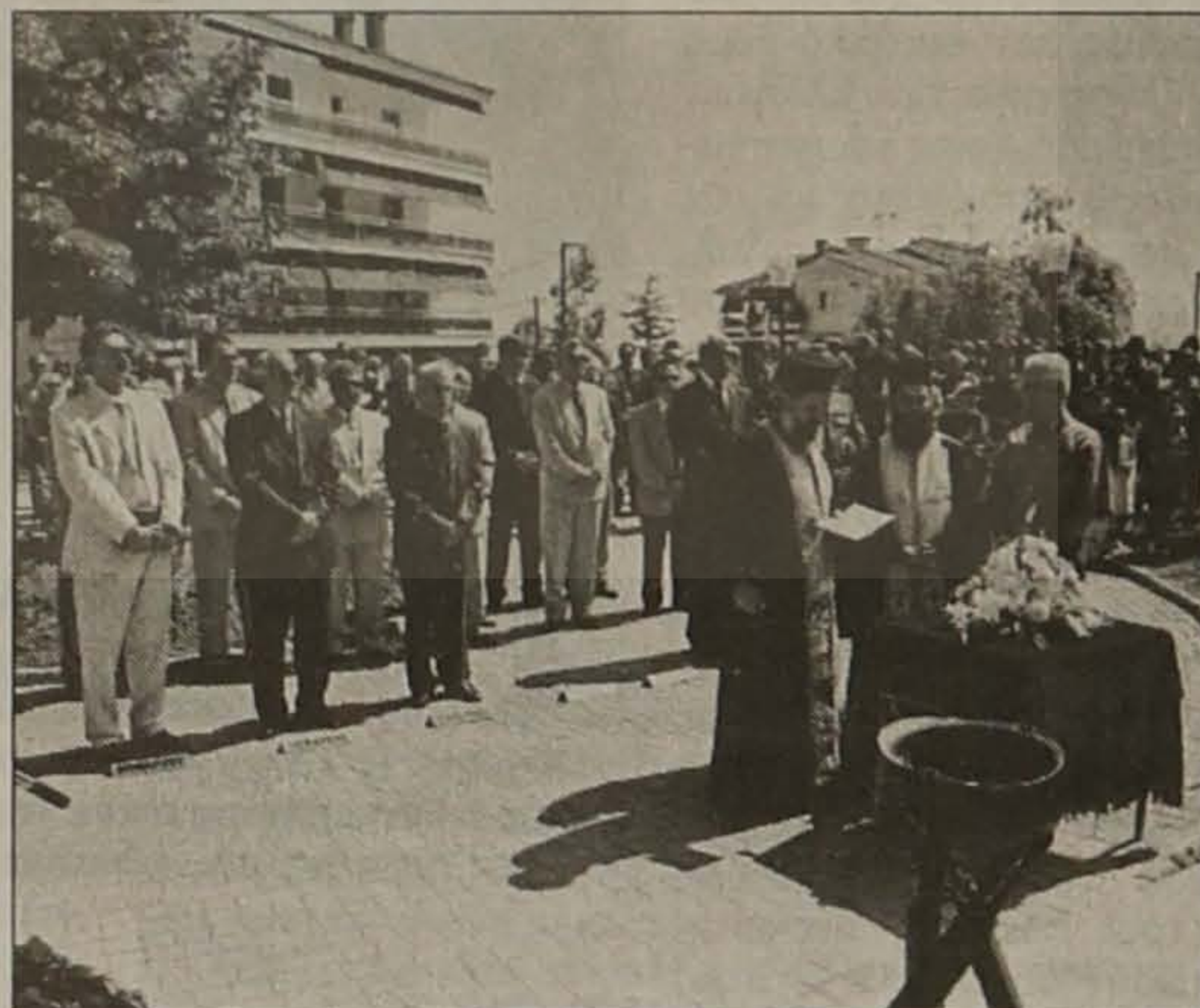
Από την επιμνημόσυνη τελετή μπροστά στο μνημείο του Ποντιακού Ελληνισμού.