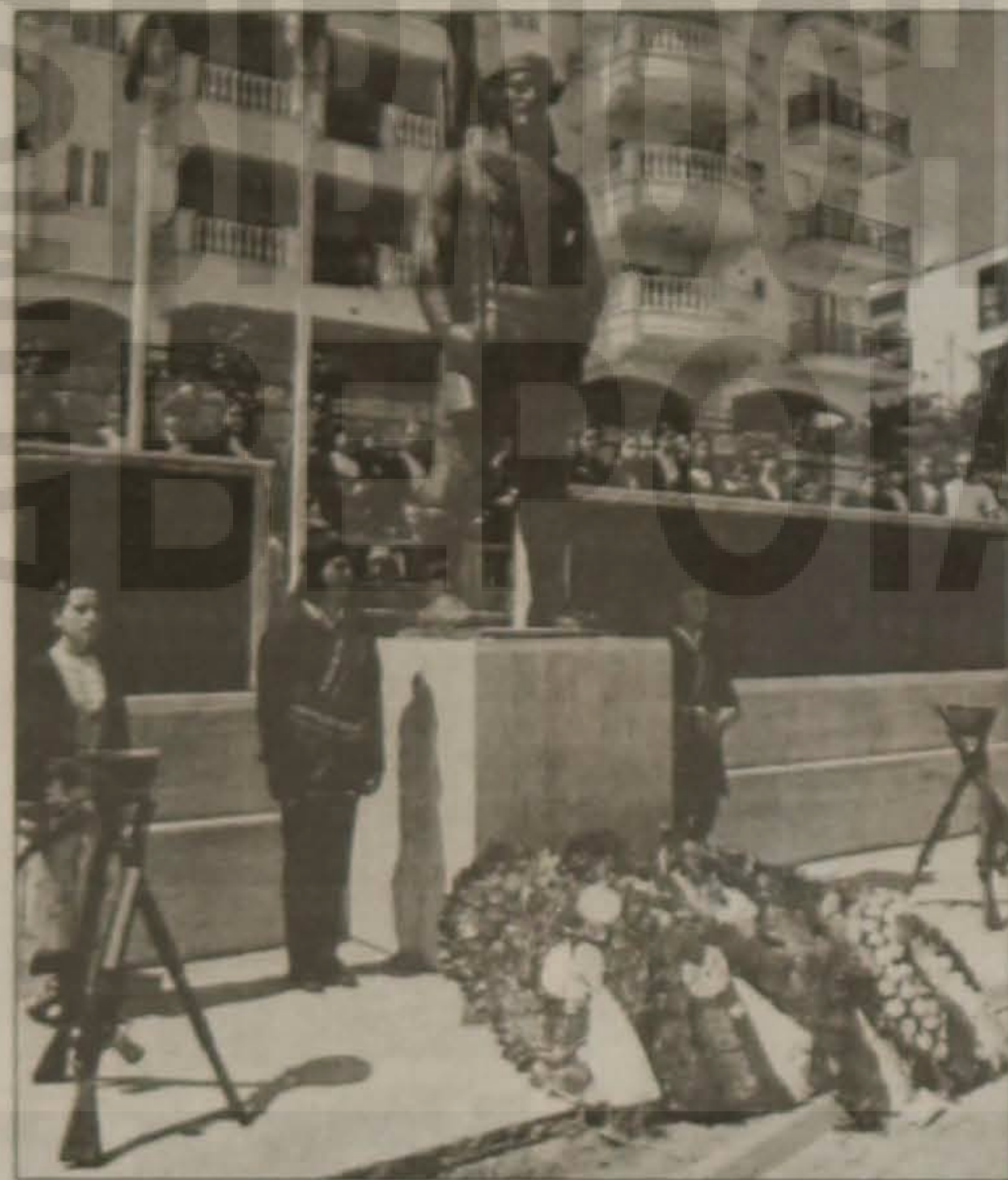
Ακρίτας: Το Μνημείο του Ποντιακού Ελληνισμού στη Βέροια (πλατεία Εθνομάρτυρα Νίκου Καπετανίδη). Ενας ελάχιστος φόρος τιμής στα αθώα θύματα των Ελλήνων του Πόντου.

Θα περιοριστούμε κατ' ανάγκη, στον χαιρετισμό του Προέδρου της Λέσχης, ο οποίος πριν καλέσει τον κ. Νομάρχη και τον κ. Δήμαρχο για τα αποκαλυπτήρια, απηύθυνε χαιρετισμό.