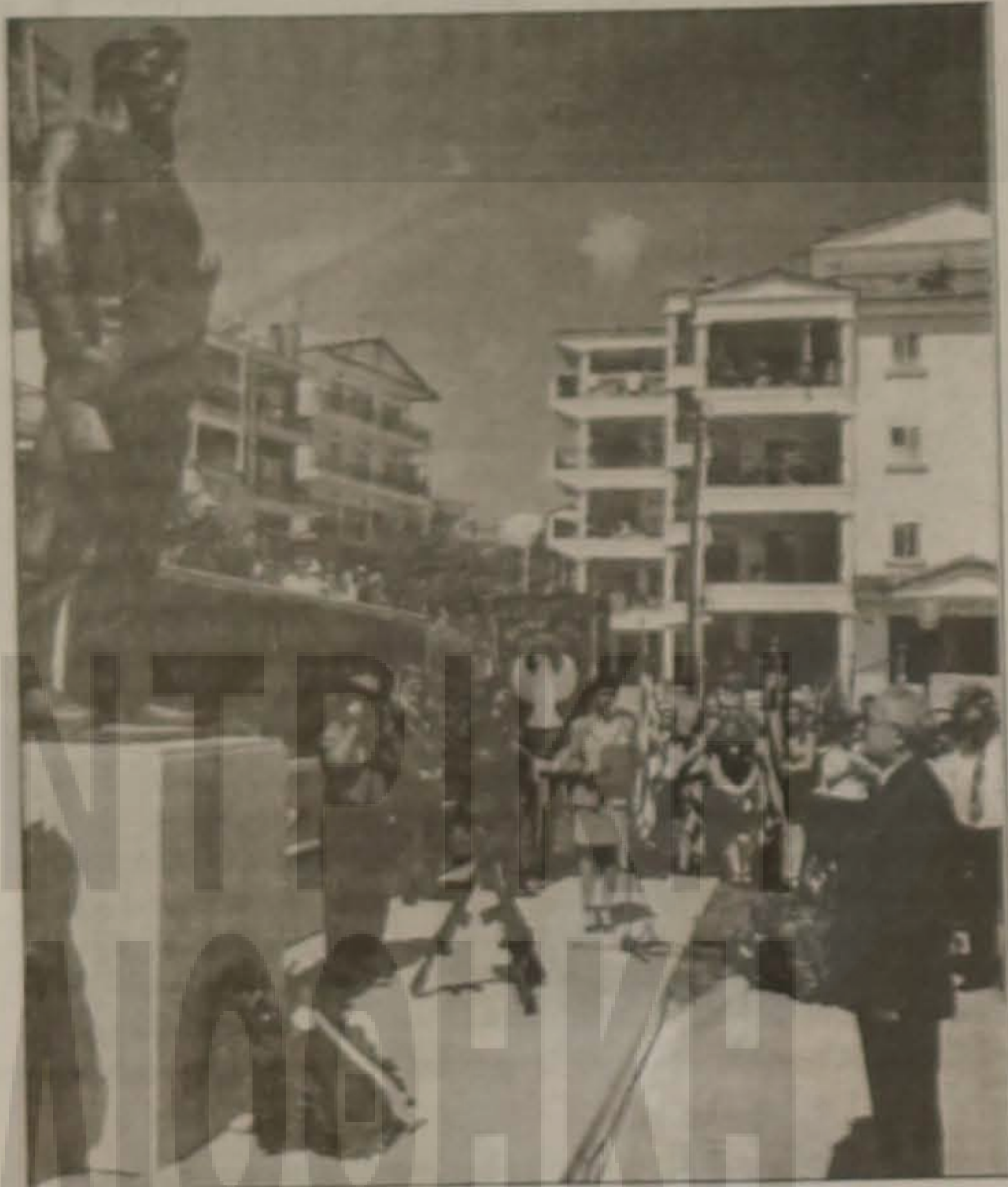
Ο Νομάρχης Ημαθίας κ. Γιάννης Σπάρτσας.