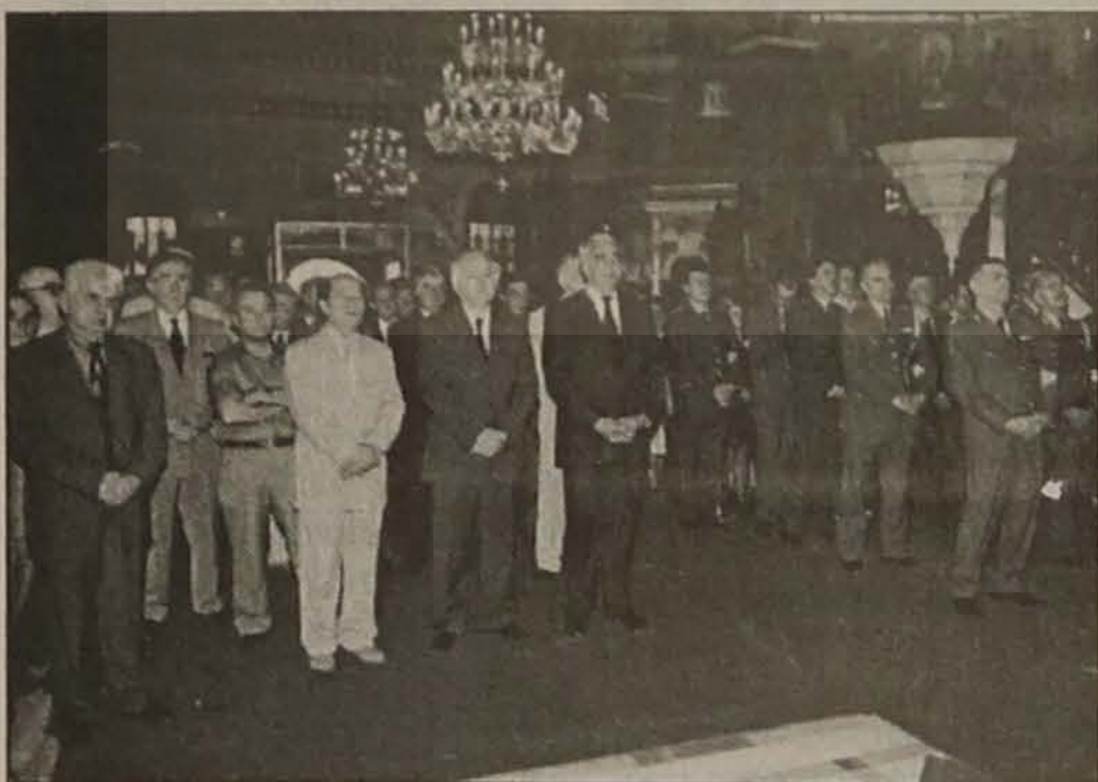
Οι αρχές και οι επίσημοι κατά την επιμνημόσυνη δέηση.