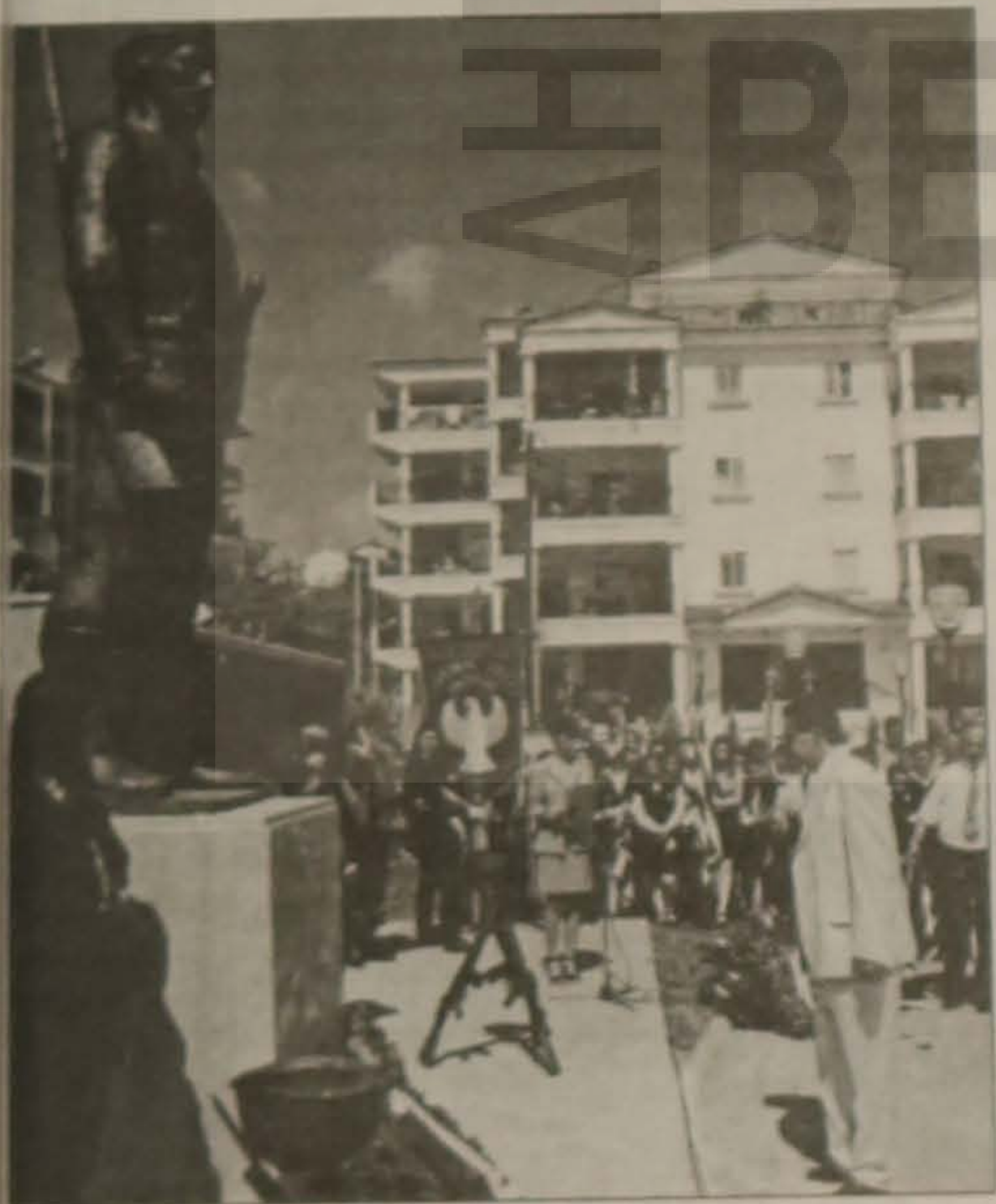
Ο Δήμαρχος Βέροιας κ. Γιάννης Χασιώτης.