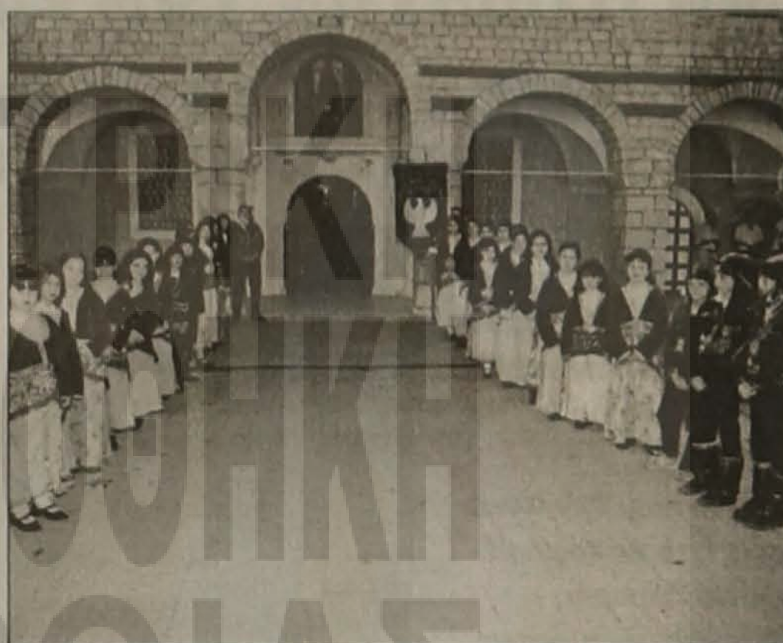
Η τιμητική παράταξη μπροστά από τον Ιερό Ναό Αγ. Αντωνίου, όπου τελέστηκε επιμνημόσυνη δέηση για τα θύματα της Γενοκτονίας των Ελλήνων του Πόντου.