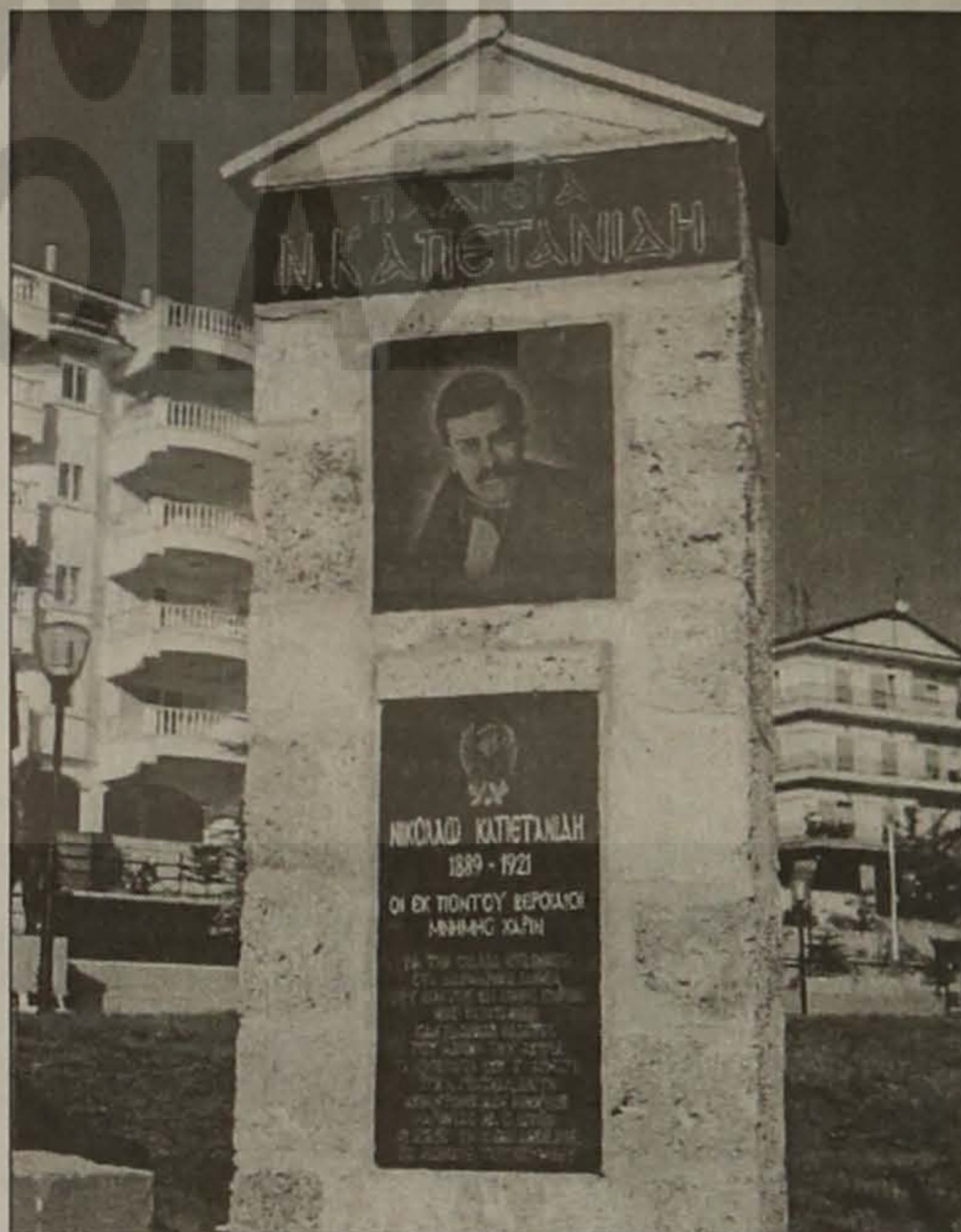
Τιμή και δόξα στον εθνομάρτυρα Νίκο Καπετανίδη.