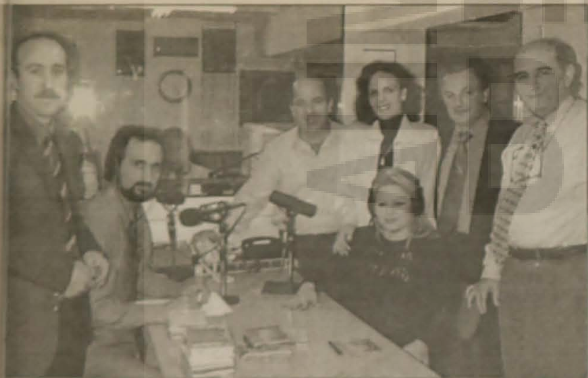
Από το νέο ξεκίνημα της ραδιοφωνικής εκπομπής της Ευξείνου Λέσχης Βεροίας στο Ράδιο Τύπος FM.