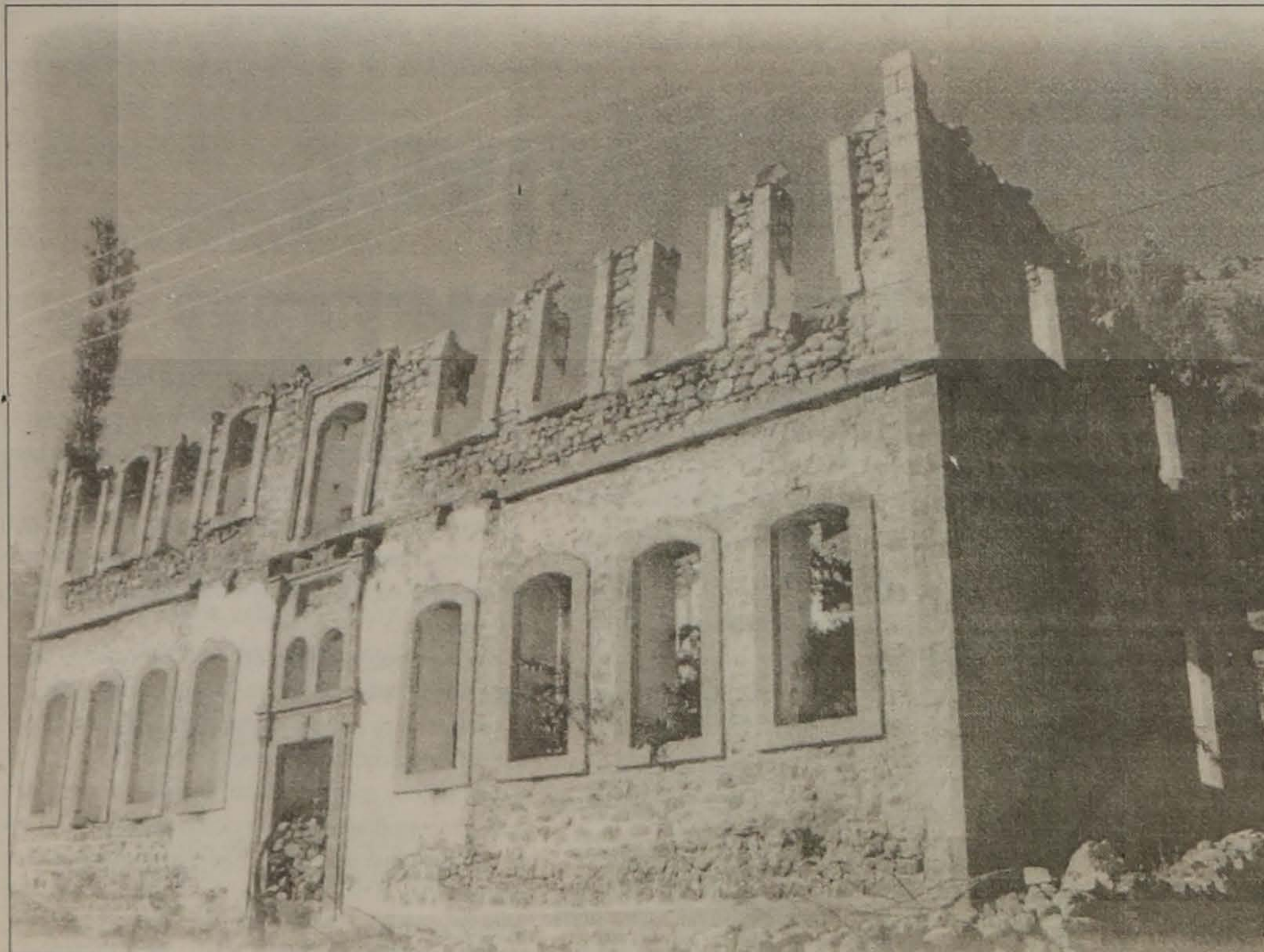
Το Μητροπολιτικό μέγαρο της Αργυρούπολης. Ο, τι απόμεινε...

Η ΡΩΜΑΝΙΑ ΚΙ ΑΝ ΠΕΡΑΣΕ ΛΗΘΕΙ ΚΑΙ ΦΕΡΕΙ ΚΙ ΑΛΛΟ