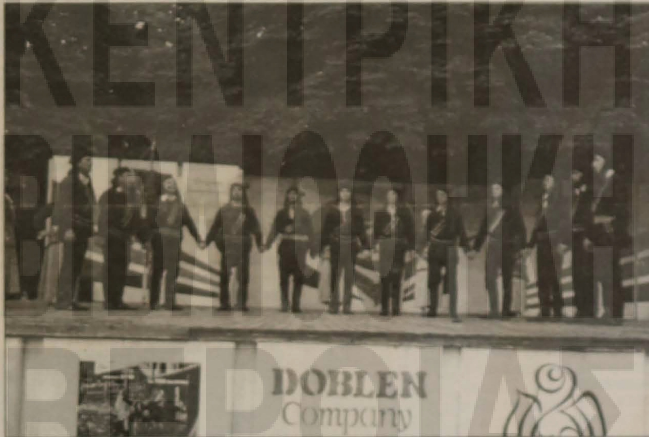
Στιγμιότυπο από τις εμφανίσεις του χορευτικού μας συγκροτήματος.

Δώσαμε δύσκολες εξετάσεις και πήραμε άριστα. Για τις χιλιάδες των θεατών, αν και ανακοινώθηκε το ιστορικό του Σωματίου μας, δεν είμασταν μόνο η Εύξεινος Λέσχη και η πόλη της Βέροιας αλλά η Ελλάδα.