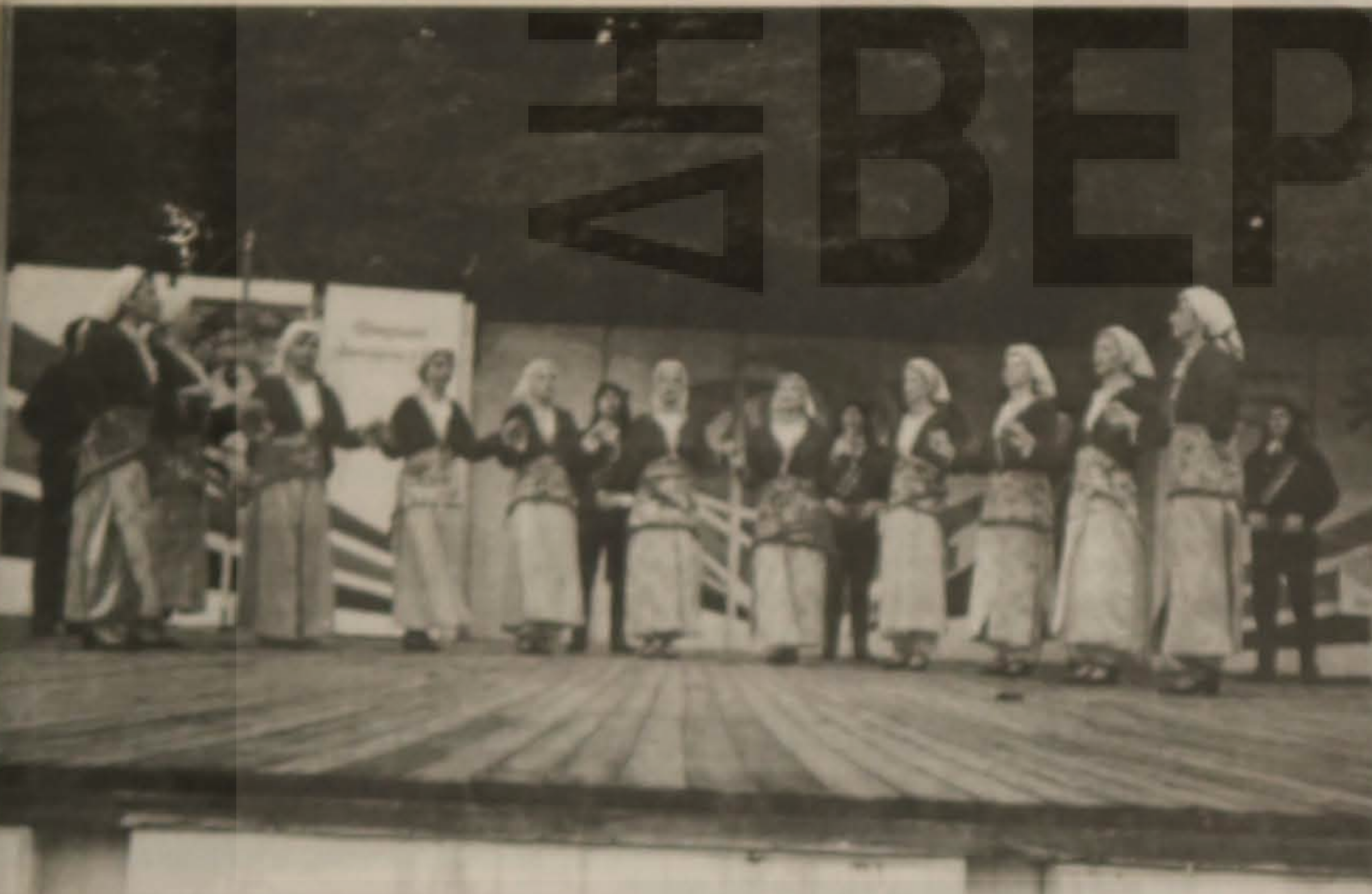
Στιγμιότυπο από τις εμφανίσεις των χορευτικών συγκροτημάτων μας.