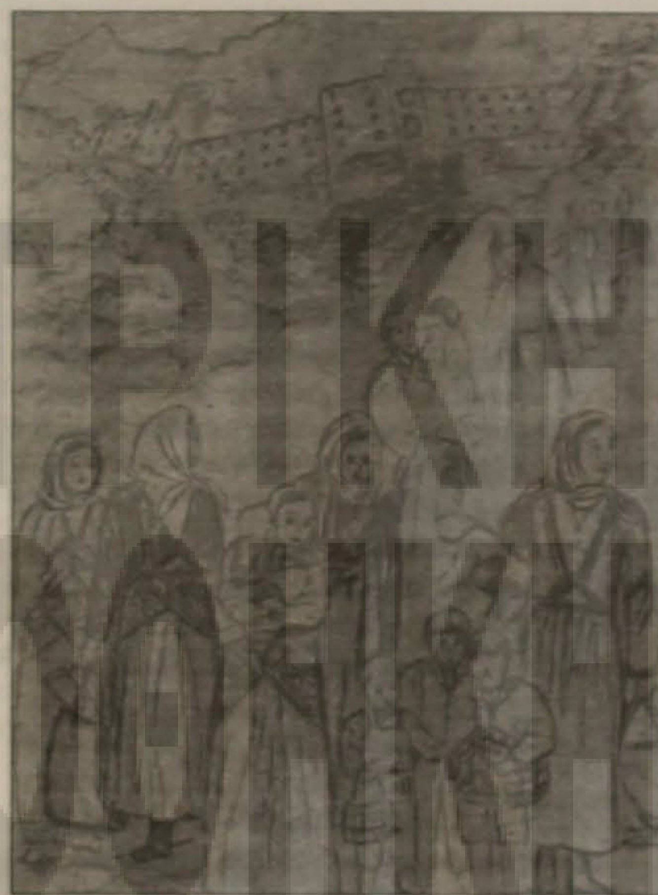
Εικόνα από το δράμα του Ξεριζωμού. Έργο της ζωγράφου κ. Βάσως Σιδηροπούλου - Καρα- μήτσου.

Και τα θύματα της τουρκικής θηριωδίας δε θα κοιμηθούν τον ήσυχο της αιωνιότητας ύπνο, ε- άν η επίσημη Τουρκία δε ζητήσει για το λογαρια- σμό της ιστορίας δημό- σια συγνώμη και δεν ε- γκαταλείψει τις βαρβα- ρότητες που συνεχίζει να διαπράττει. Εως τότε οι Τούρκοι θα έχουν πάνω