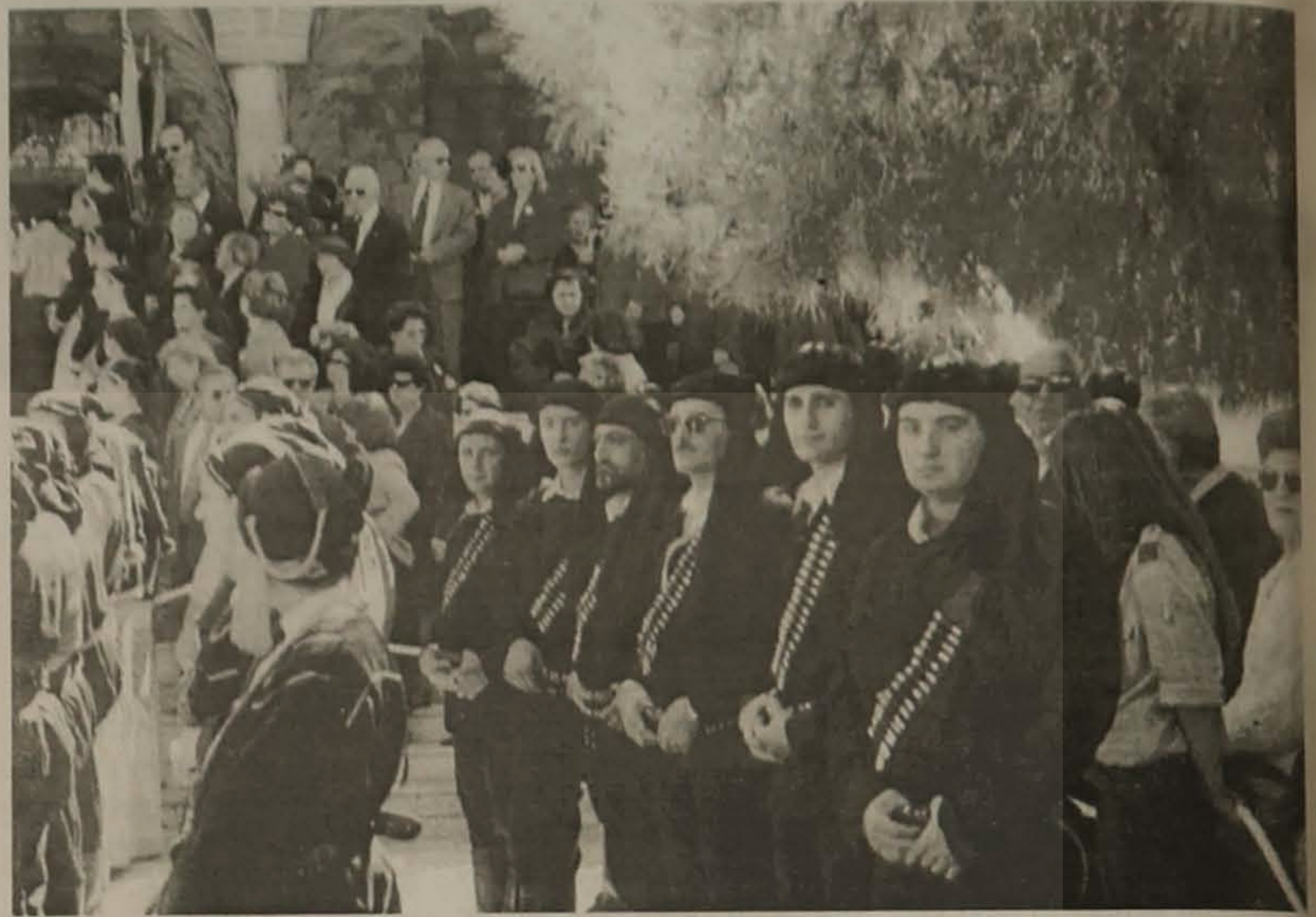
συνέχεια από την 1η σελ.

μακτος αυτός ιμπεριαλισμός δεν είναι βίαιος για να προκαλέσει θετικές αντιδράσεις. Το αποτέλεσμα έρχεται σταδιακά αλλά σίγουρα. Η νεολαία μας αποδεκατίζεται, το έθνος απονευρώνεται. Είναι η ώρα της συστράτευσης, της ομοψυχίας και των μεγάλων εξορμήσεων για μια πιο αποτρεπτική των κινδύνων αυτών προσπάθεια. Ξεκινήσαμε από την καρδιά της Μακεδονίας να δώσουμε όλοι μαζί τη σκληρή μάχη κατά της άκριτης, της ανεξέλεγκτης αυτής ξενομανίας που απειλεί την εθνική και πολιτιστική μας ταυτότητα. Να στηρίξουμε αυτό που αξίζει εκείνο που ταιριάζει στη χώρα του Παρθενώνα. Αλλά τα μακάβρια γεγονότα των Βαλκανίων απειλούν να ισοπεδώσουν τα πάντα. Οι δυνατοί της Γης μαστιγώνουν τη χώρα μας με κάθε είδους βρώμικες αξιώσεις που θυμίζουν μαύρες εποχές. Δεν σέβονται την Ιστορία ούτε την πολύτιμη προσφορά μας σε κοινούς αγώνες για πανανθρώπινα ιδανικά. Μας οδηγούν στο δρόμο του εγκλήματος καταλύοντας θεμελιώδεις αξίες της ζωής και κάθε κανόνα δικαίου.