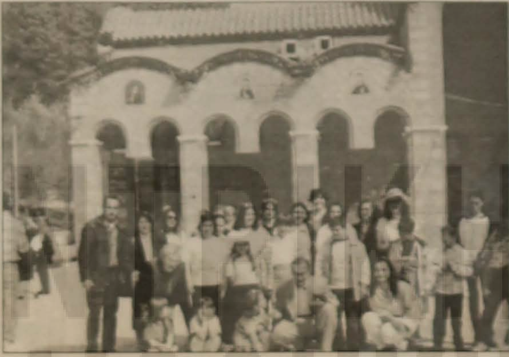
Νέοι και νέες της Ευξείνου Λέσχης Βέροιας προσεύχονται για την ειρήνη στα Βαλκάνια

Το πρόγραμμα τηρήθηκε πιστά αλλά συνέβη και κάτι τελείως απρόβλεπτο με πολλούς αποδέ-