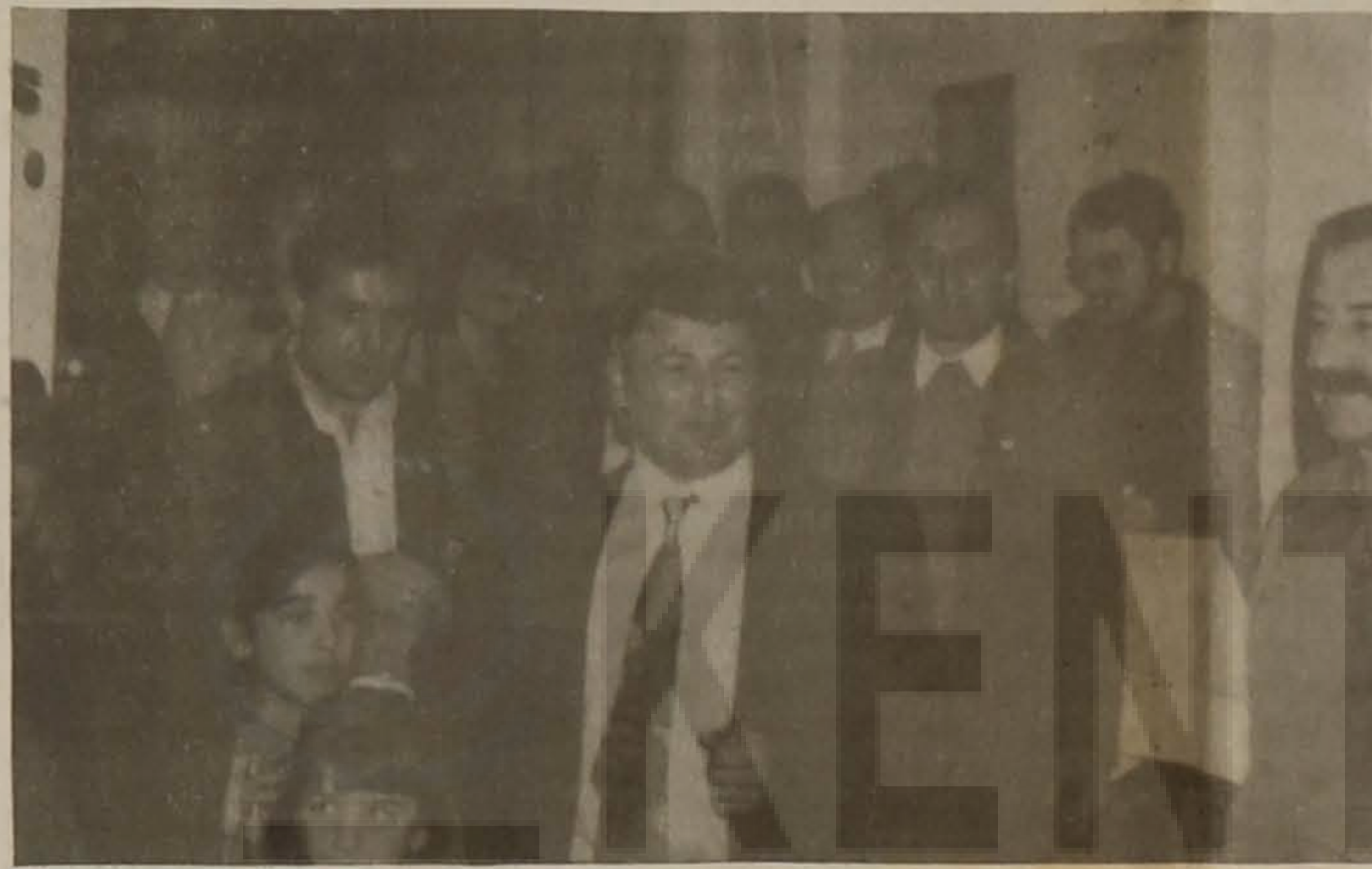
Στιγμιότυπο από την εκδήλωση.