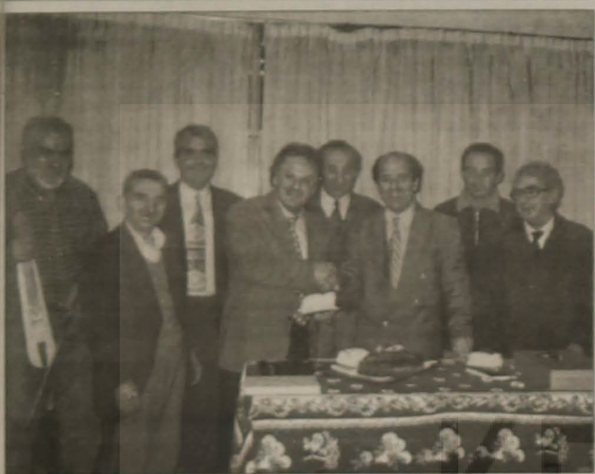
Αναμνηστική φωτογραφία από την κοπή της βασιλόπιτας της Ε.Λ.Β.