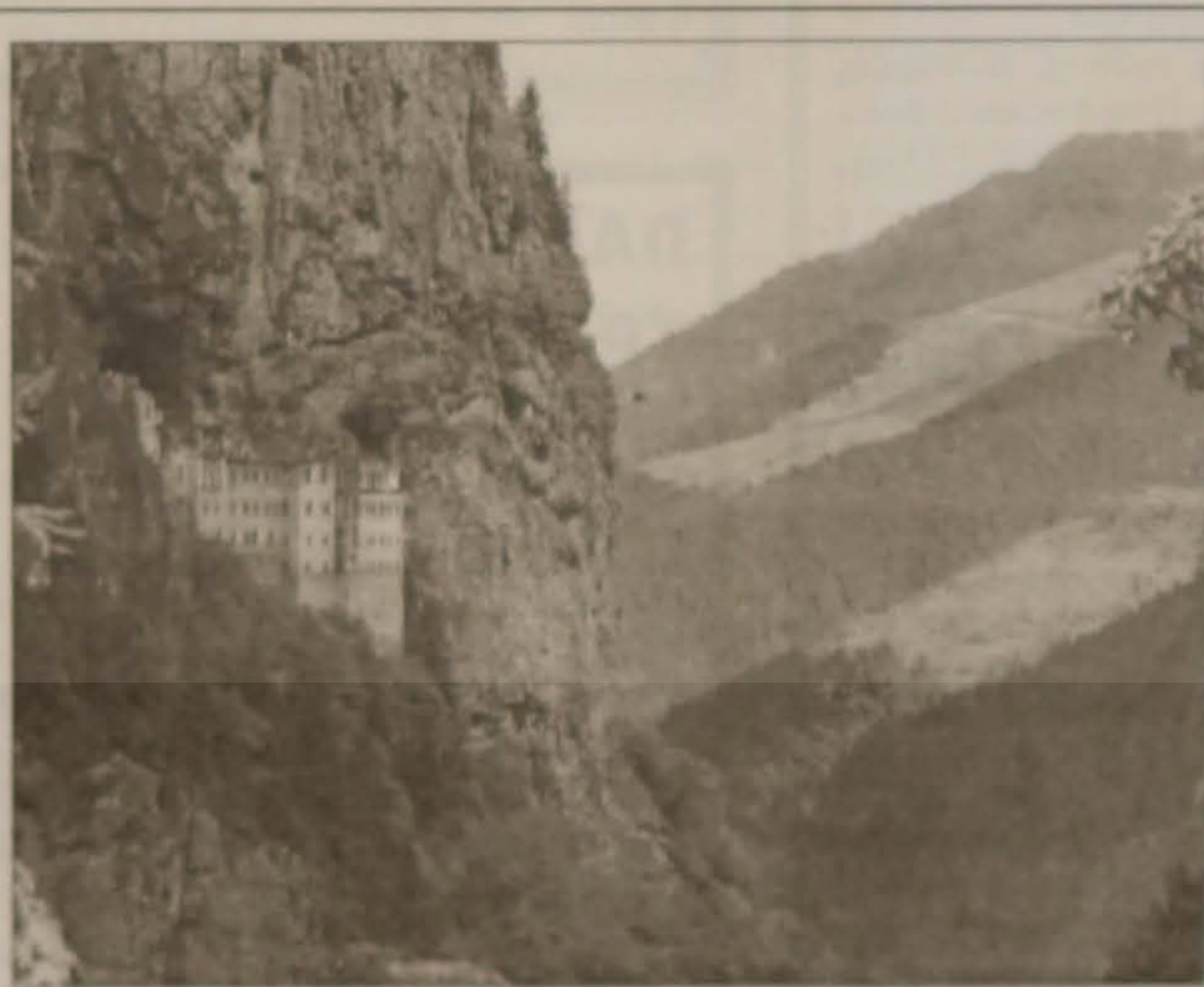
ΠΑΝΑΓΙΑ ΣΟΥΜΕΛΑ ΠΟΝΤΟΥ Χτίστηκε το 386 μ.Χ.

Με πολλή αγάπη Για το Δ.Σ. Ο Πρόεδρος ΚΩΣΤΑΣ ΚΑΜΠΟΥΡΔΗΣ Ο Γεν. Γραμματέας ΜΙΧ. ΓΕΡΑΣΙΜΙΔΗΣ Από το Αρχείο του «Αργοναύτη».