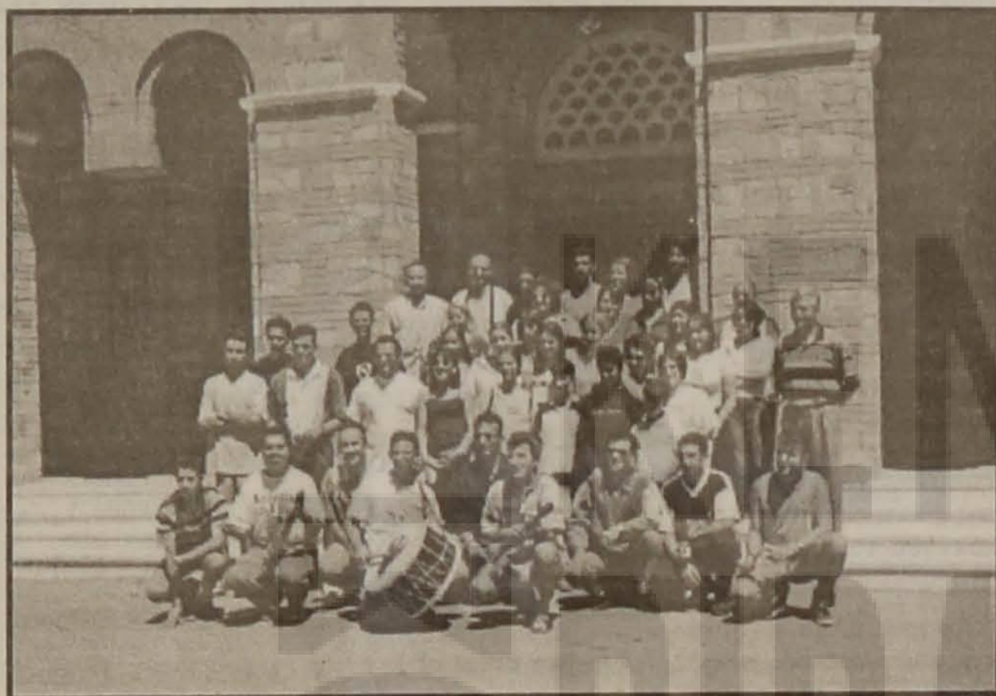
Μπροστά στον Ιερό Ναό της Παναγίας Σουμελά