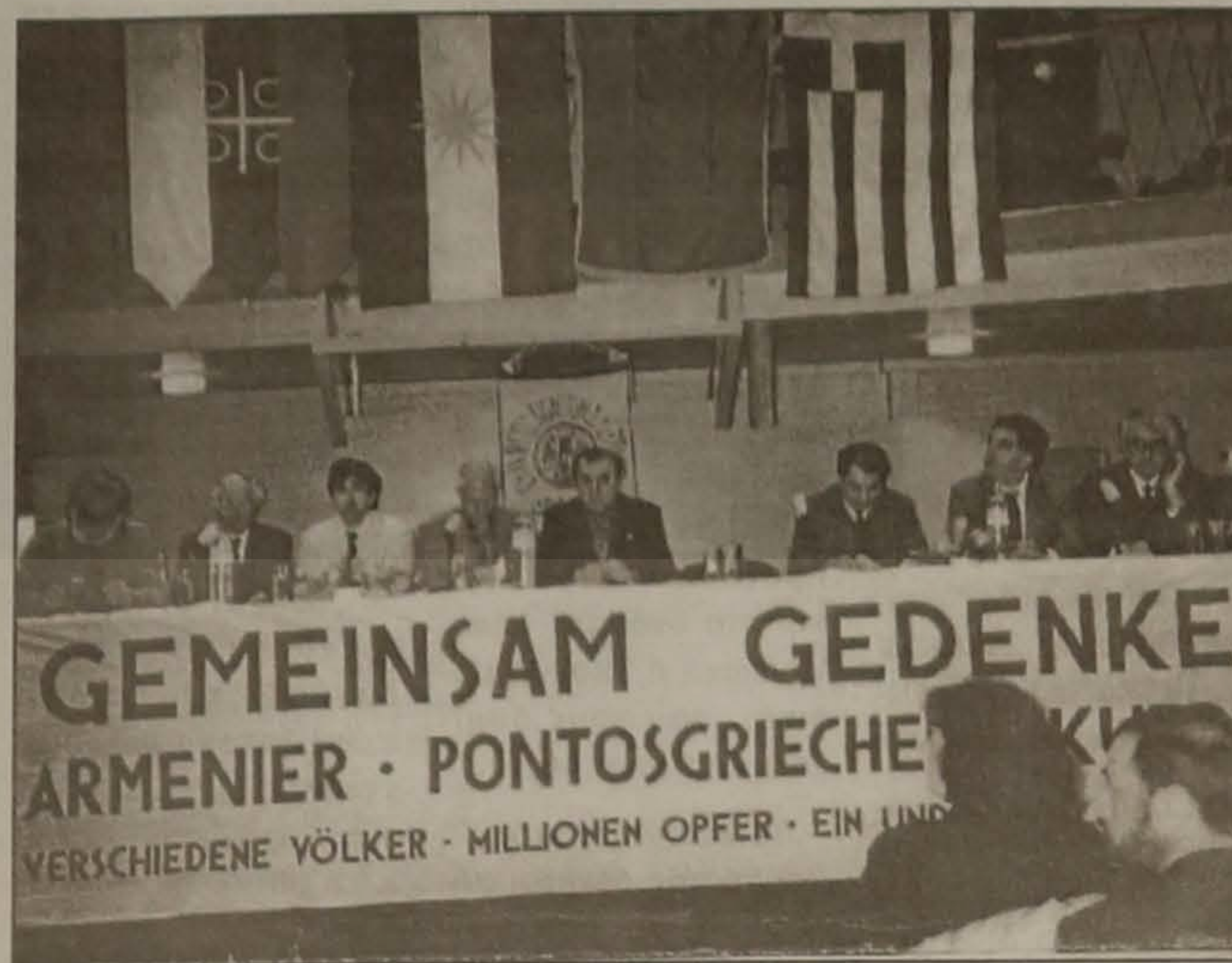
Διακρίνονται οι εκπρόσωποι των διοργανωτών φορέων και οι εισηγητές. Από την αίθουσα του Πολυτεχνείου.

Ο καιρός ωρίμασε, η απάνθρωπη επιθετική και εξτρεμική πολιτική