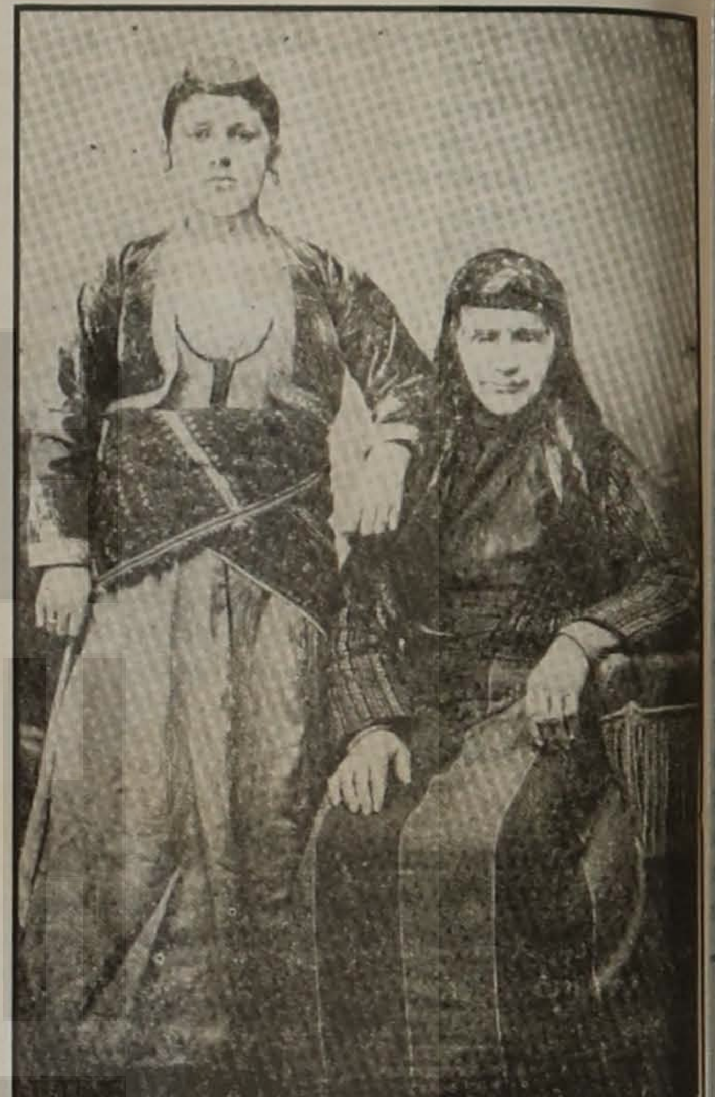
Τραπεζουντέτσα οικοδέσποινα με τη νύφη της "άμω λαμπάδαν 'ς σον γιόν 'α τς". Φωτογραφία 1904.

2. Δρασκελήση. Όταν κανείς διασκελίζη (καβαλλήκεψη) κάποιον του παίρνει τα χρόνια. Το κακό θεραπεύεται αν διασκελήση και κατ'αντιθετη φορά.