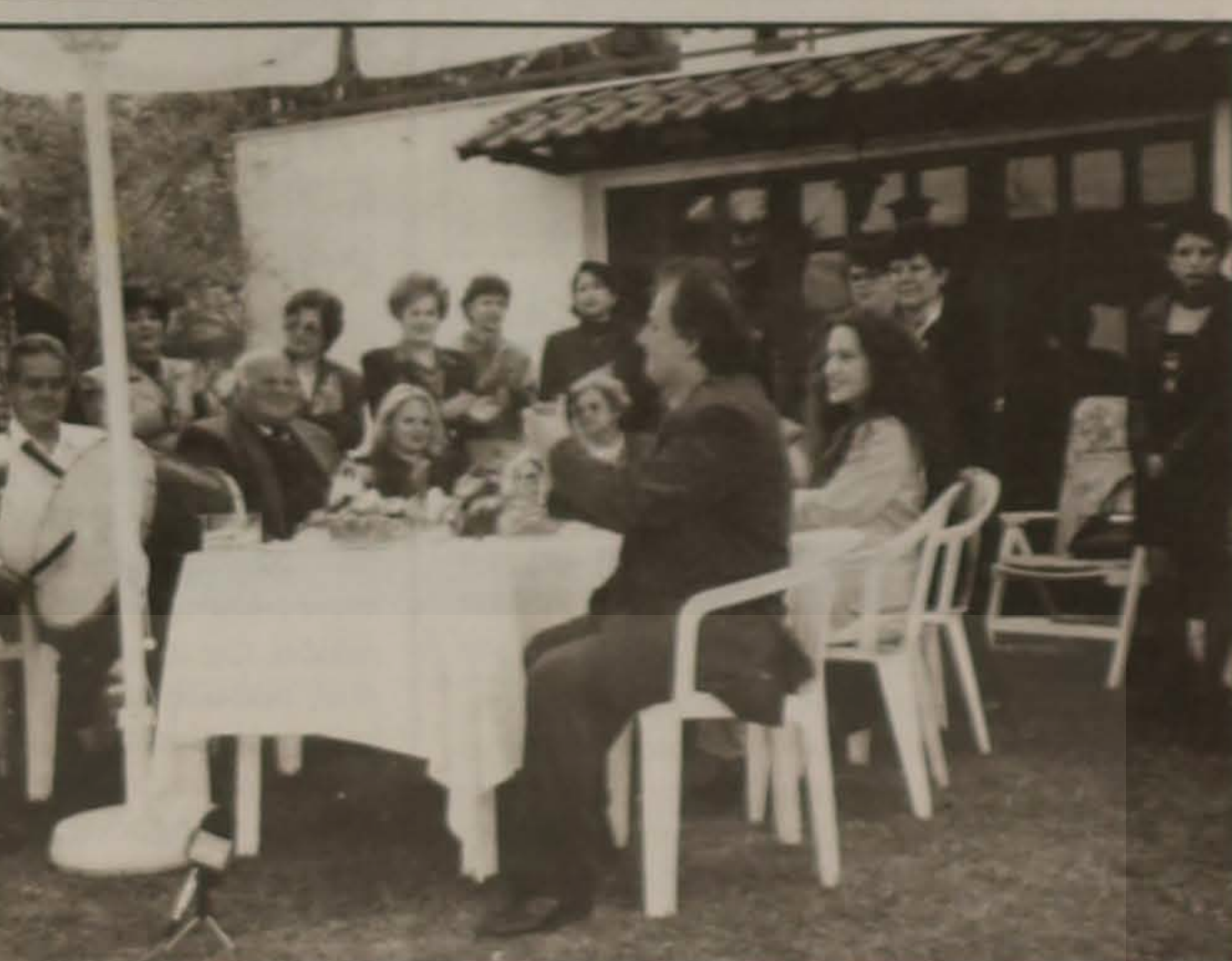
Στιγμιότυπο από την εκπομπή "Καλημέρα Ελλάδα"

Το σμείωτο ενδιαφέρον της εκπομπής "Καλημέρα Ελλάδα" για την ανεκτίμητη ελληνική παράδοση επιδεικνύεται κάθε μέρα.