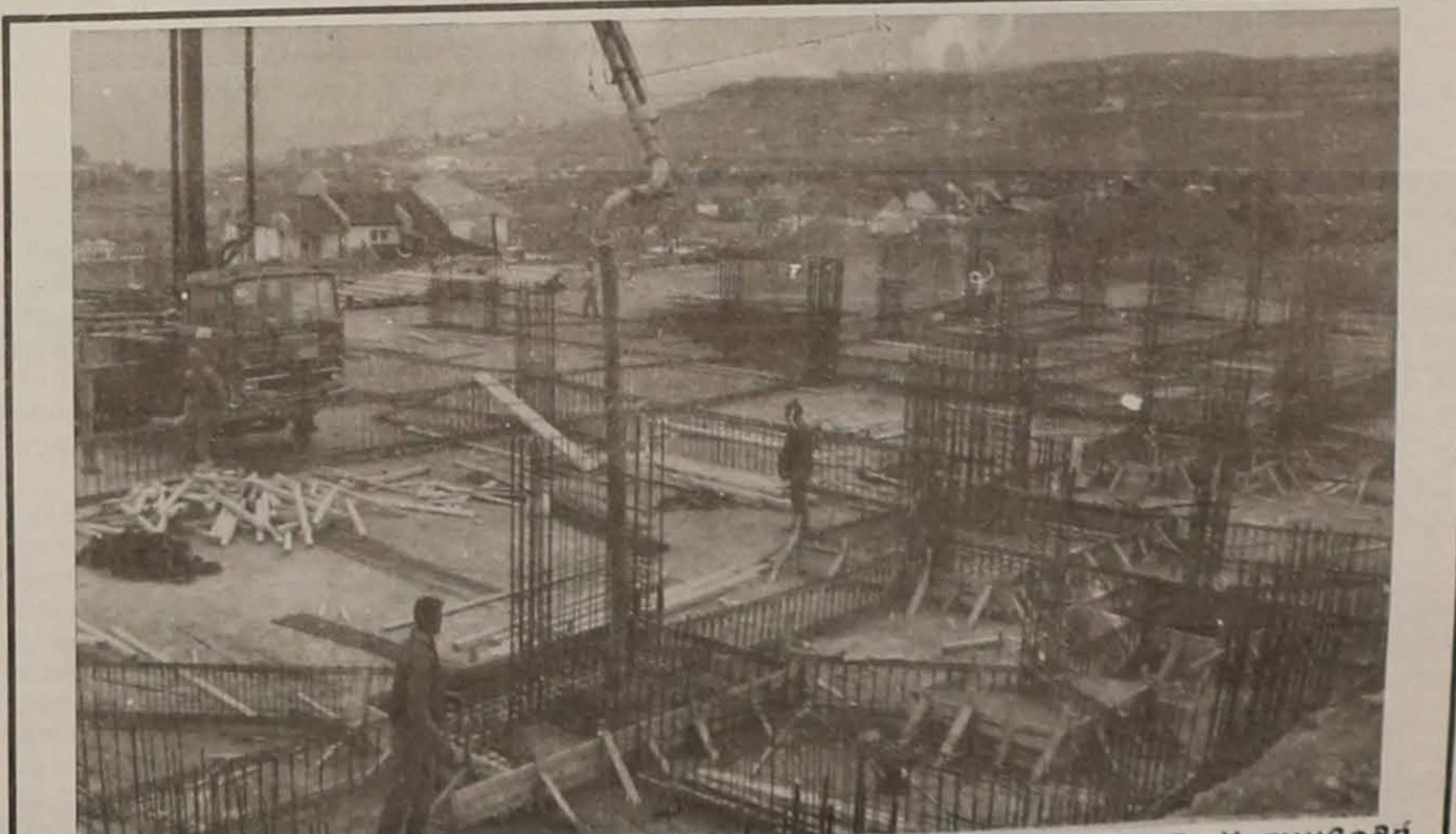
Το υπό ανέγερση Ποιητιστικό - Πνευματικό Κέντρο της Ε.Λ.Β. Η συμβολή όλων στην περάτωση του έργου κρίνεται αναγκαία και επιβεβαιημένη.