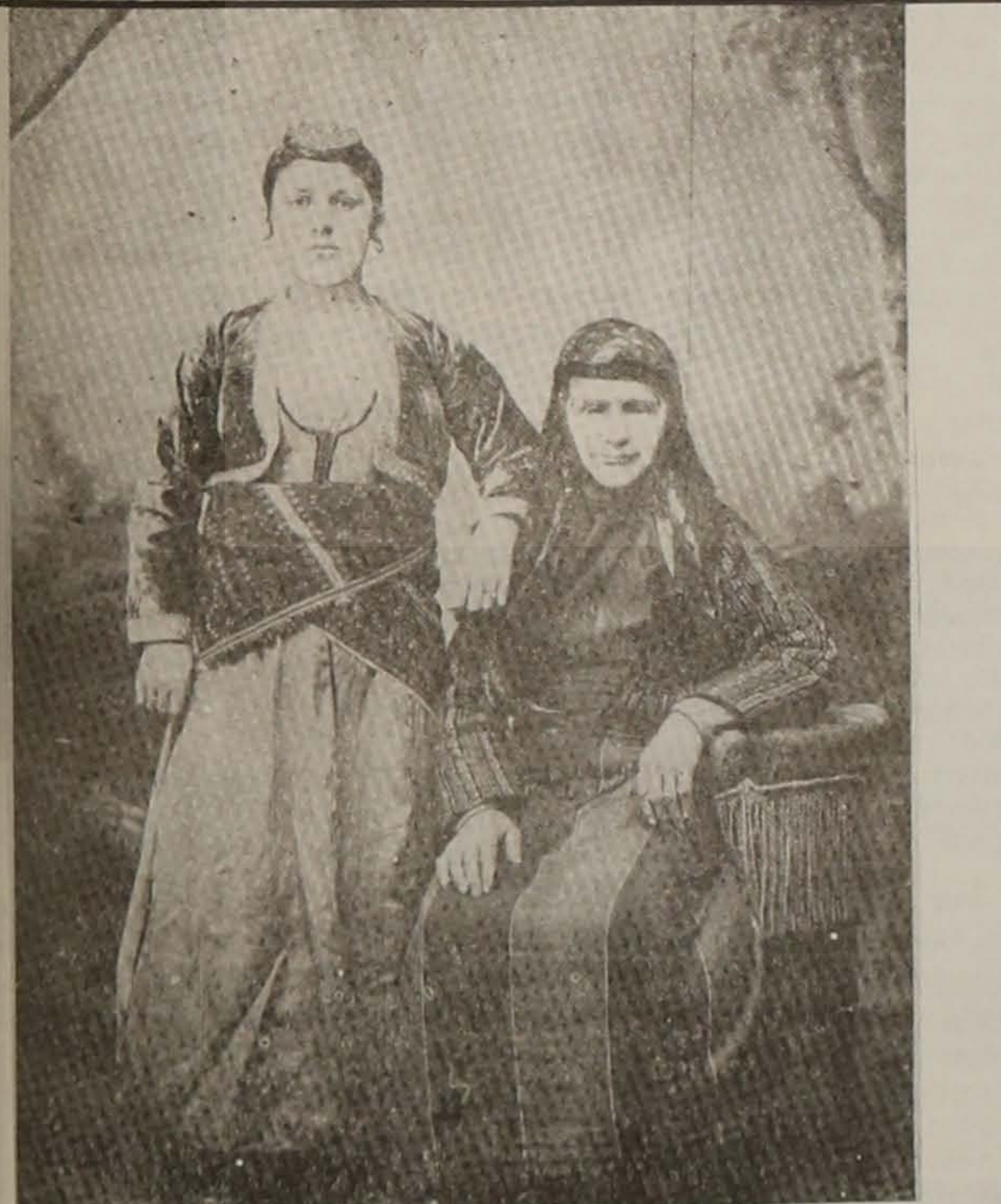
Τραπεζουντέσα οικοδόσποινα με τη νύφη της "άμον λαμπάδον 'ς σο γιάν 'α τς". Φωτογραφία 1904. Προσφορά Ανατολής Χειμωνίδη στην "Ποντιακή Εστία", τεύχος 30ο, έτος 1979.