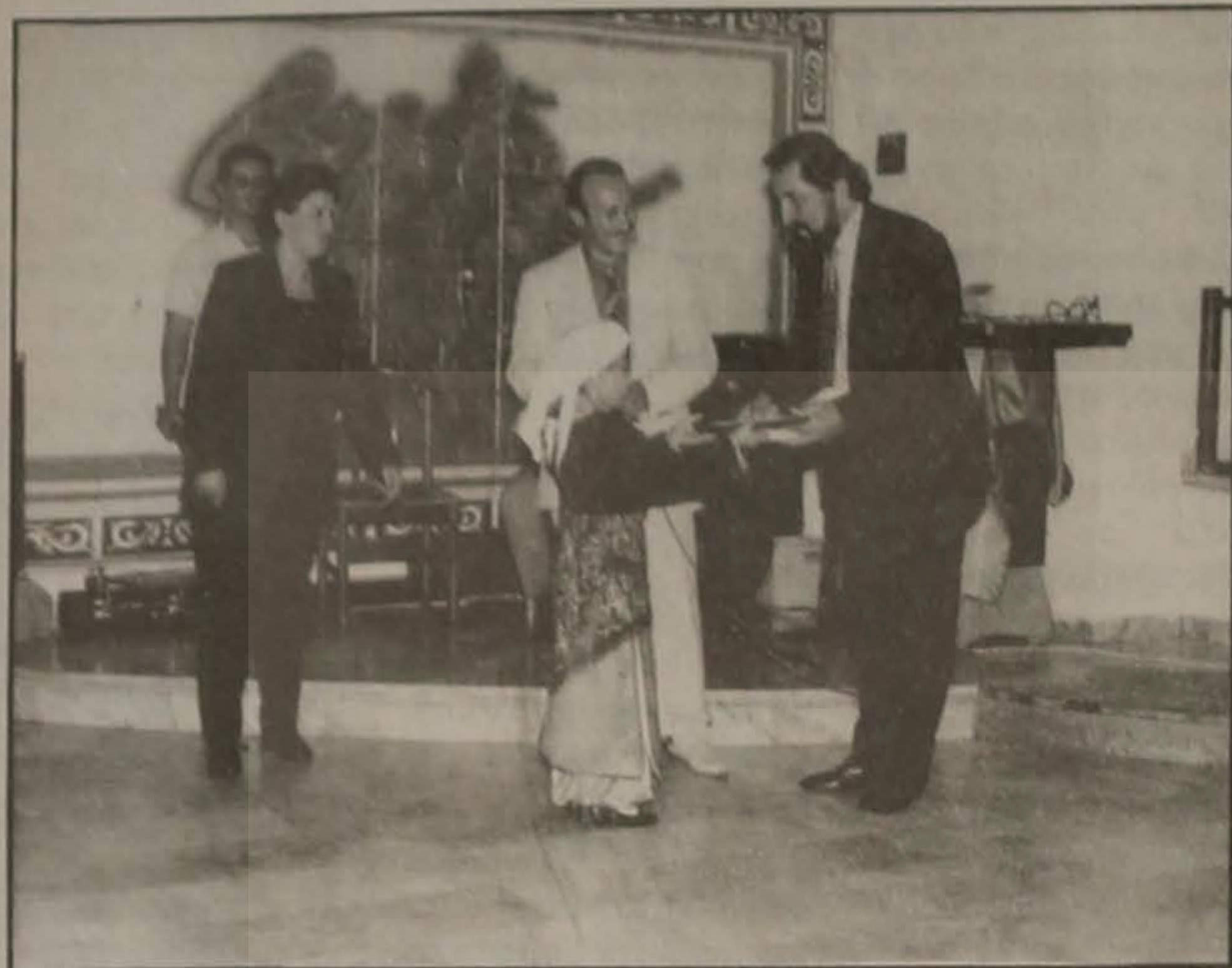
Στιγμιότυπο από την απονομή της αναμνηστικής πλάκετας.

Ο γνωστός καλλιτέχνης - ηθοποιός Λάζαρος Τερζάς επισκέφθηκε την πόλη μας στις 5 Σεπτεμβρίου 1997 στα πλαίσια της εκδήλωσης του χορού του τμήματος Νέων της Ευξείνου Λέσχης της Βέροιας στο Δημοτικό Τουριστικό Περίπτερο ΕΛΙΑ.