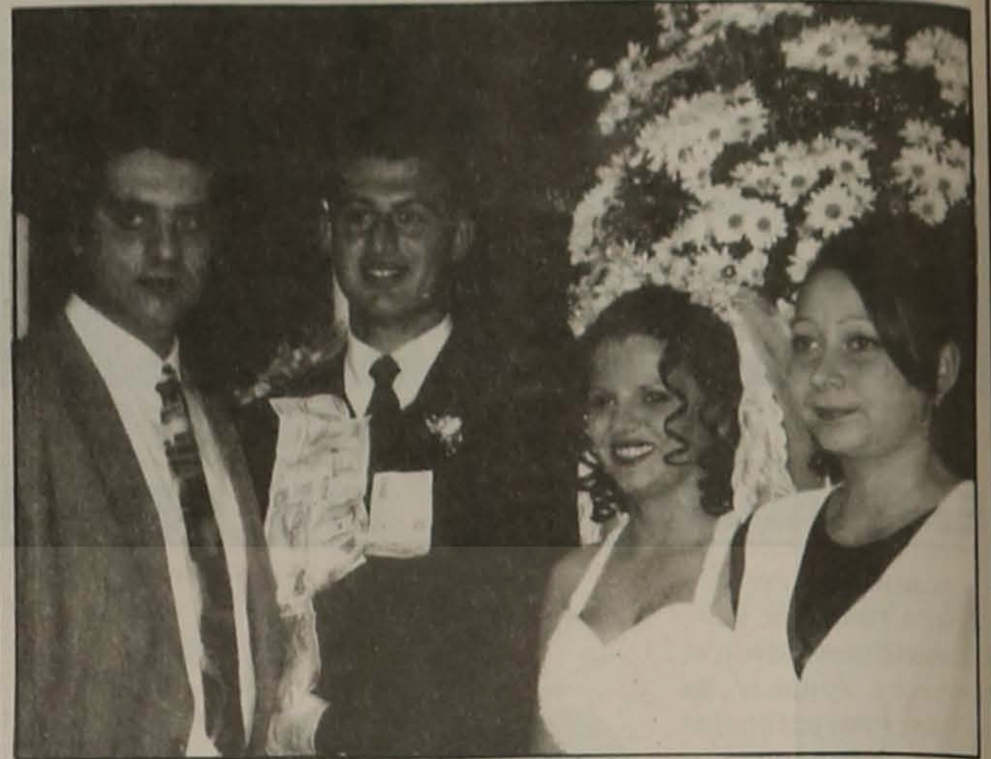
Οι νεόνυμφοι - Να ζήσουν!

"Πατέρα δόμα την ευχή σ' θα πάγω στεφανούμαι.